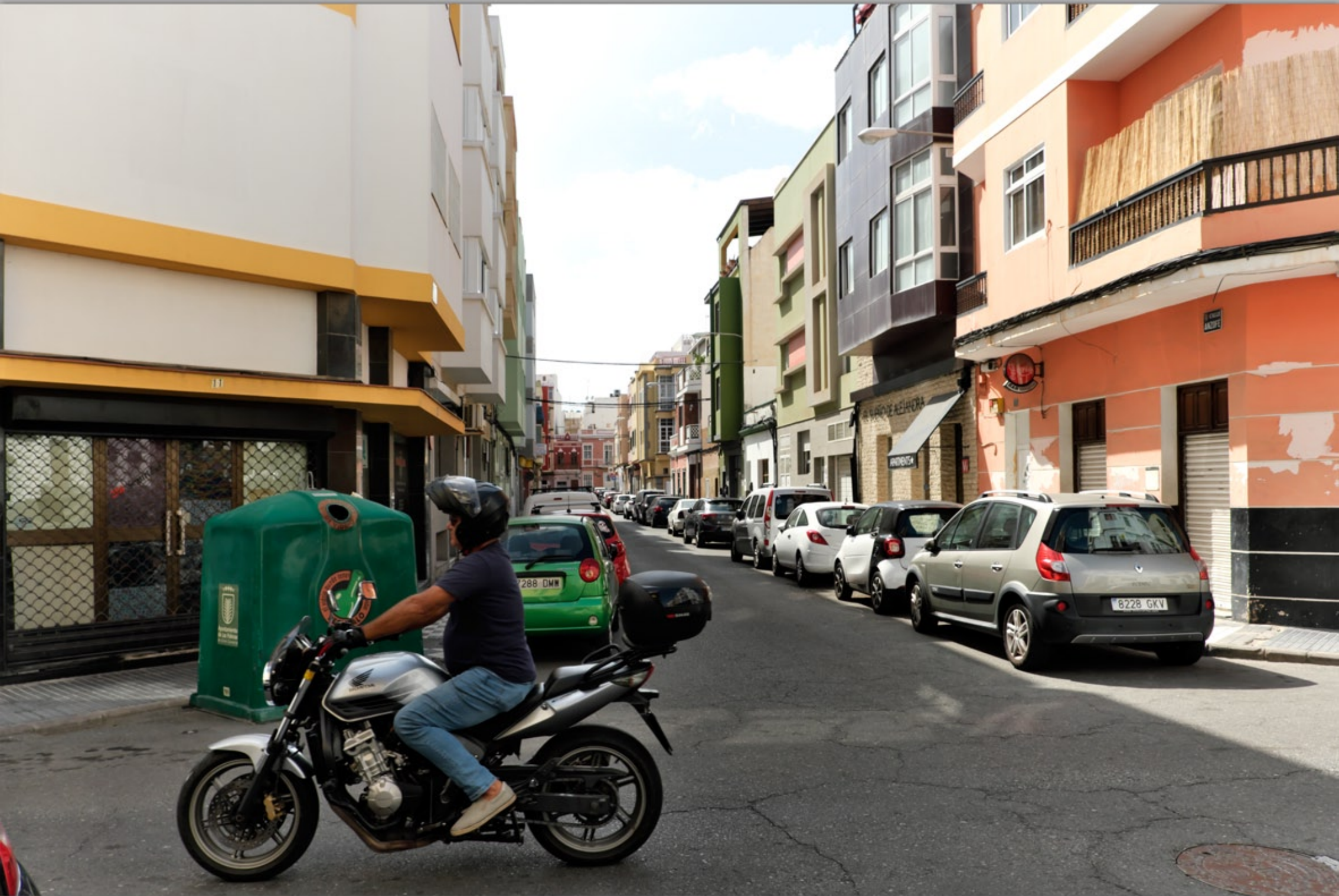
LAS PALMAS - Puerto