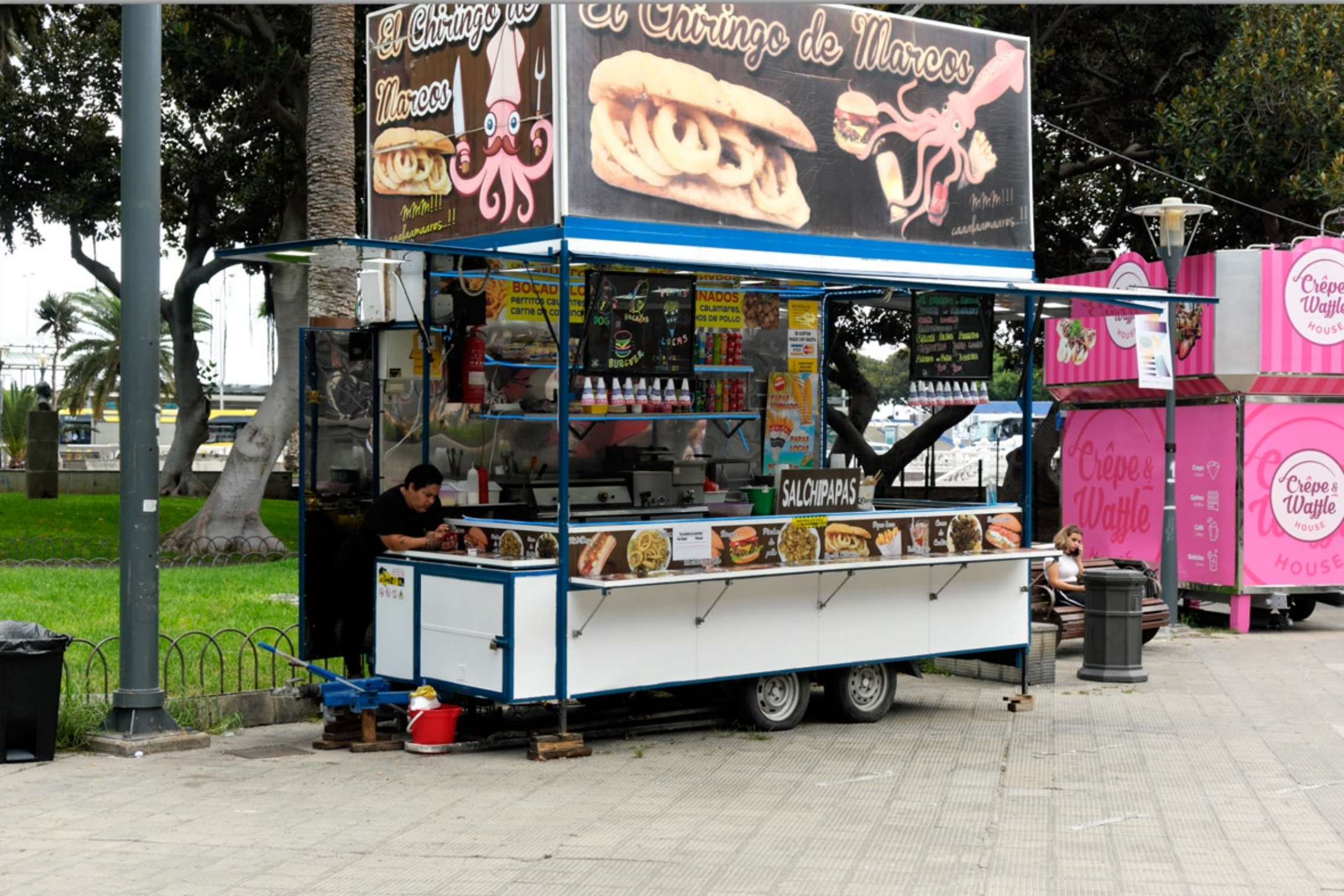
LAS PALMAS - San Telmo #Parque de San Telmo