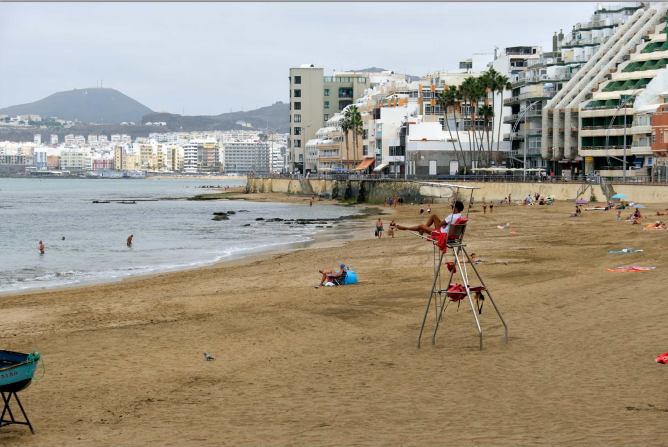
LAS PALMAS - Santa Catalina #Playa de Las Canteras (Strand & Promenade)