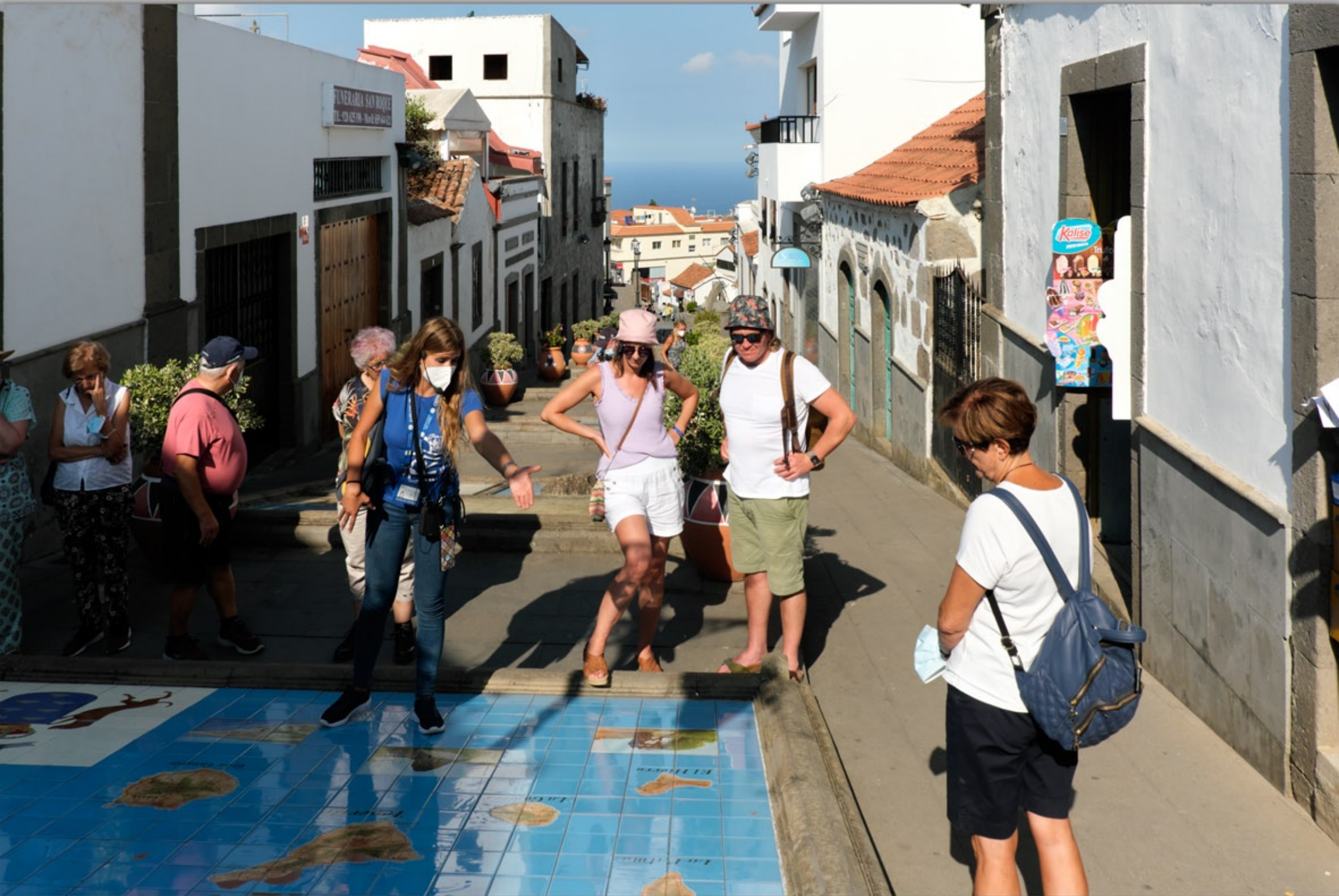
FIRGAS #Promenade Paseo de Gran Canaria