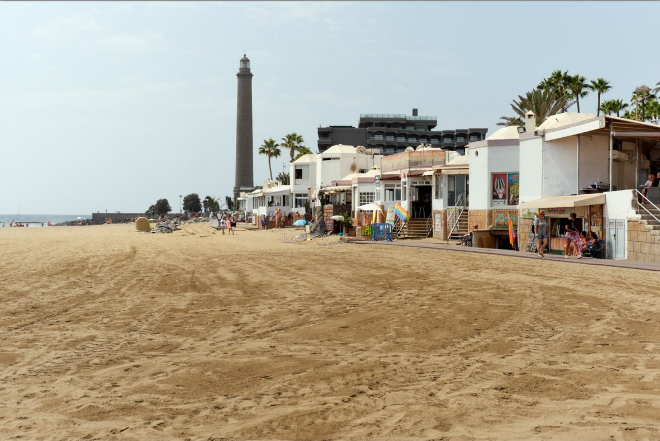
MASPALOMAS #El Oasis de Maspalomas