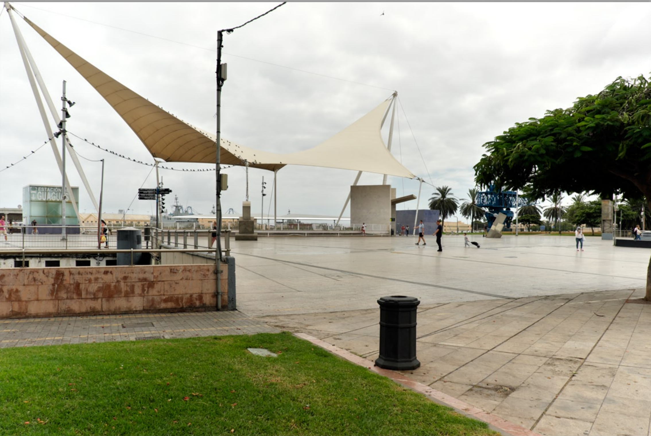
LAS PALMAS - Santa Catalina #Parque Santa Catalina #unterirdischer Busbahnhof