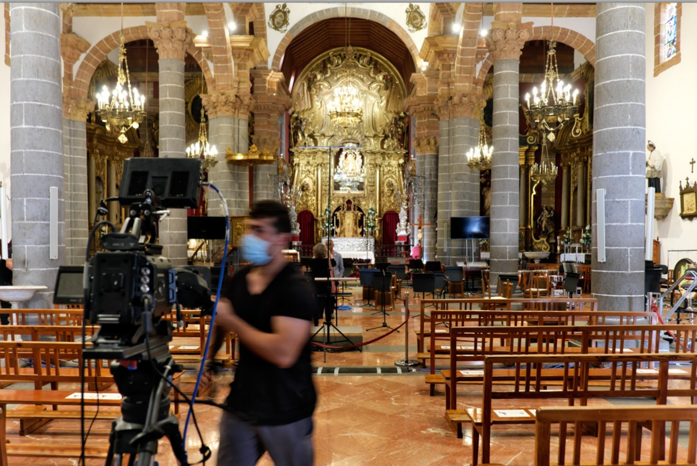
TEROR #Basilica Nuestra Senora Del Pino