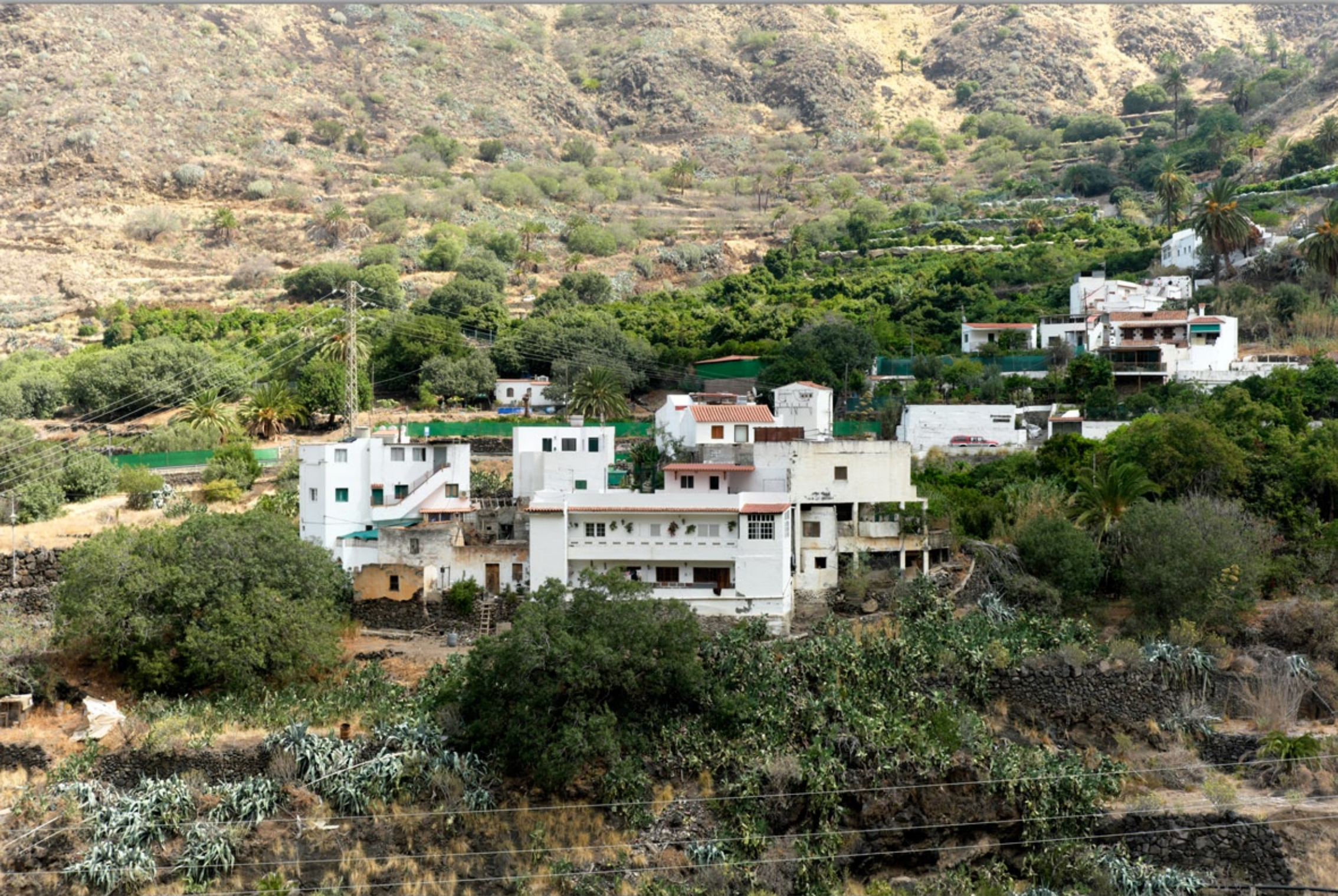
FINCA LA LAJA & BODEGA LOS BERRAZALES