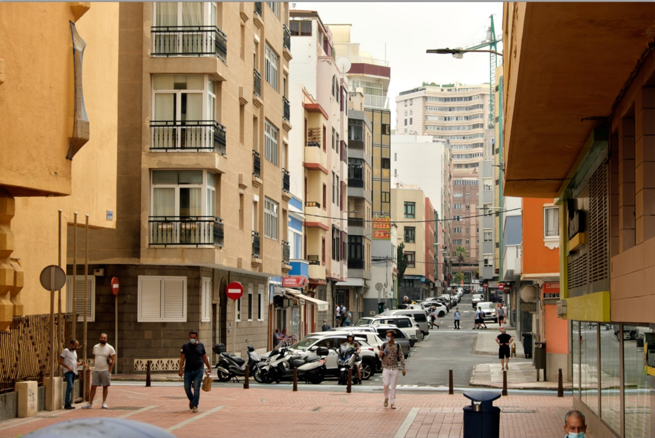
LAS PALMAS - Santa Catalina