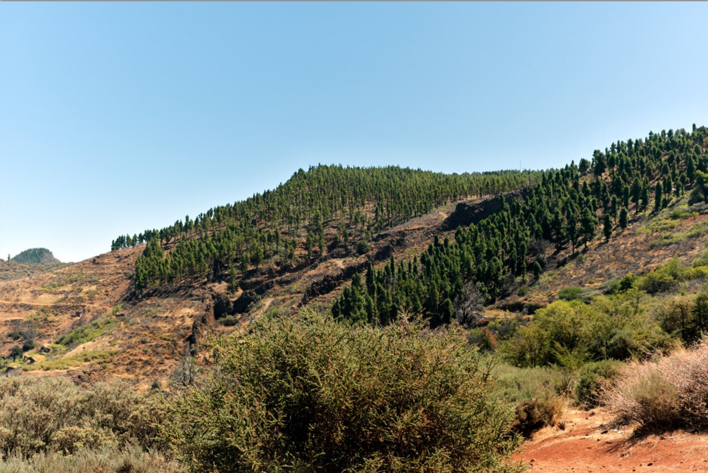
Vulkan-Berge #Kanarische Kiefern