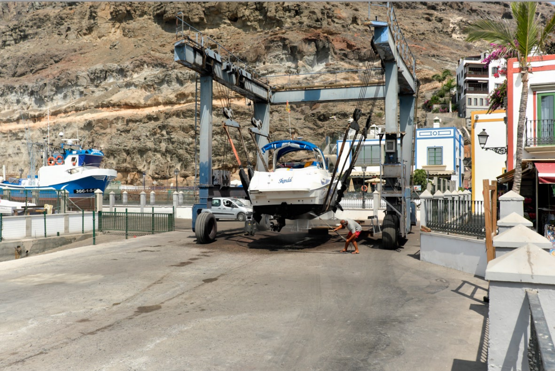
PUERTO DE MOGÁN