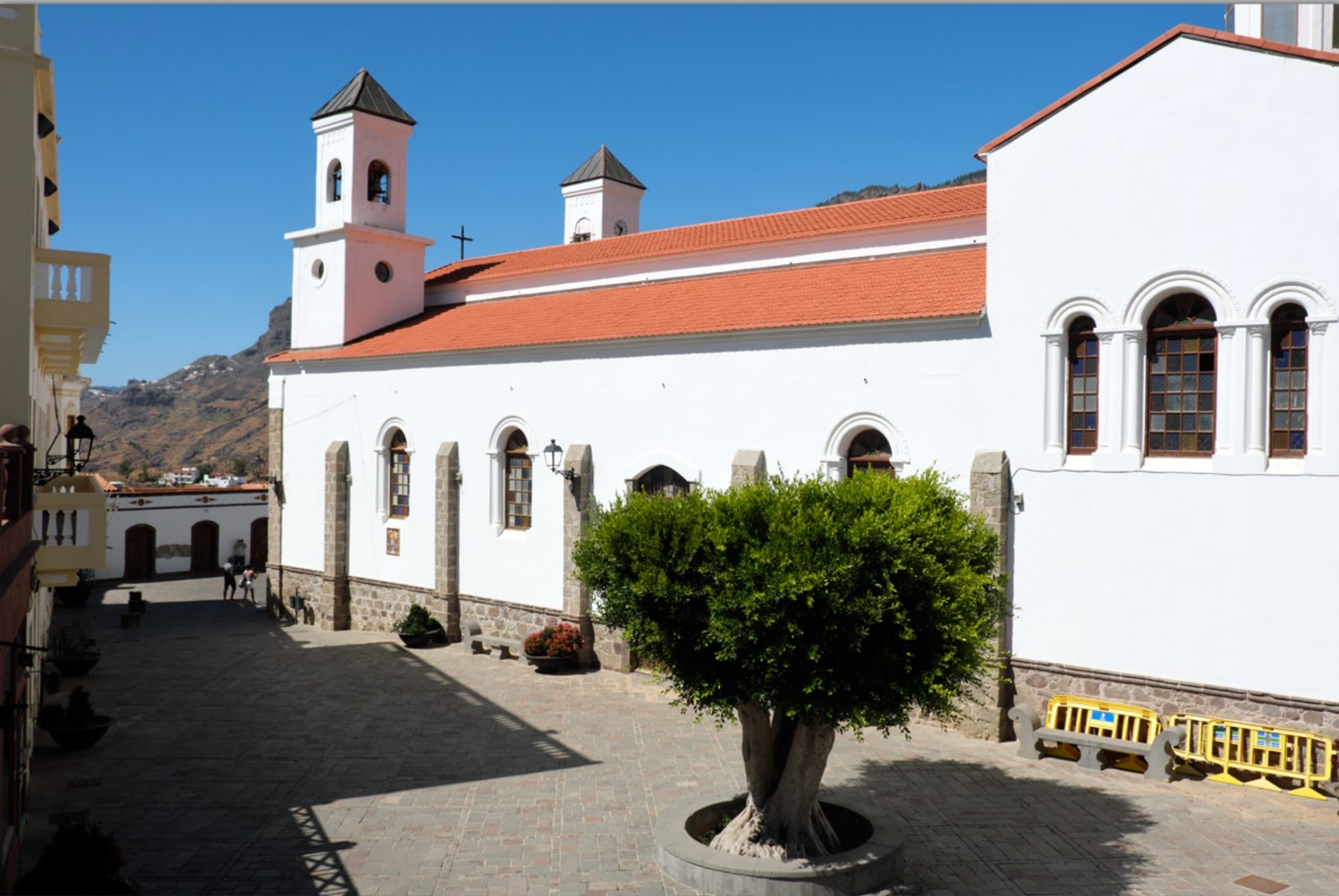
TEJEDA #Iglesia Nuestra Señora del Socorro