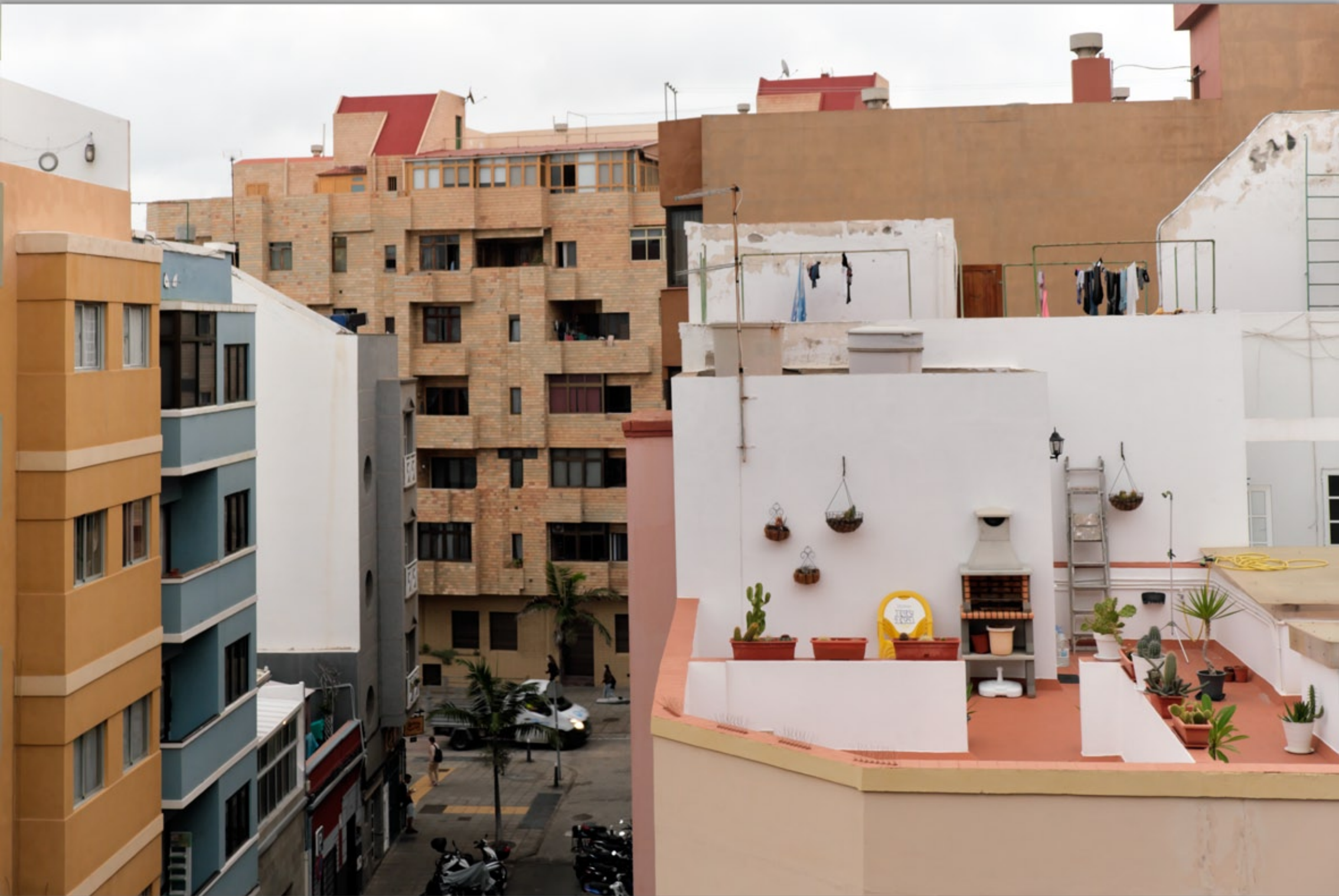
LAS PALMAS - Santa Catalina