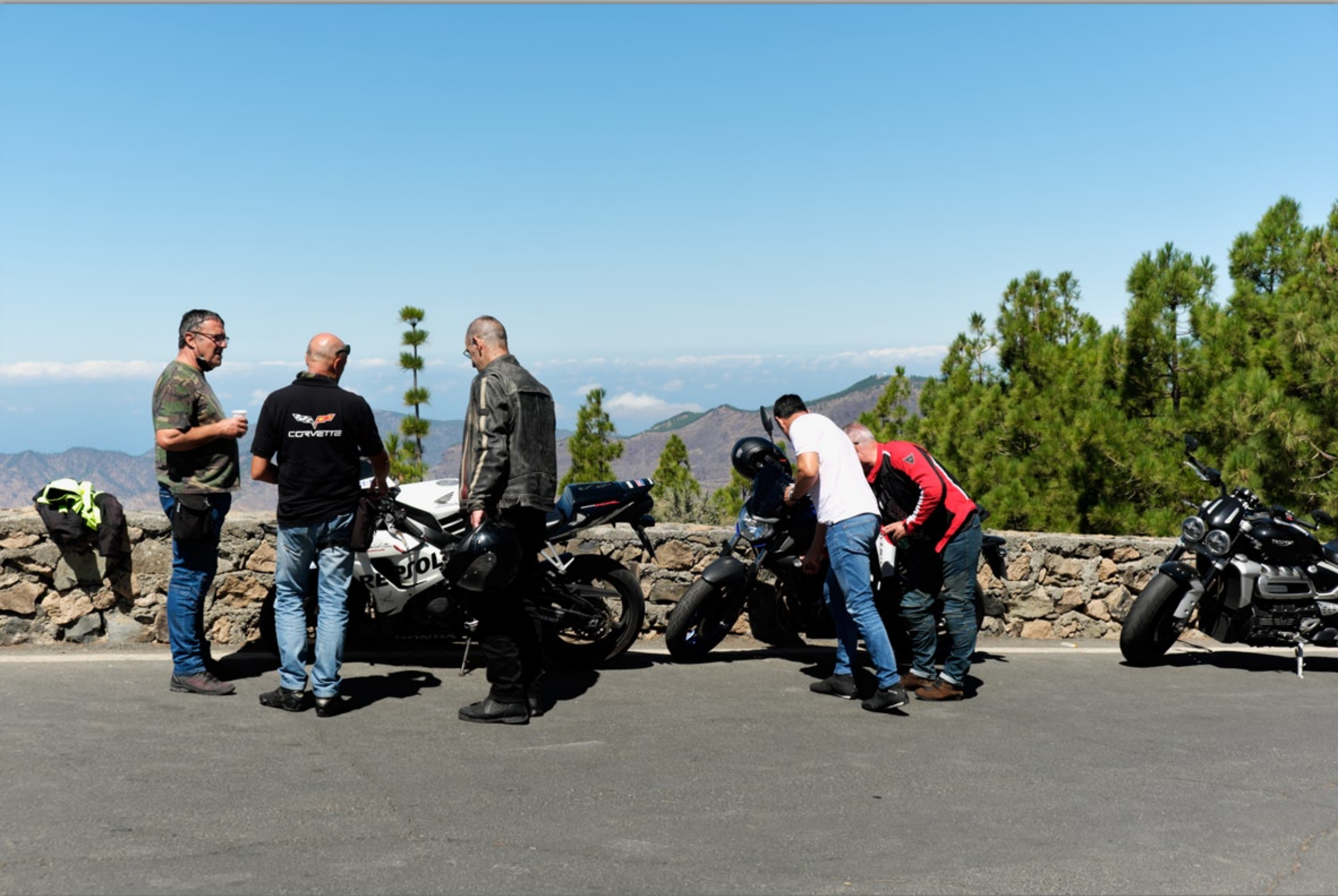
PICO DE LAS NIEVES (Vulkan-Berge)