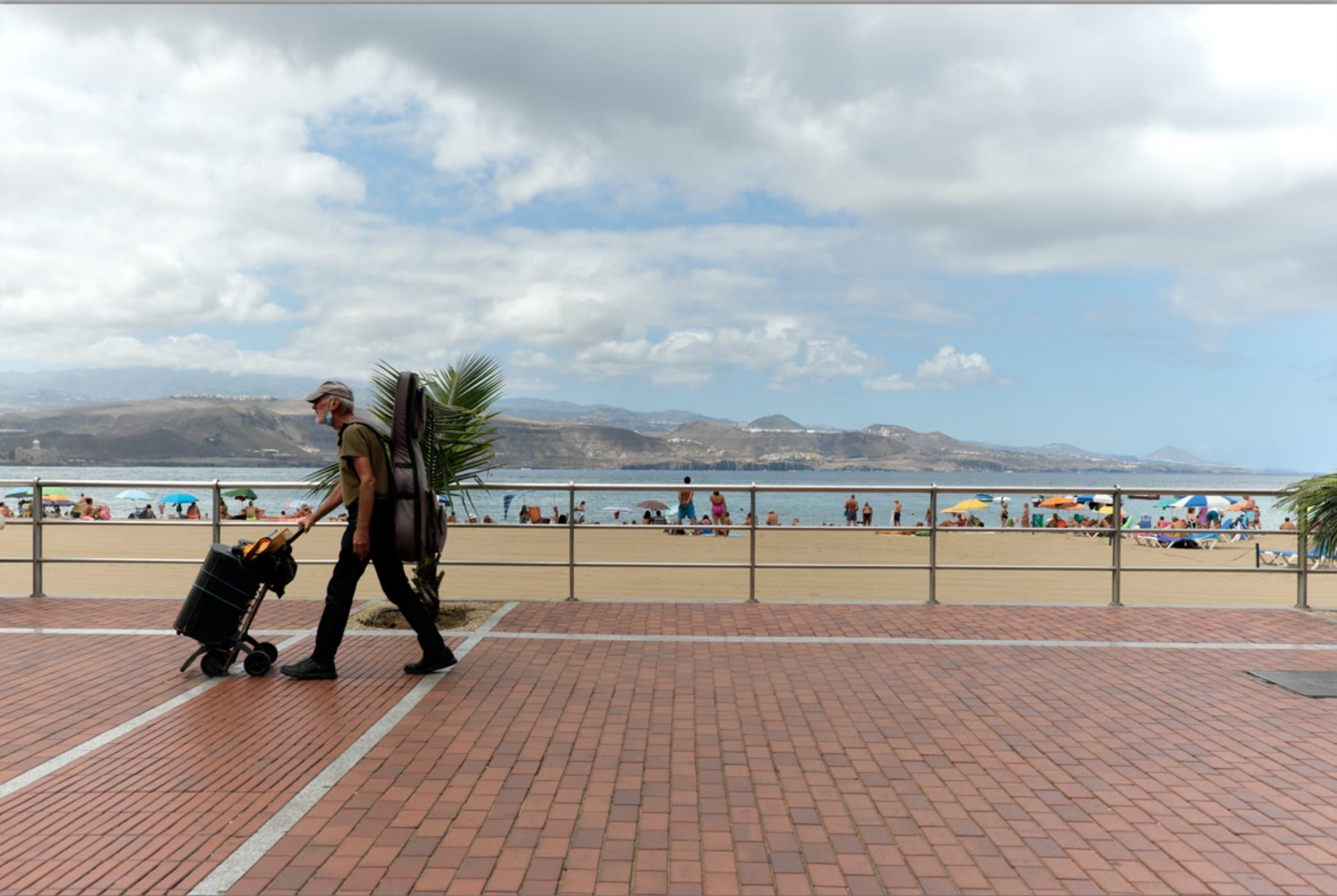
LAS PALMAS - Santa Catalina #Playa de Las Canteras (Strand & Promenade)