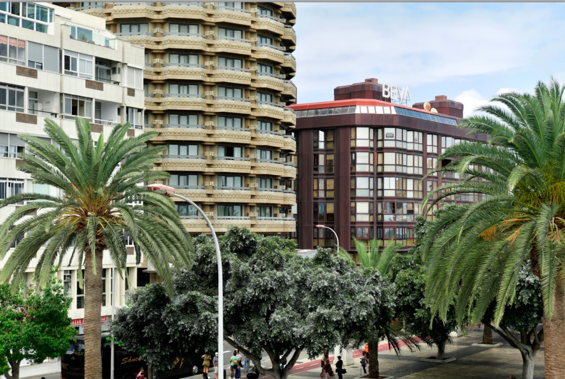
LAS PALMAS - Santa Catalina