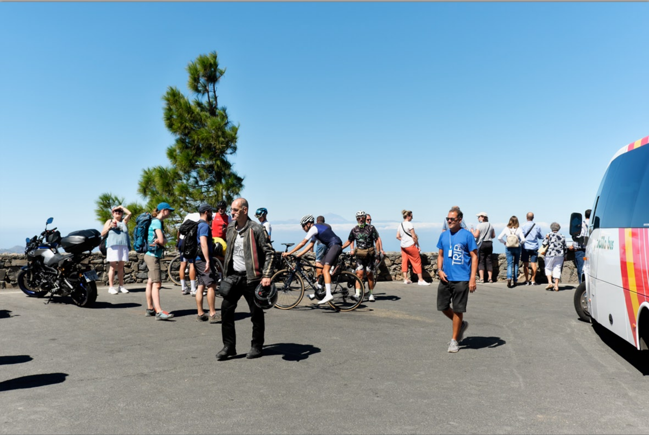
PICO DE LAS NIEVES (Vulkan-Berge)