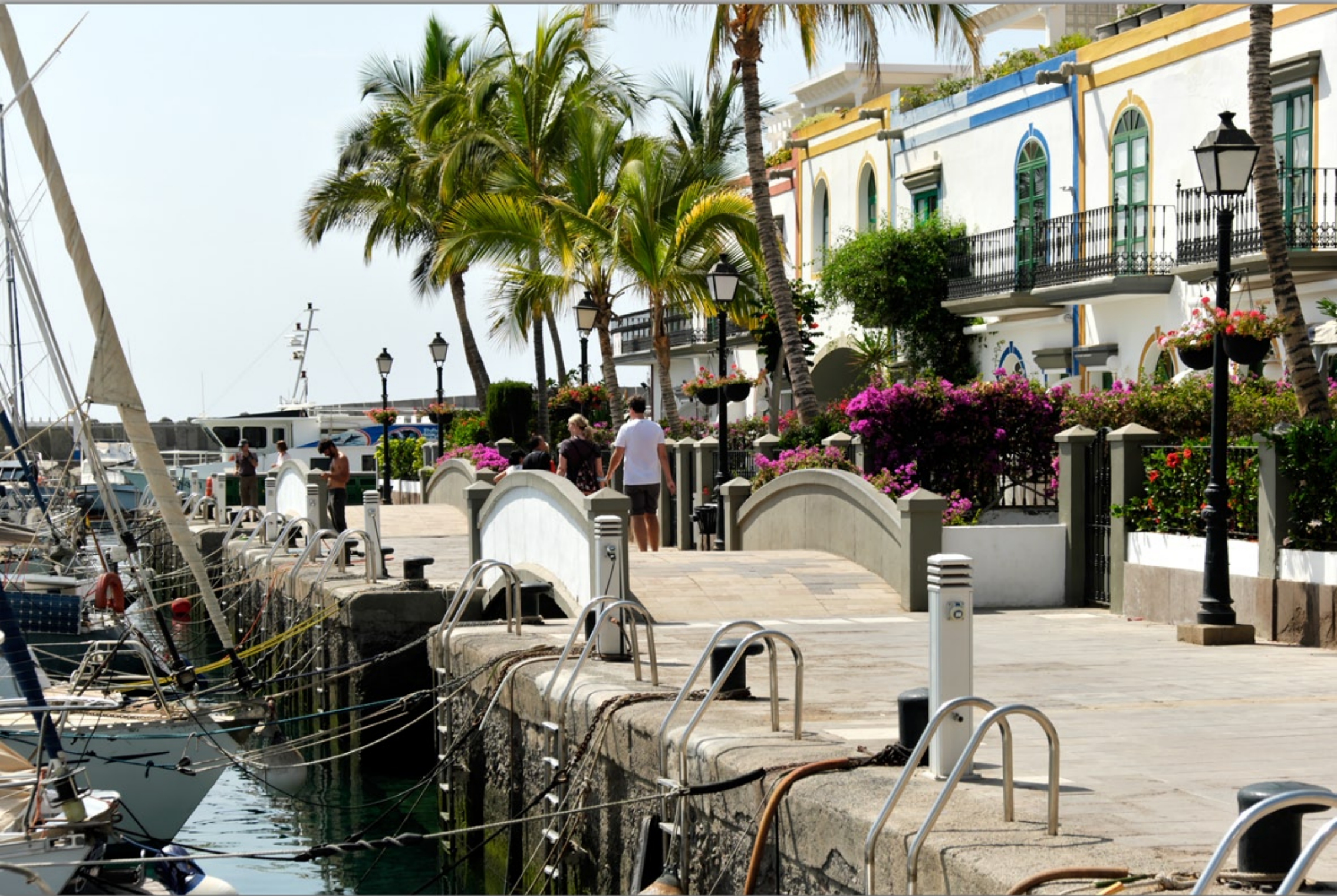
PUERTO DE MOGÁN