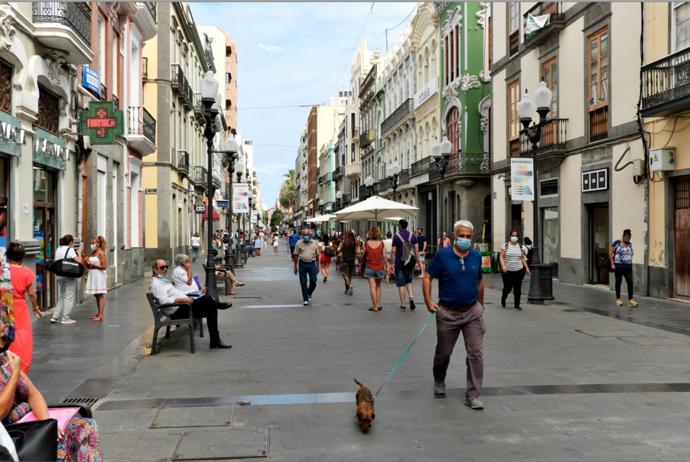
LAS PALMAS - Triana #Calle Triana (Einkaufstrasse)