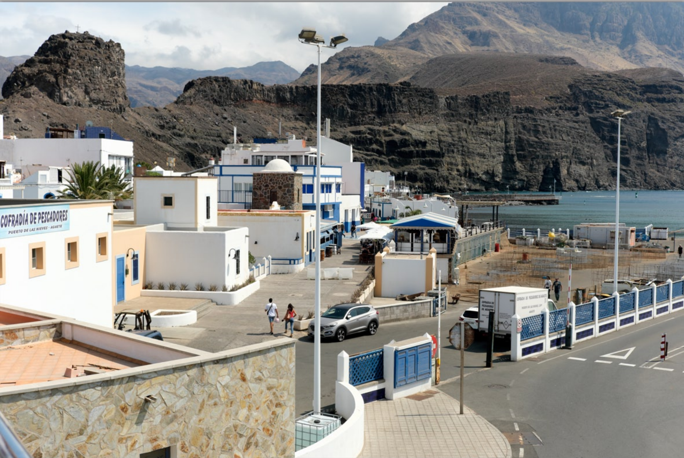
PUERTO DE LAS NIEVES