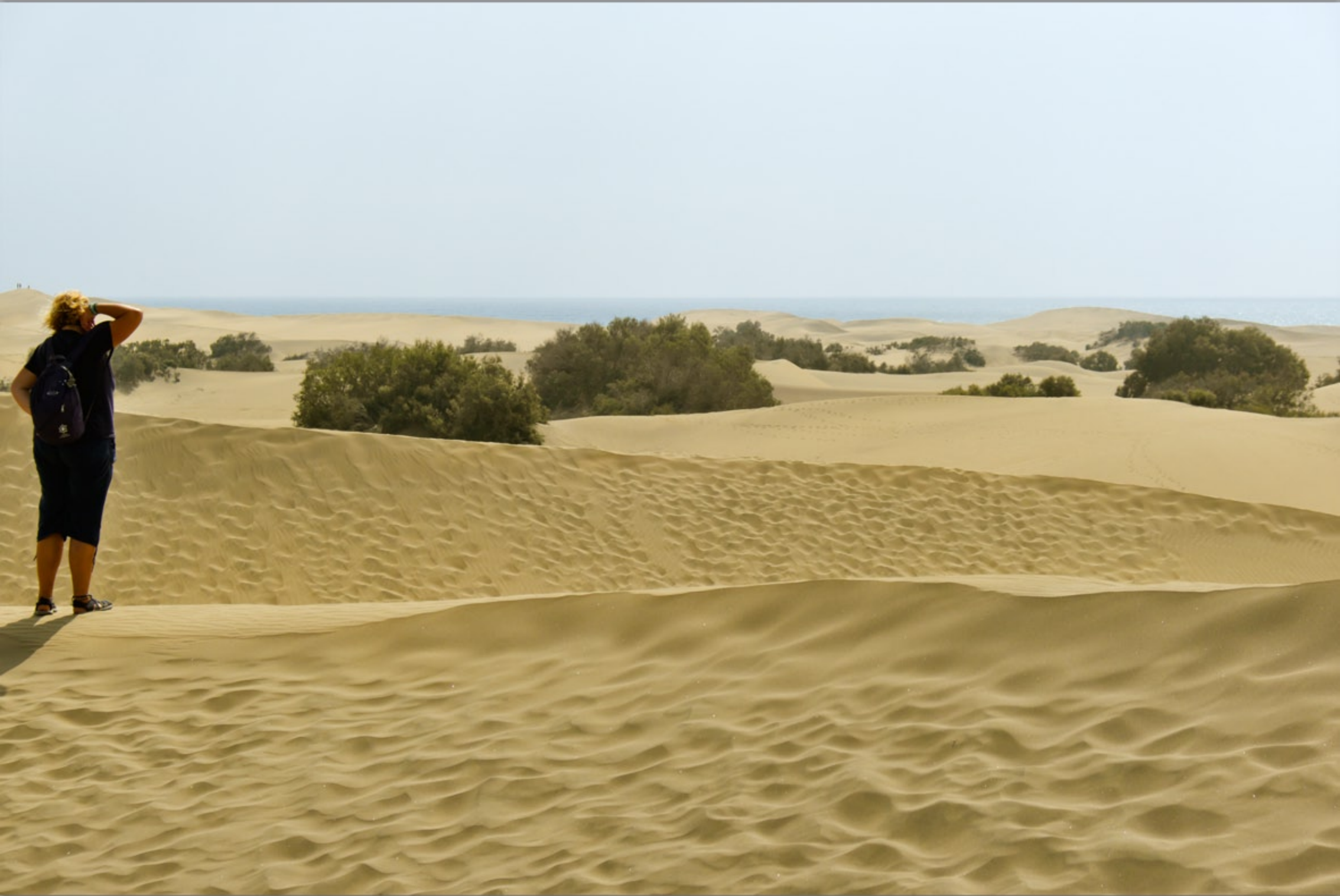
MASPALOMAS #Dunas de Maspalomas