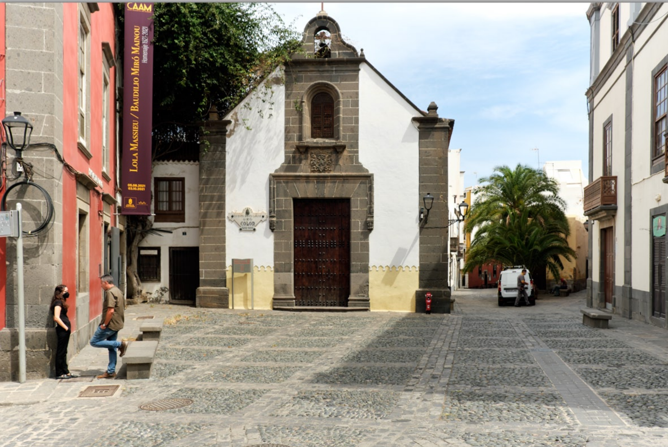
LAS PALMAS - Vegueta (Altstadt) #Ermita de San Antonio Abad (hier kniete Kolumbus nieder bevor er 1492 in die Neue Welt aufbrach)