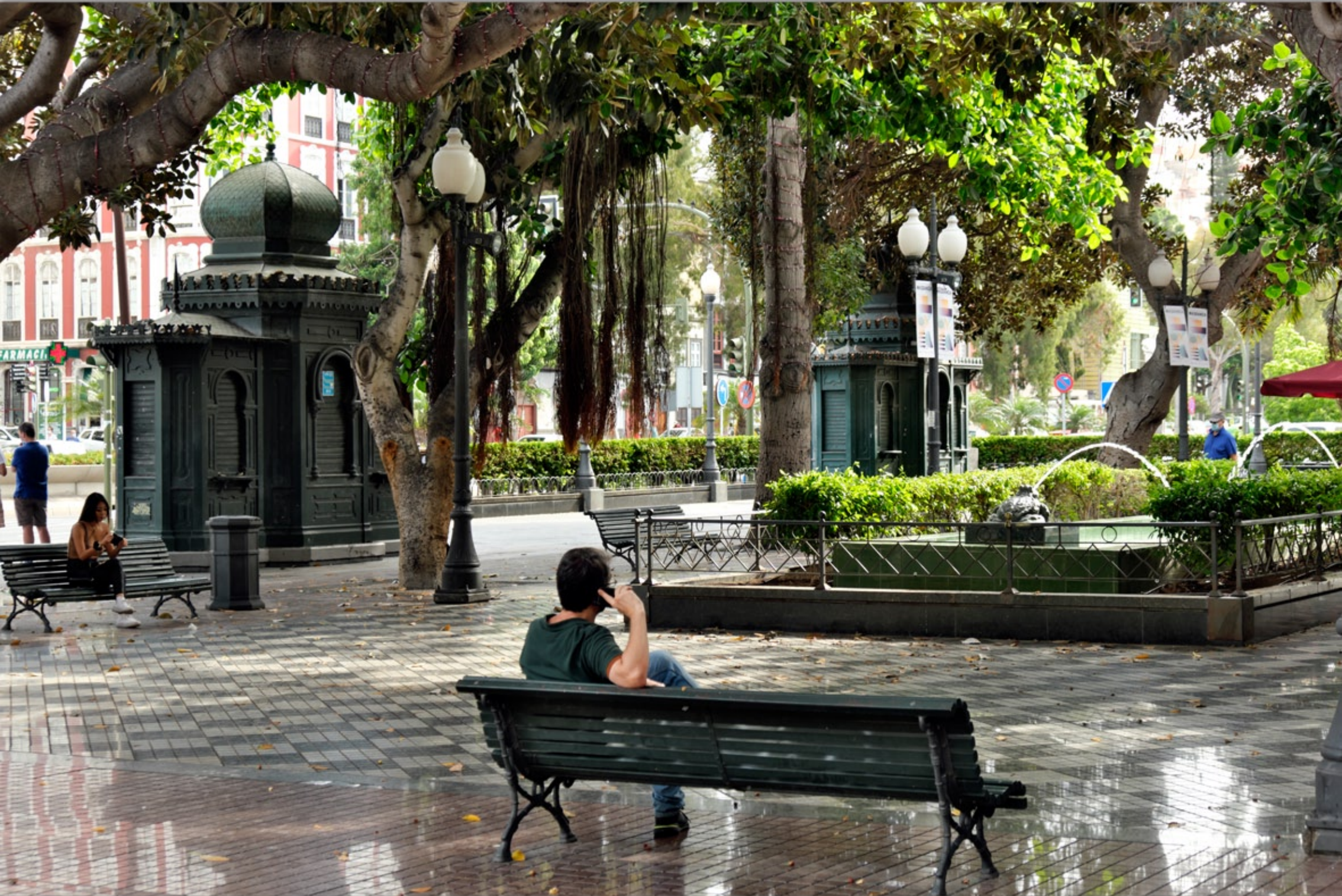
LAS PALMAS - Triana