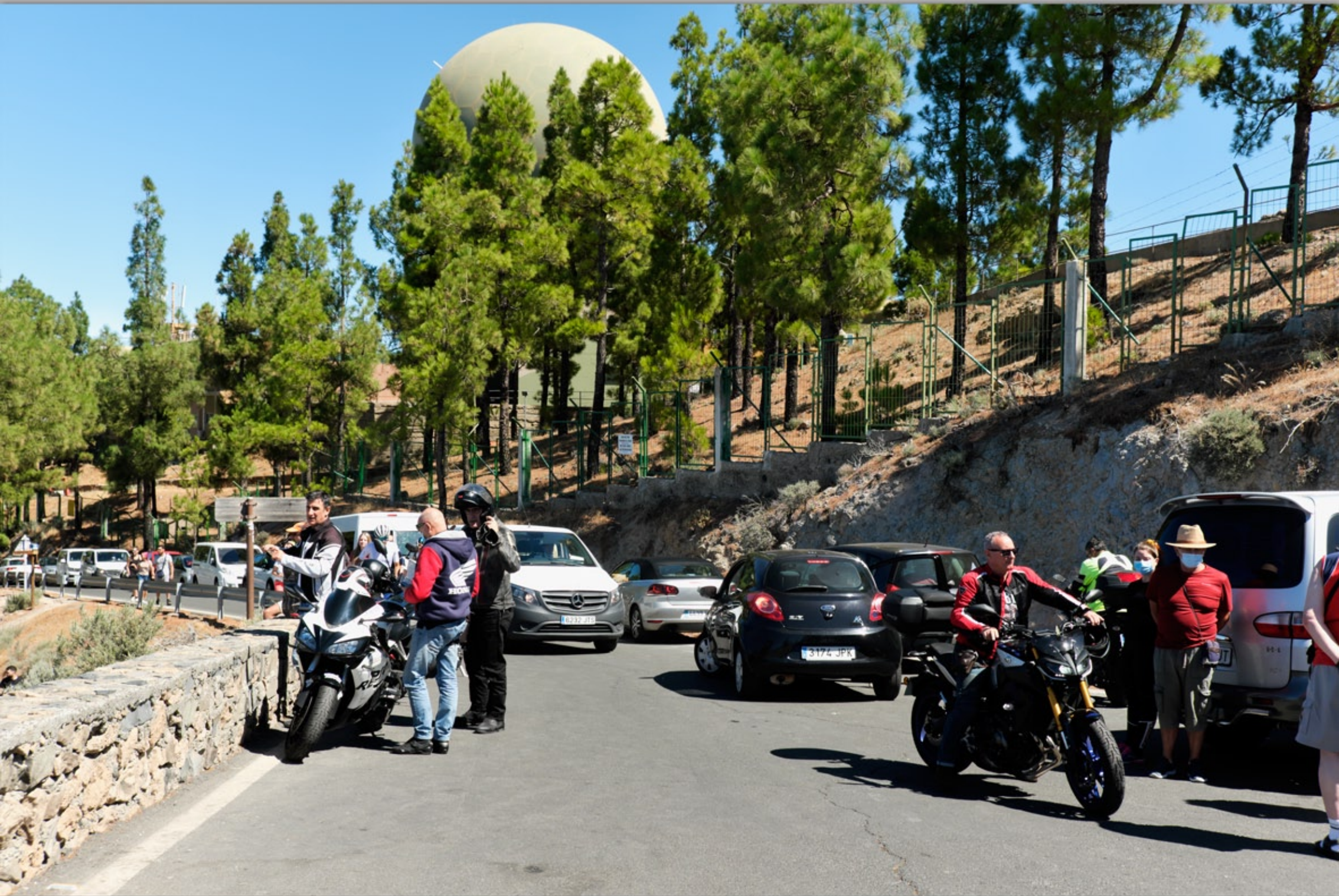
PICO DE LAS NIEVES (Vulkan-Berge)