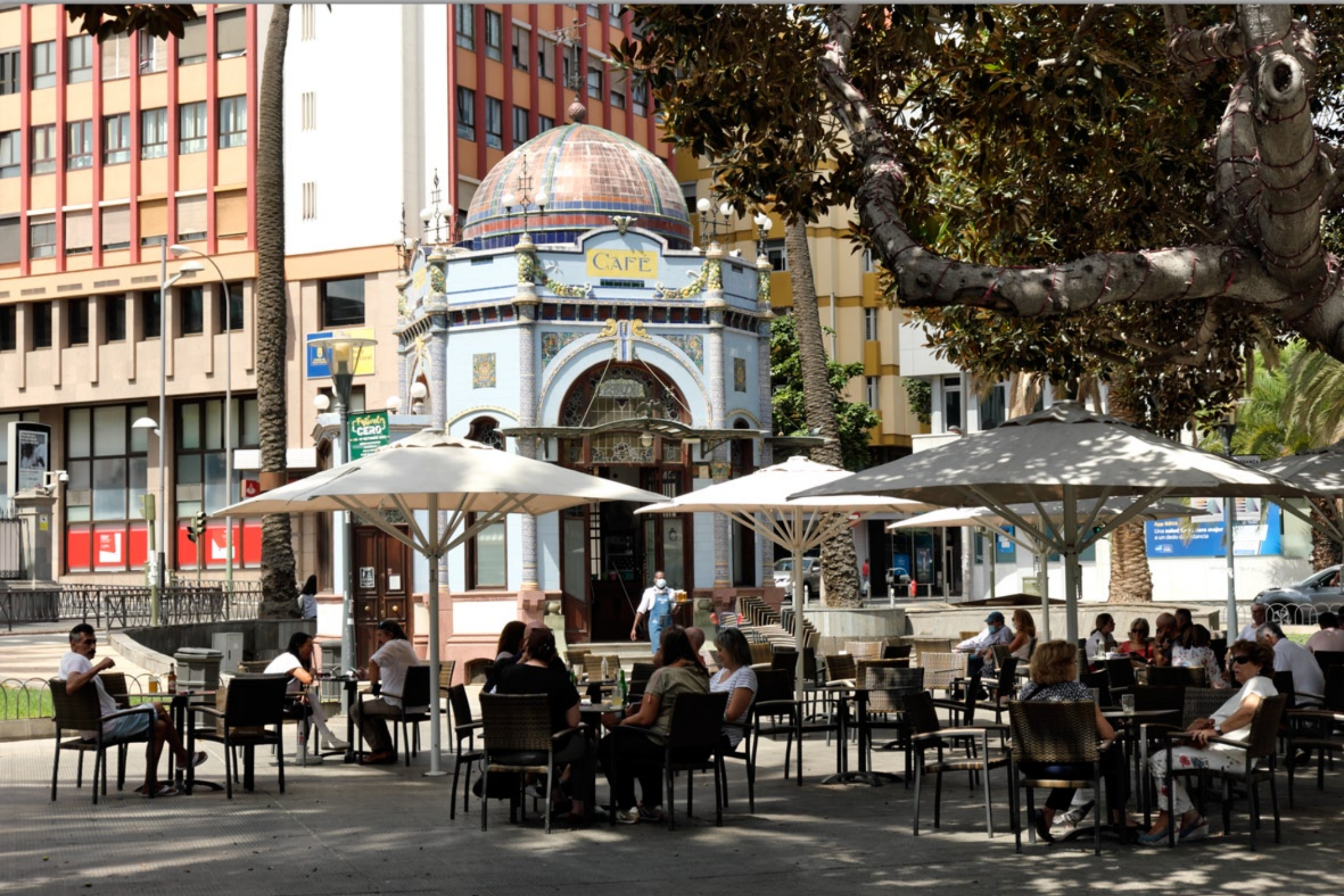
LAS PALMAS - San Telmo #Parque de San Telmo