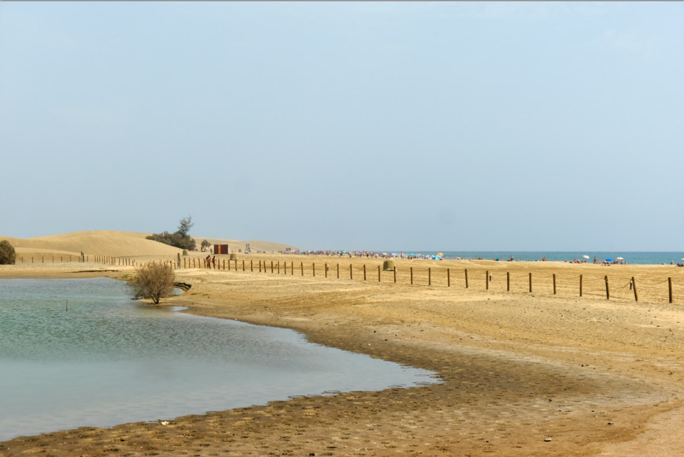
MASPALOMAS #Dunas de Maspalomas