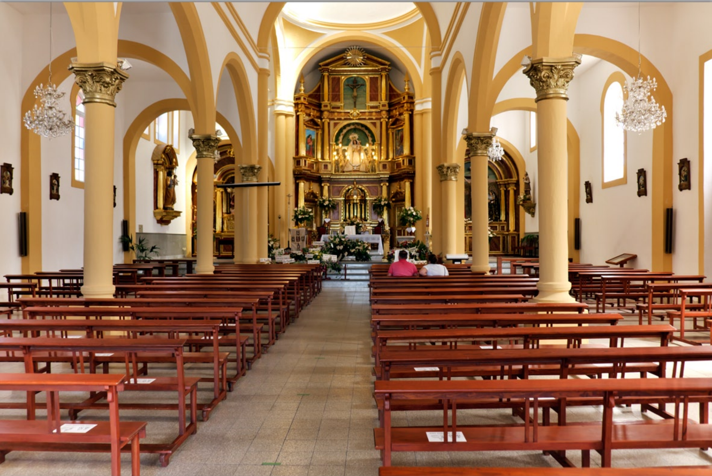
TEJEDA #Iglesia Nuestra Señora del Socorro