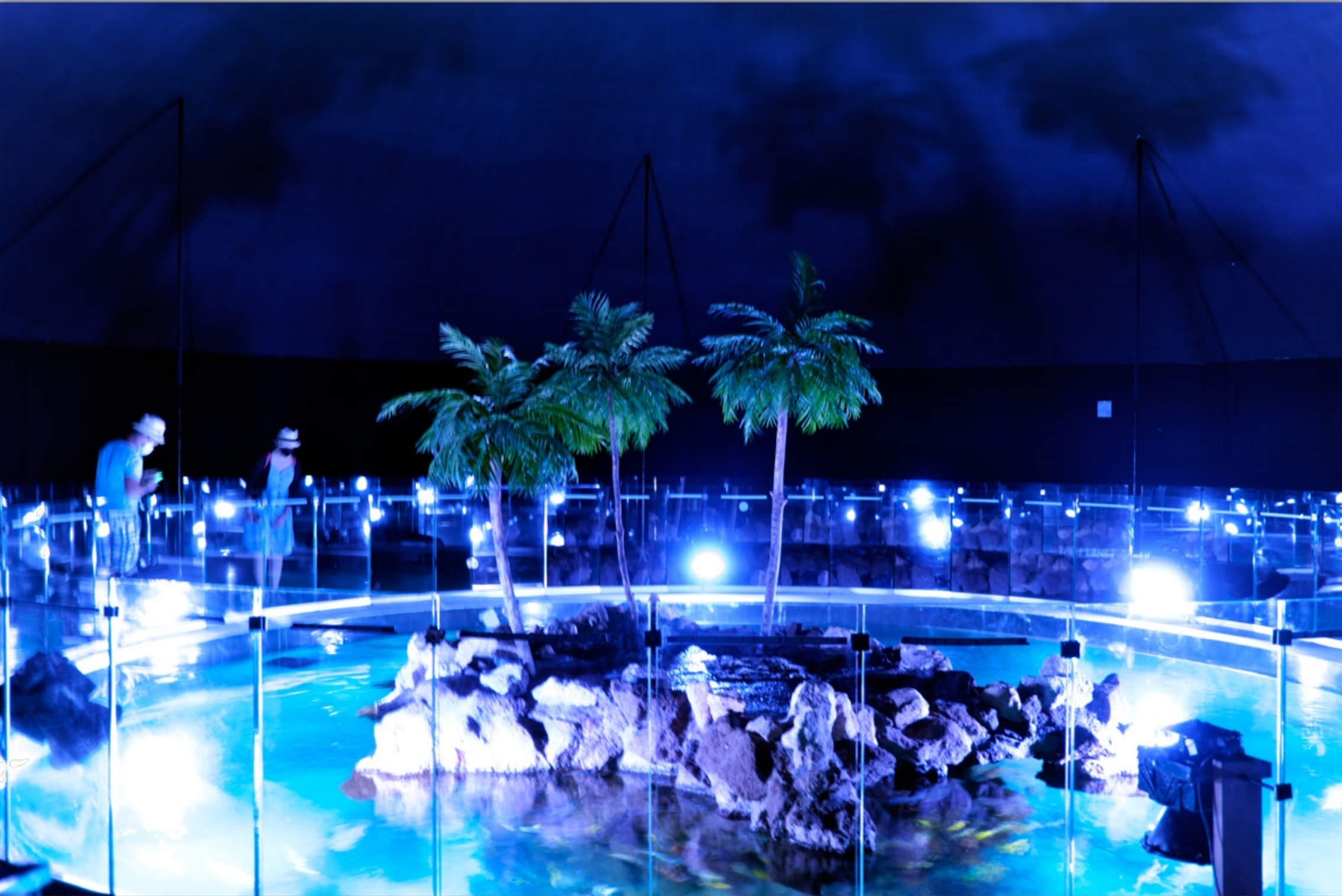
LAS PALMAS - Santa Catalina #Poema del Mar (Aquarium)