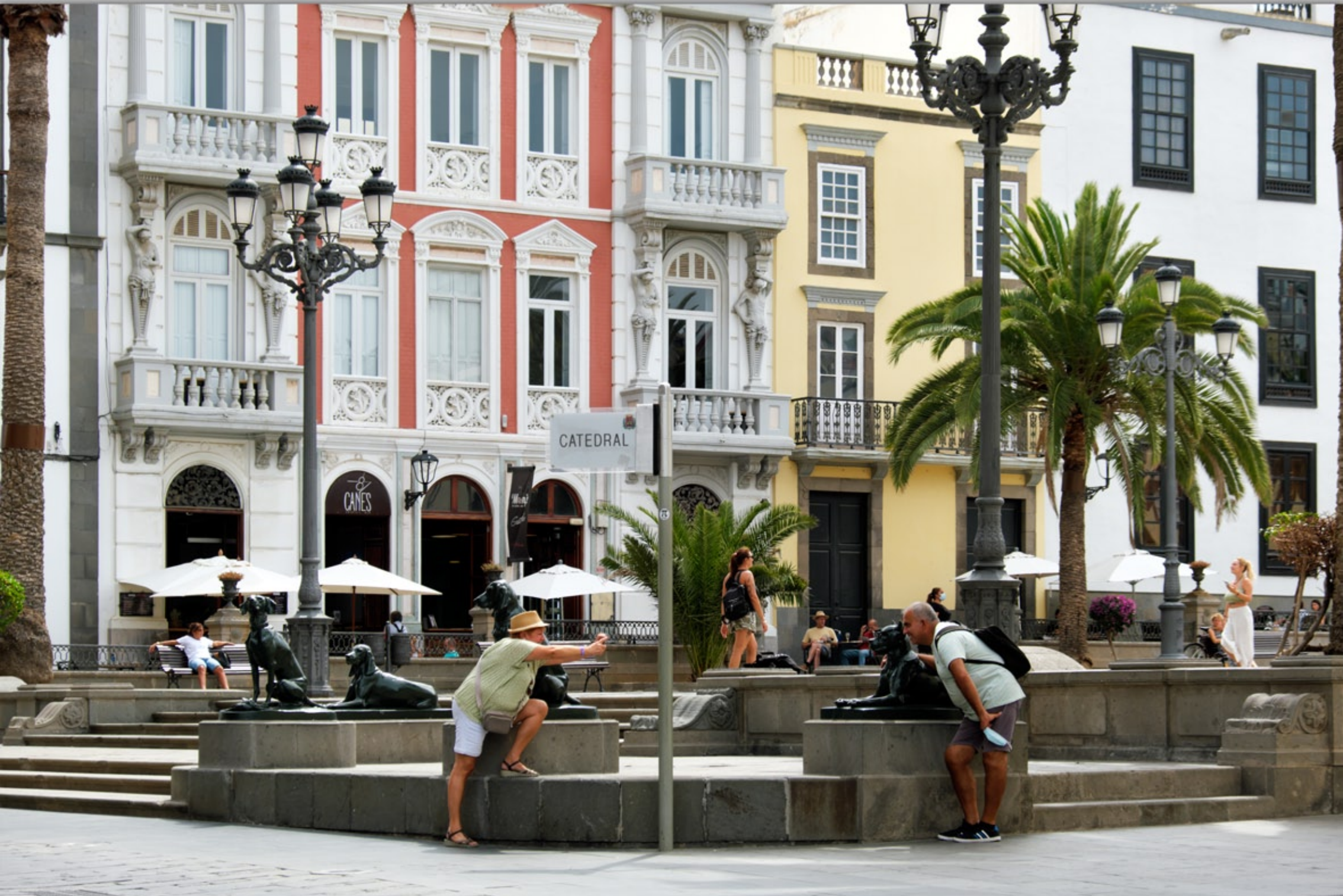
LAS PALMAS - Vegueta (Altstadt) #Plaza de Santa Ana