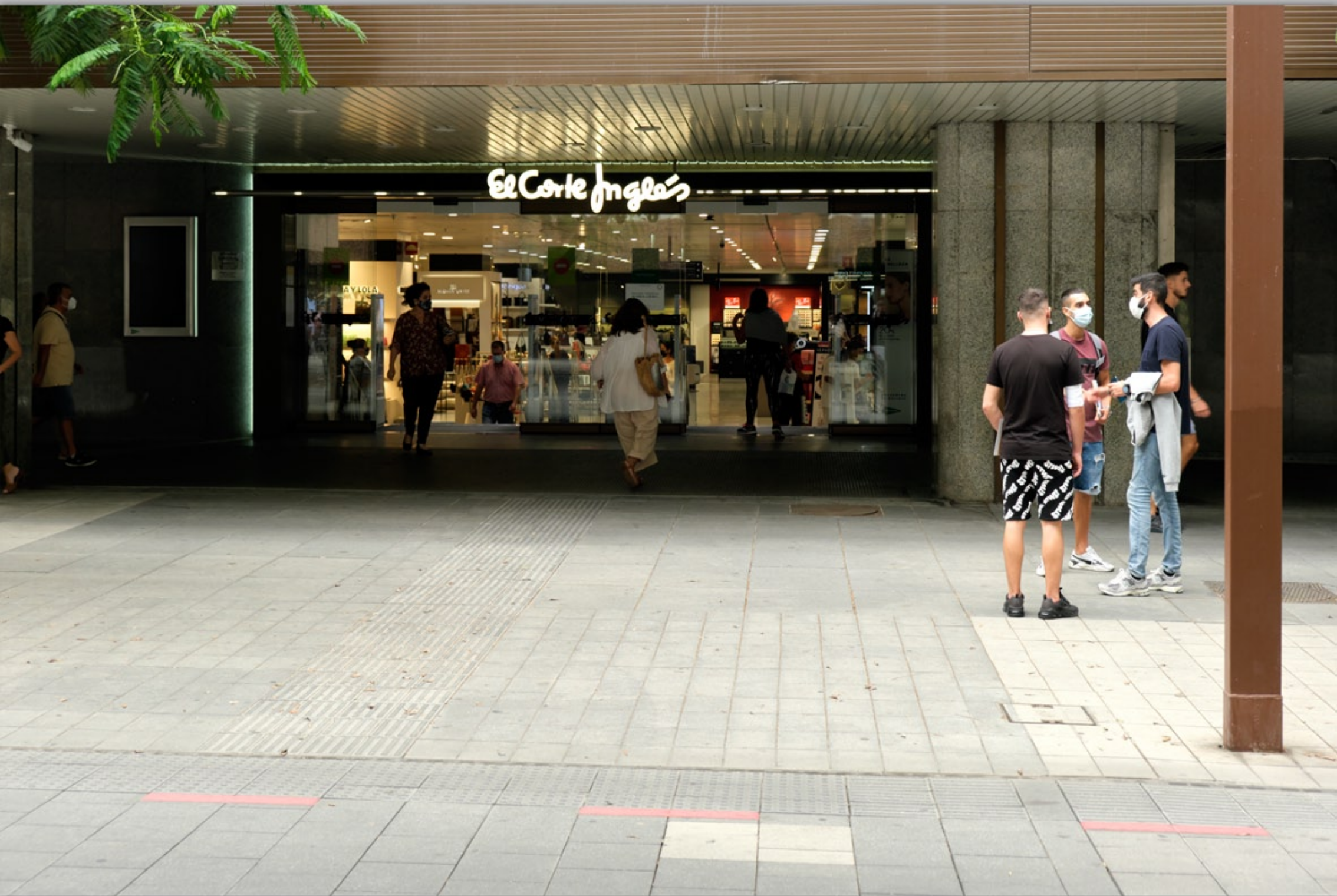
LAS PALMAS - Santa Catalina #Avenida José Mesa y López (Einkaufstraße)