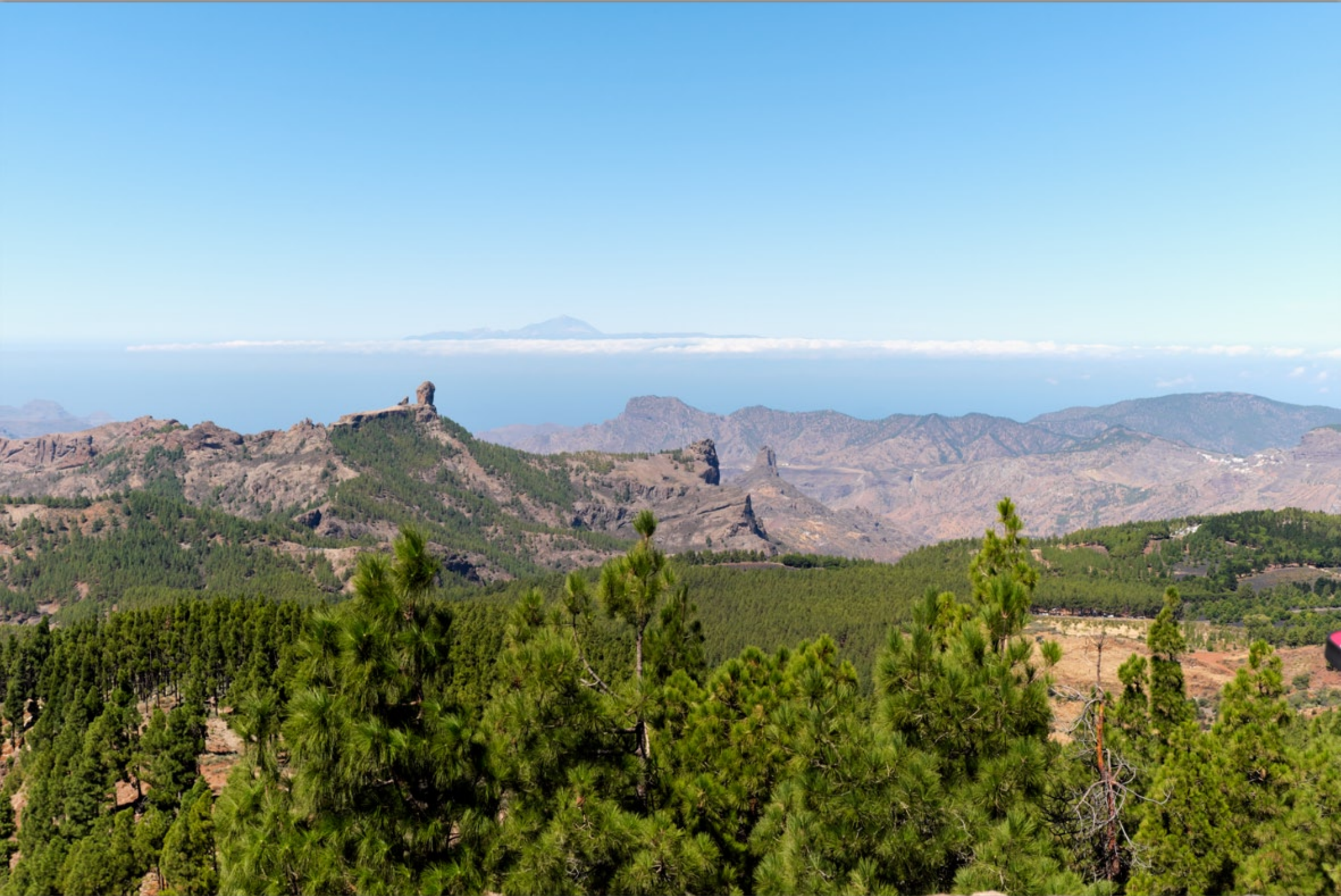
PICO DE LAS NIEVES (Vulkan-Berge #Roque Nublo #TENERIFE)