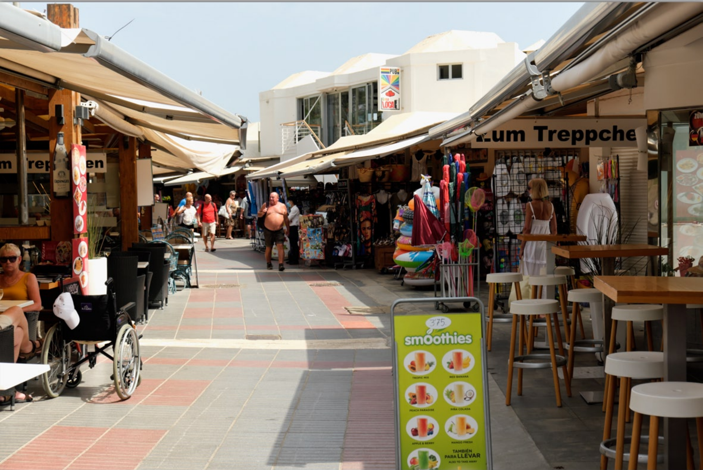
MASPALOMAS #El Oasis de Maspalomas