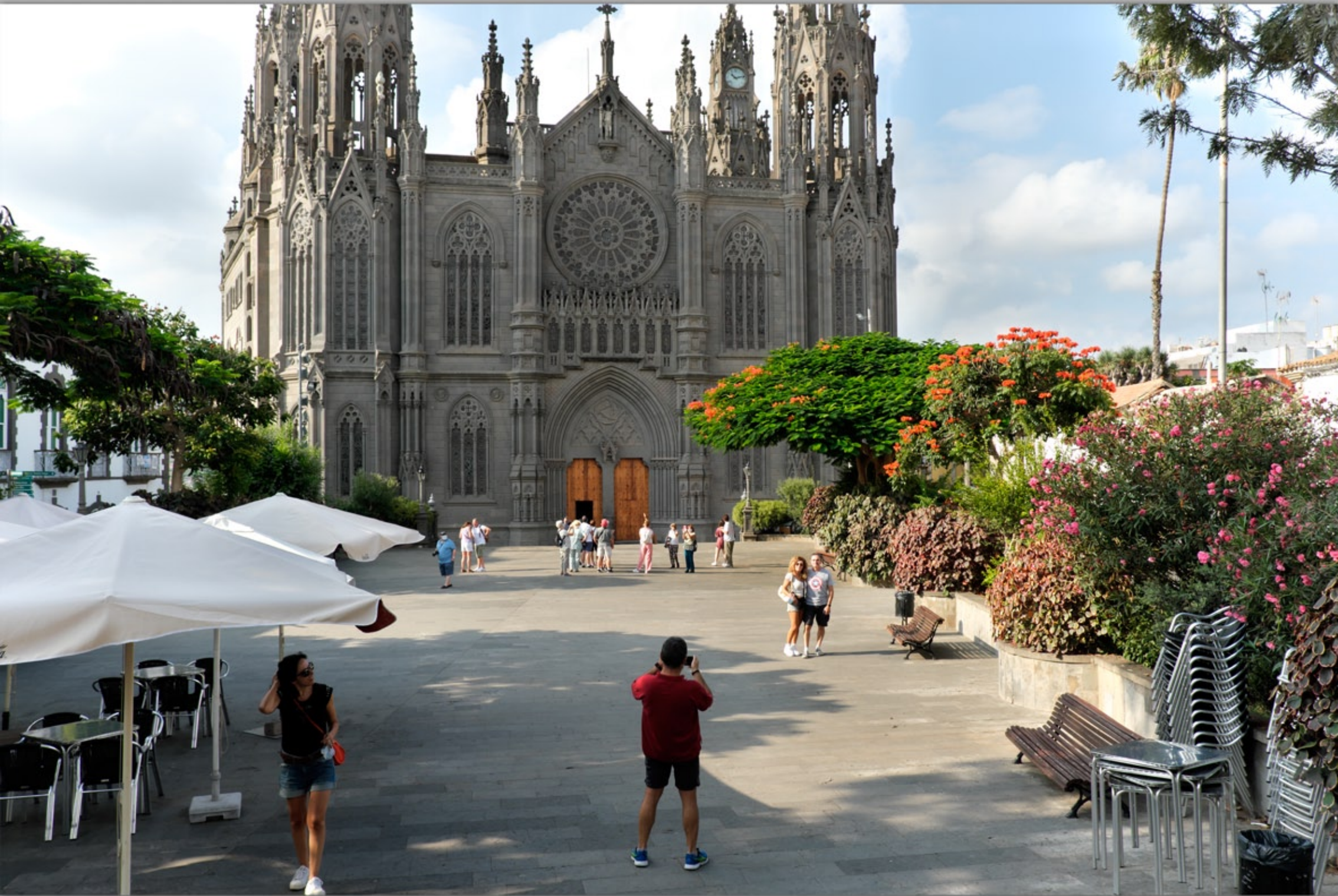
ARUCAS #Iglesia De San Juan Bautista