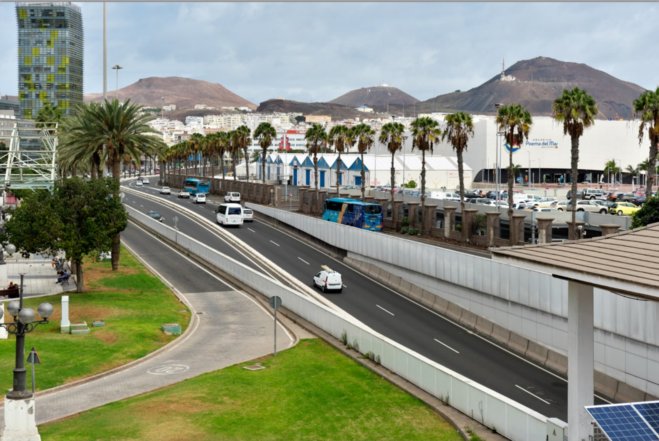
LAS PALMAS - Santa Catalina #Poema del Mar (Aquarium)