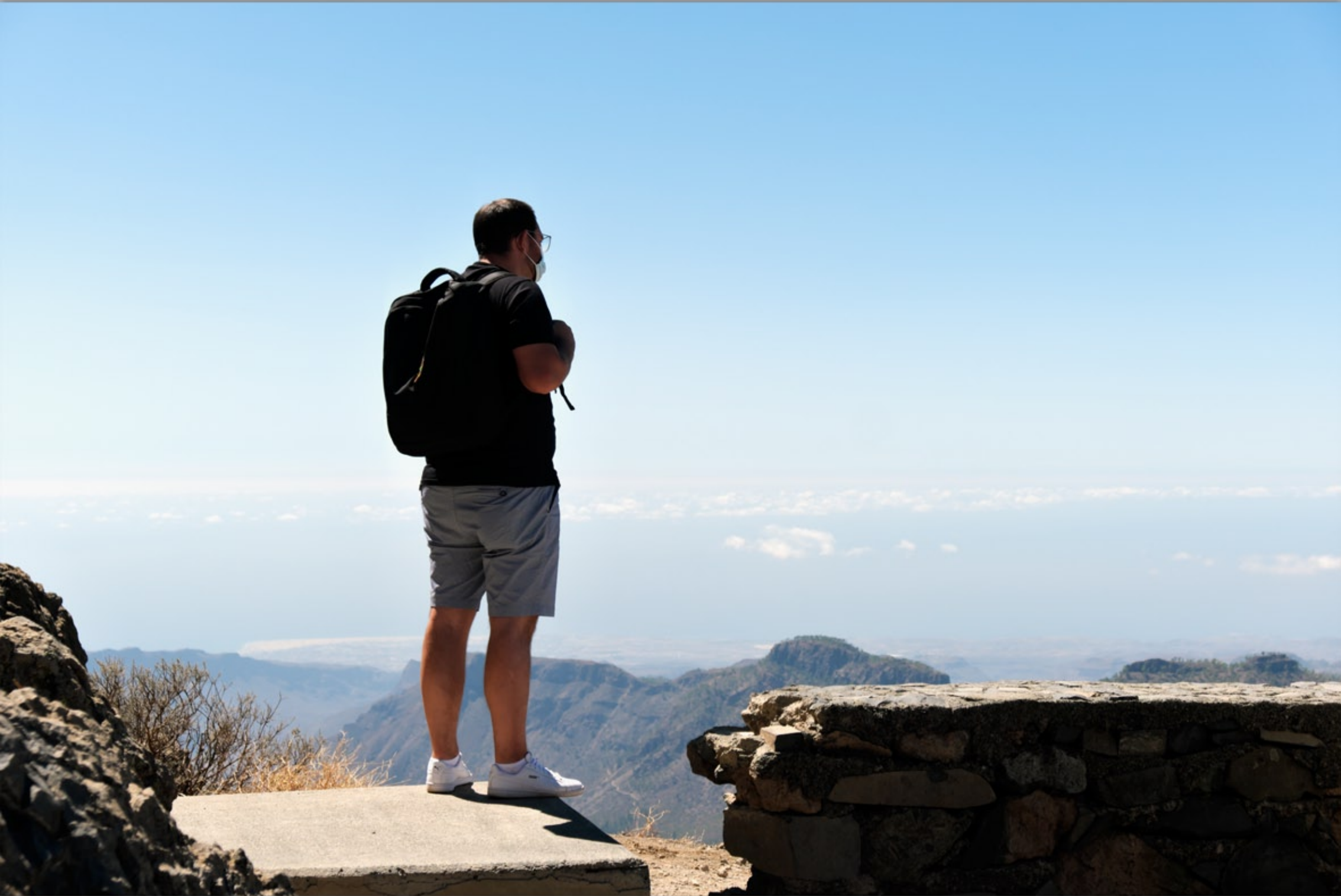
PICO DE LAS NIEVES (Vulkan-Berge)