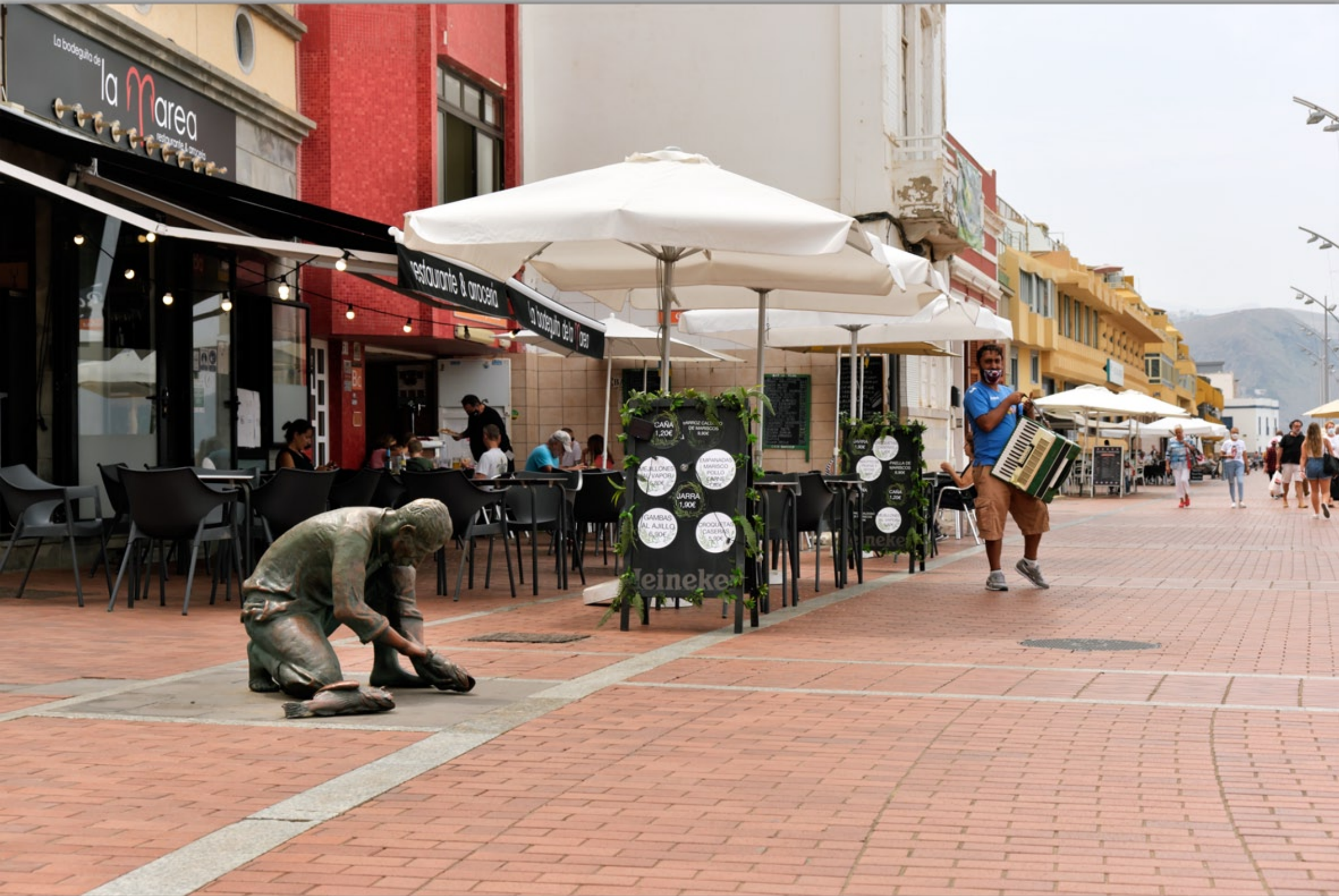
LAS PALMAS - Santa Catalina #Playa de Las Canteras (Strand & Promenade)