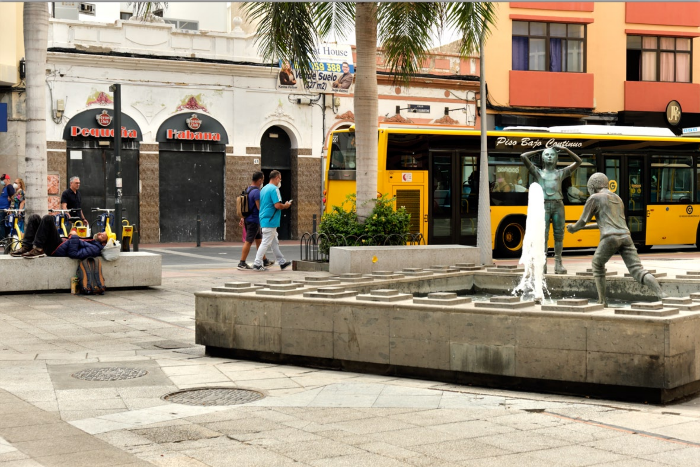
LAS PALMAS - Santa Catalina