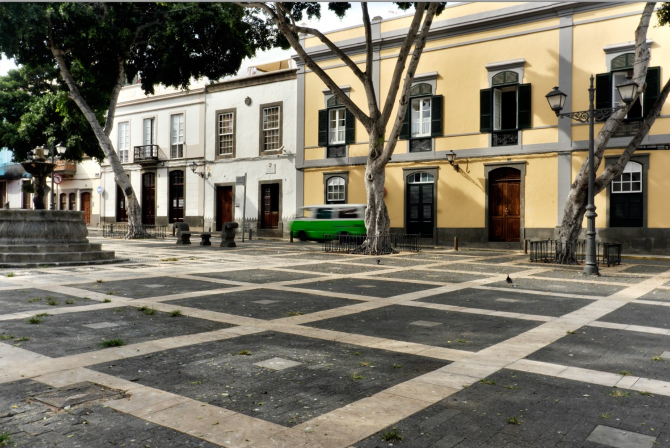
LAS PALMAS - Vegueta (Altstadt)