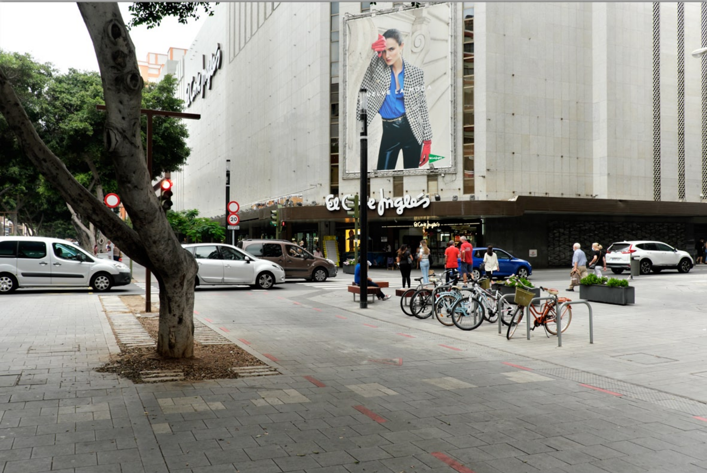
LAS PALMAS - Santa Catalina #Avenida José Mesa y López (Einkaufstraße)