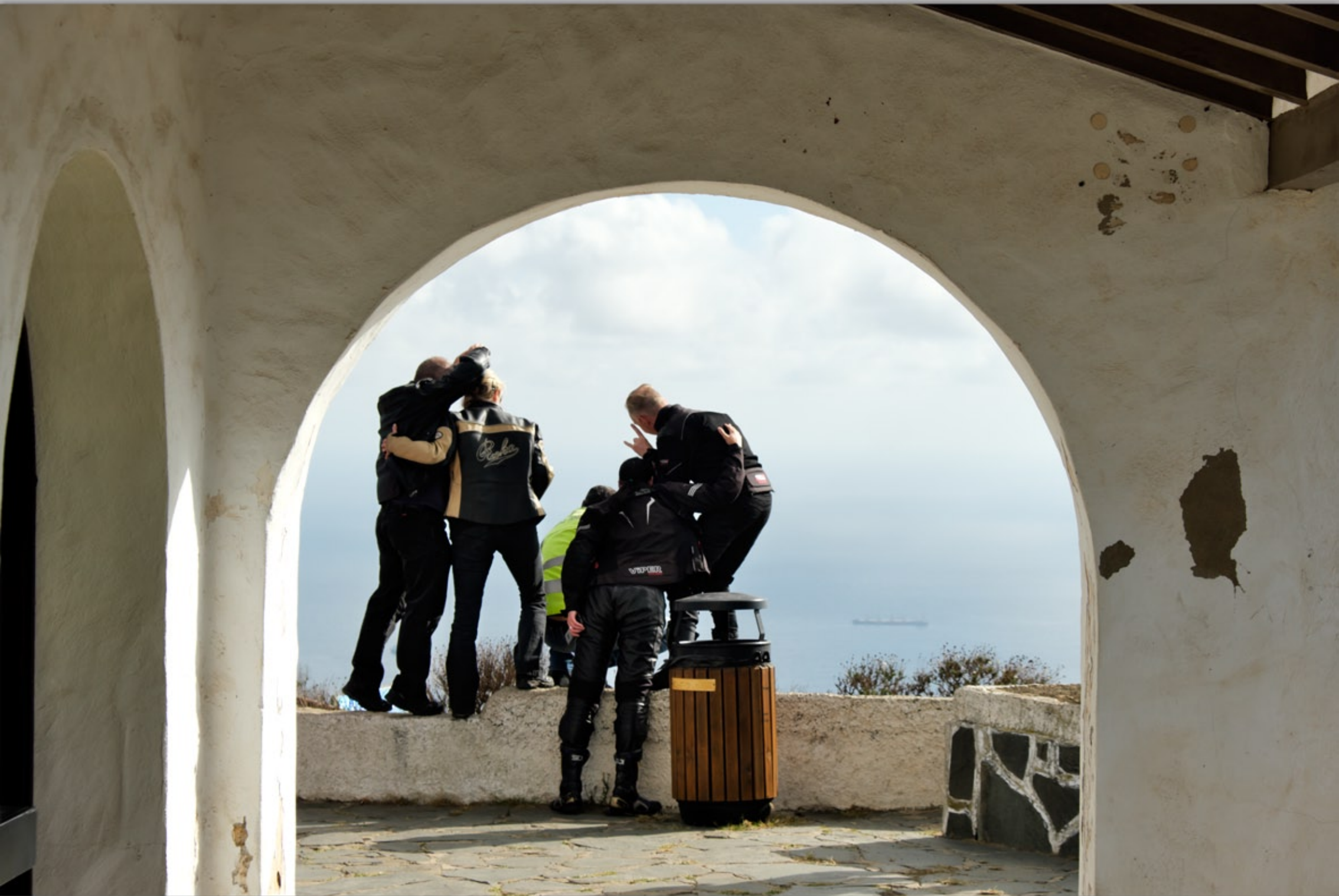
CALDERA BANDAMA (Vulkan-Berge)