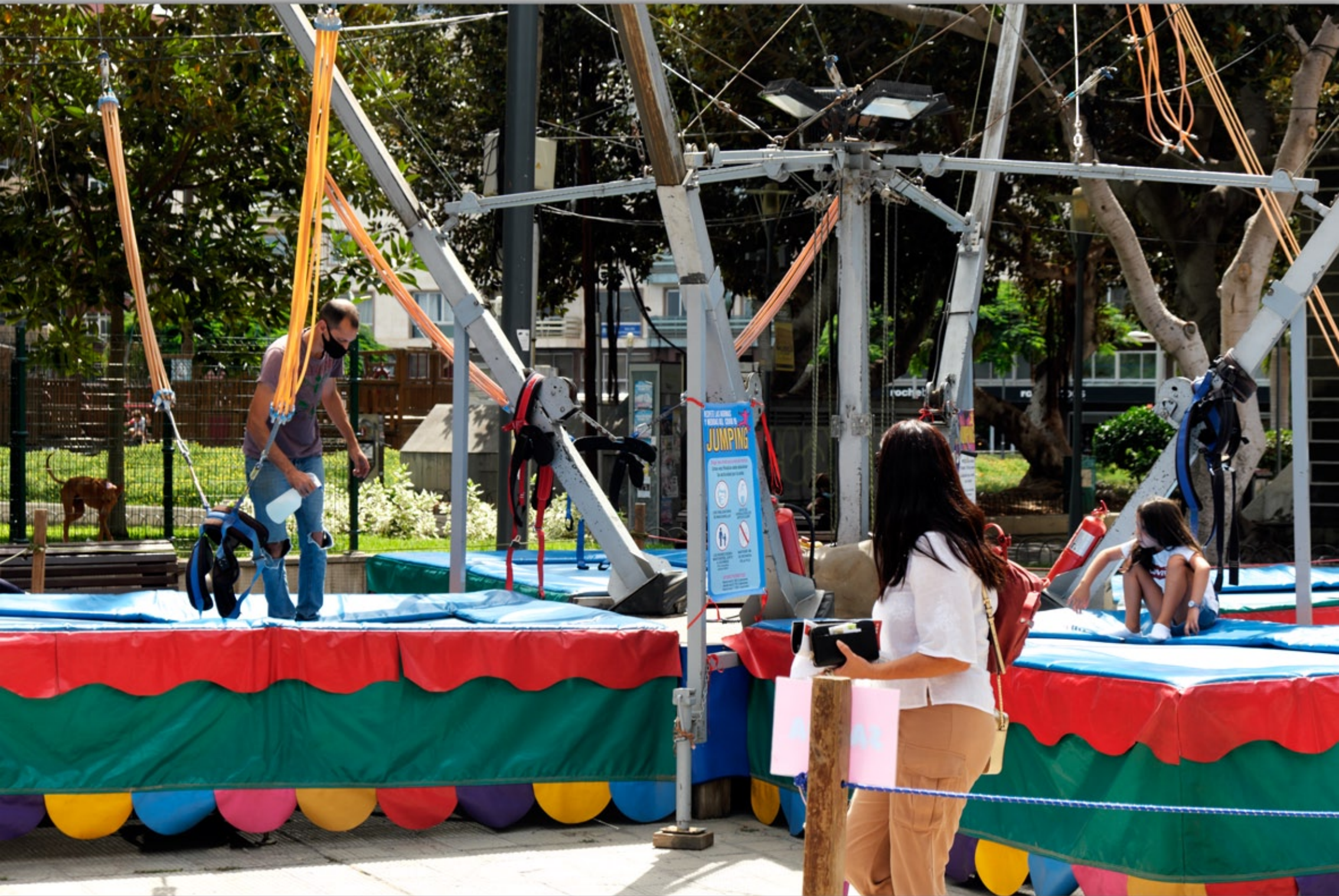
LAS PALMAS - San Telmo #Parque de San Telmo