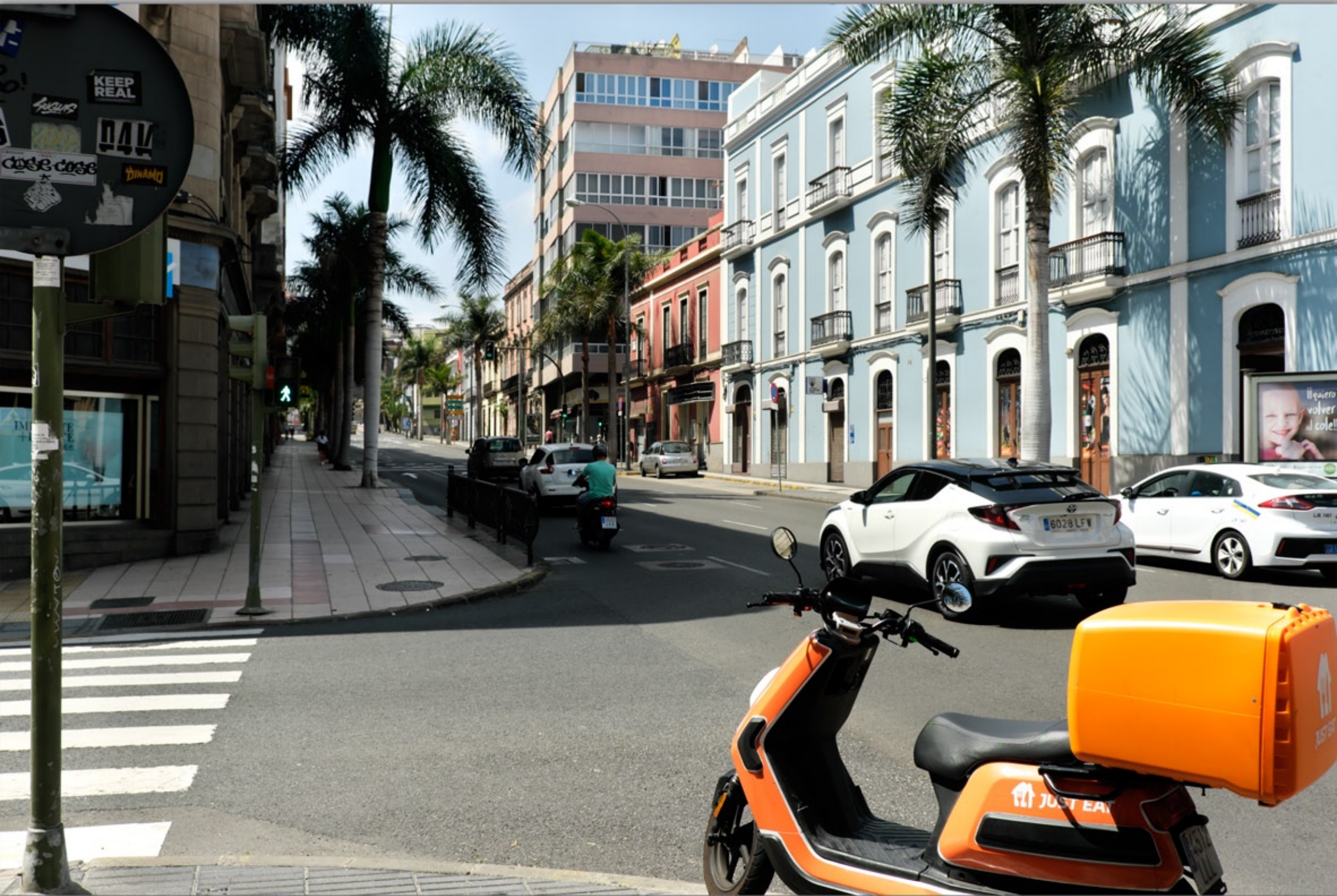
LAS PALMAS - San Telmo