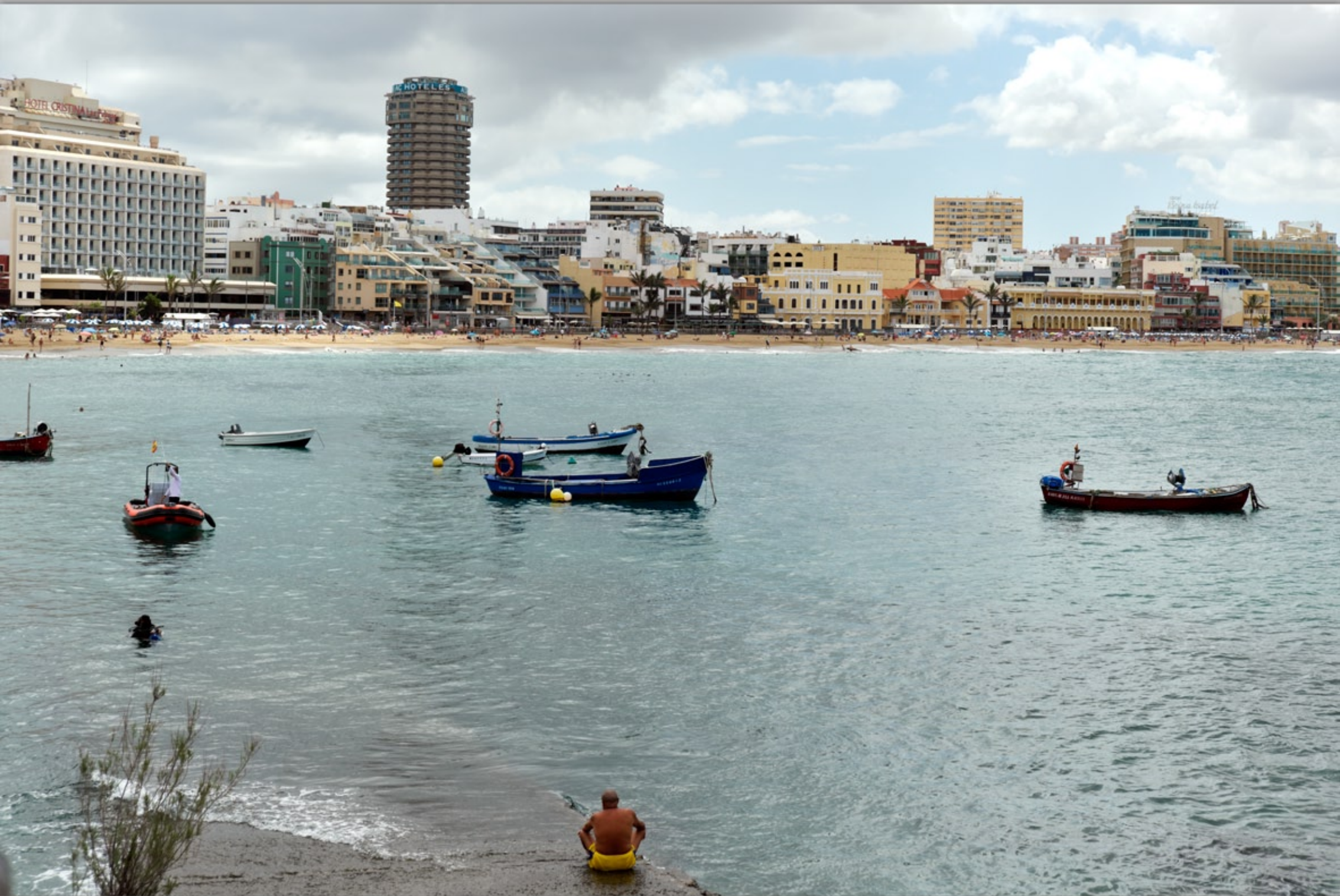
LAS PALMAS - Santa Catalina #Playa de Las Canteras (Strand & Promenade)