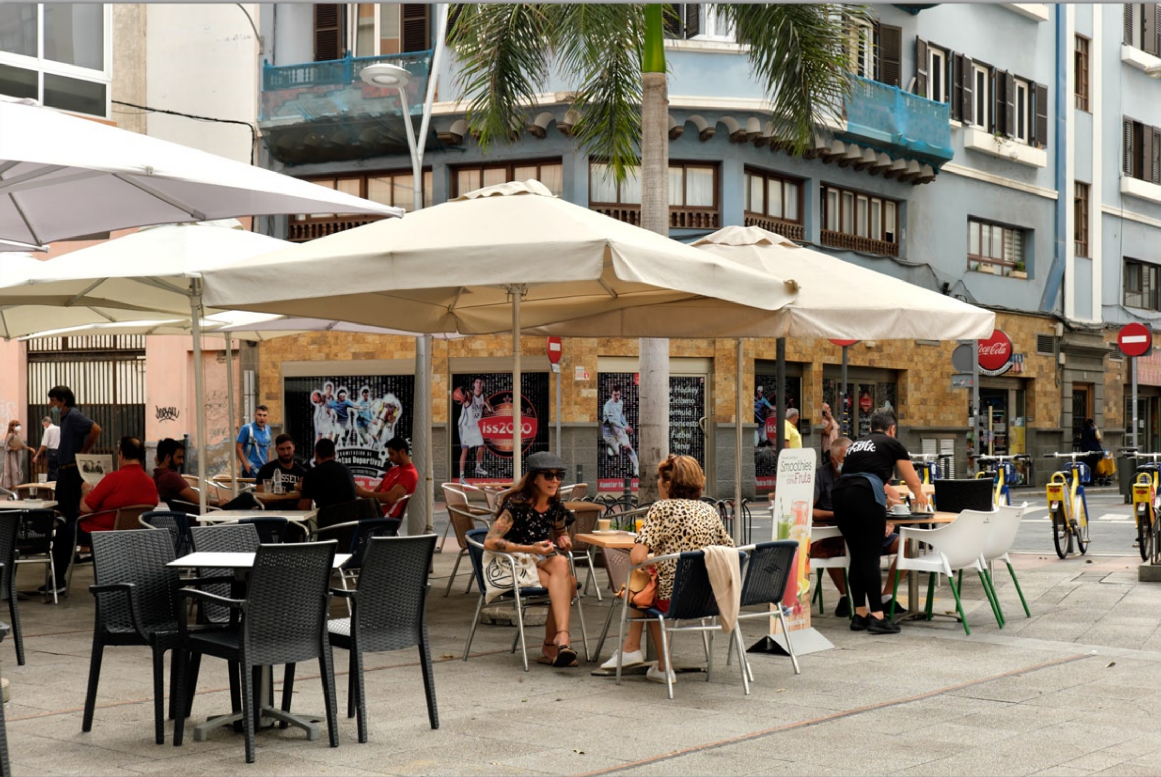
LAS PALMAS - Santa Catalina