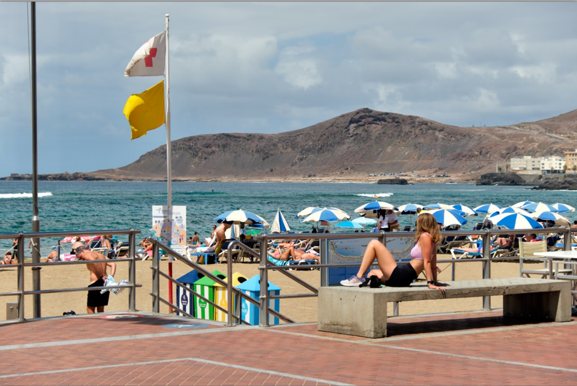
LAS PALMAS #Playa de Las Canteras (Strand & Promenade)