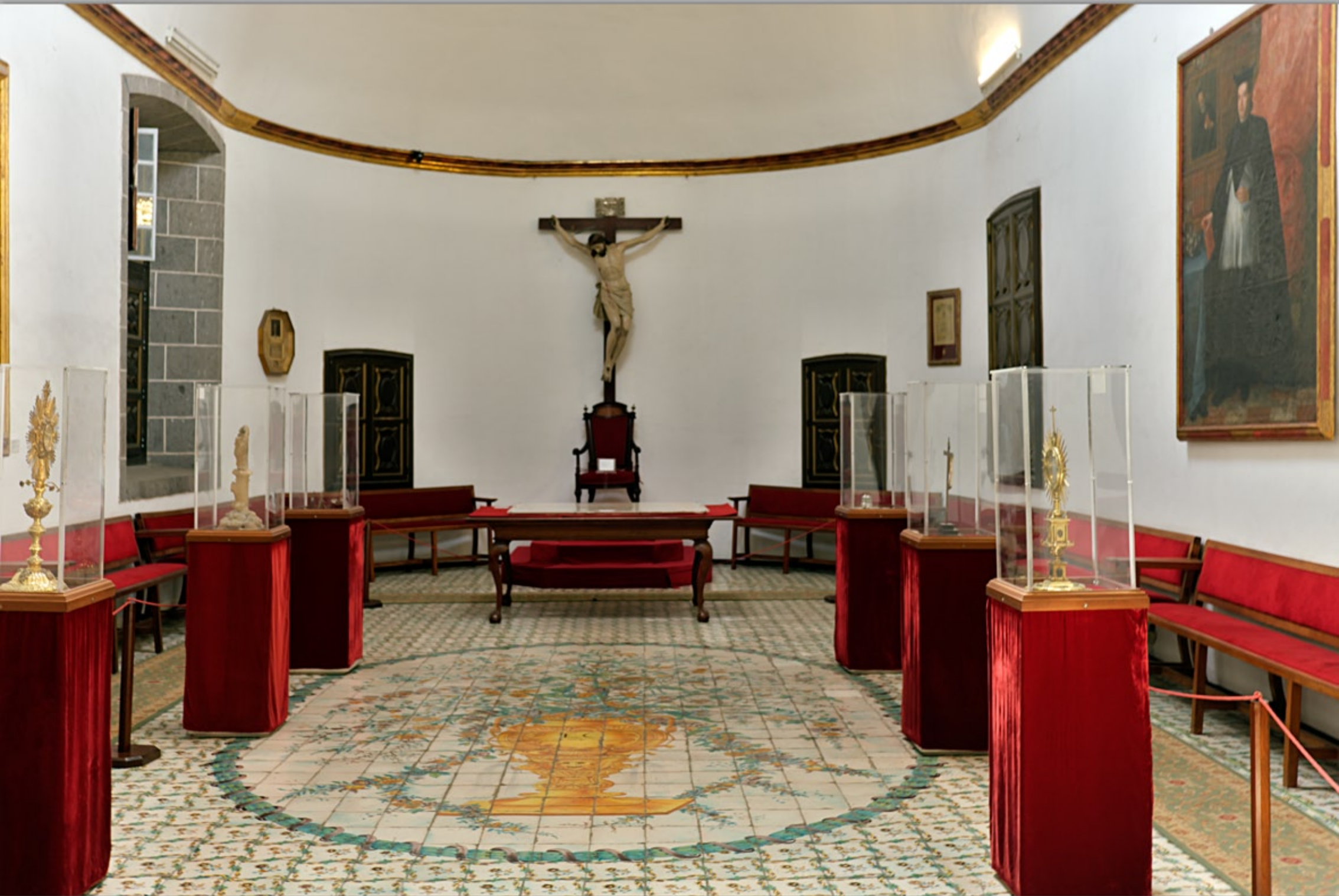
LAS PALMAS - Vegueta (Altstadt) #Museo Diocesano de Arte Sacro (Catedral de Santa Ana)