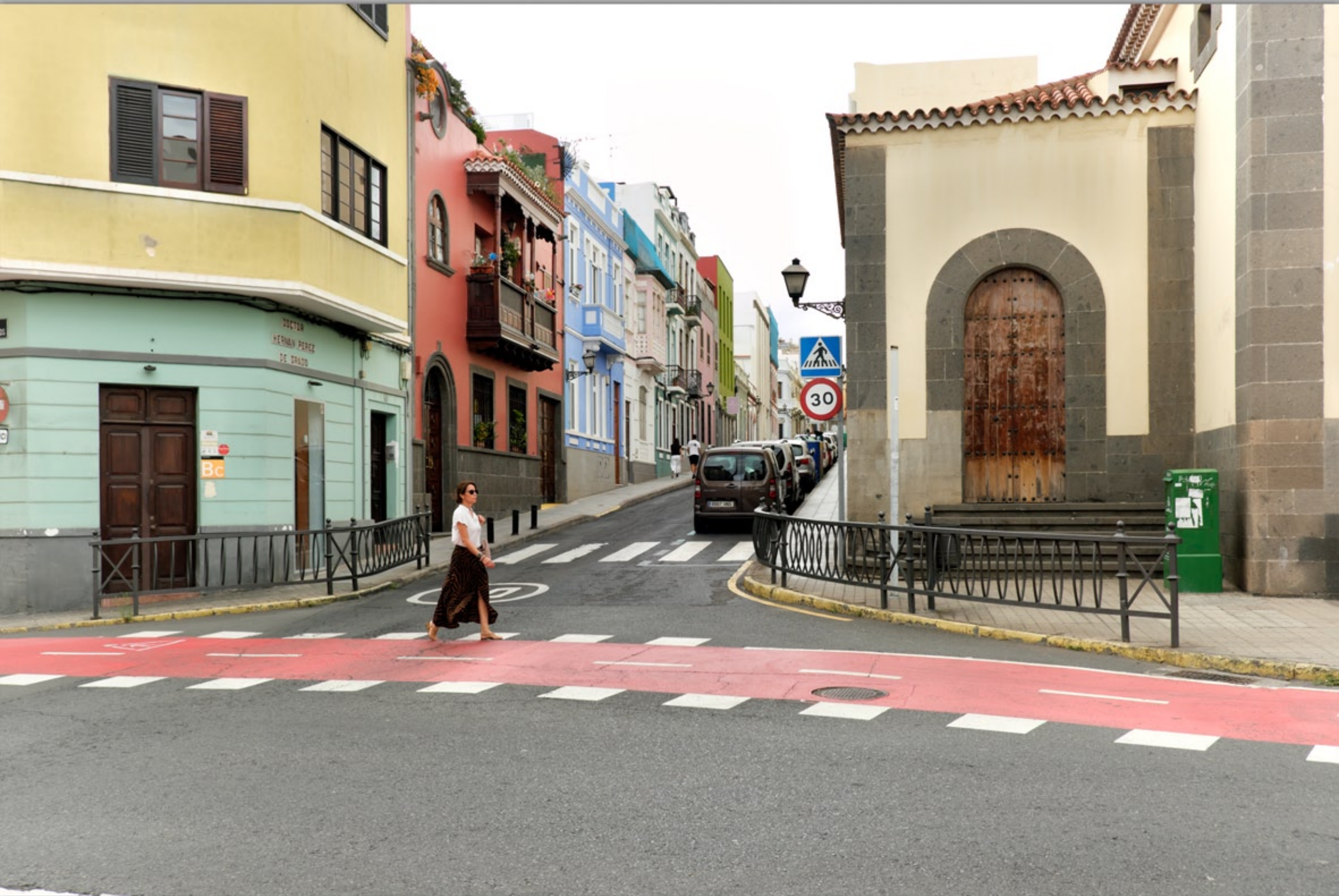
LAS PALMAS - Vegueta (Altstadt)