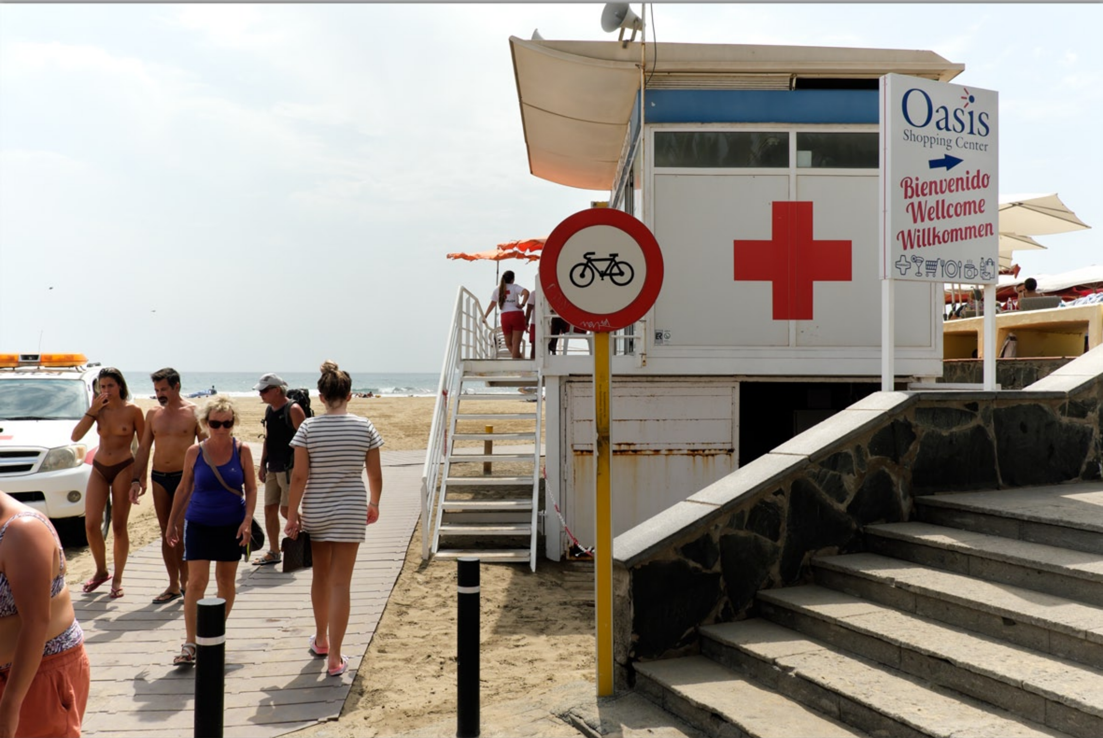
MASPALOMAS #El Oasis de Maspalomas