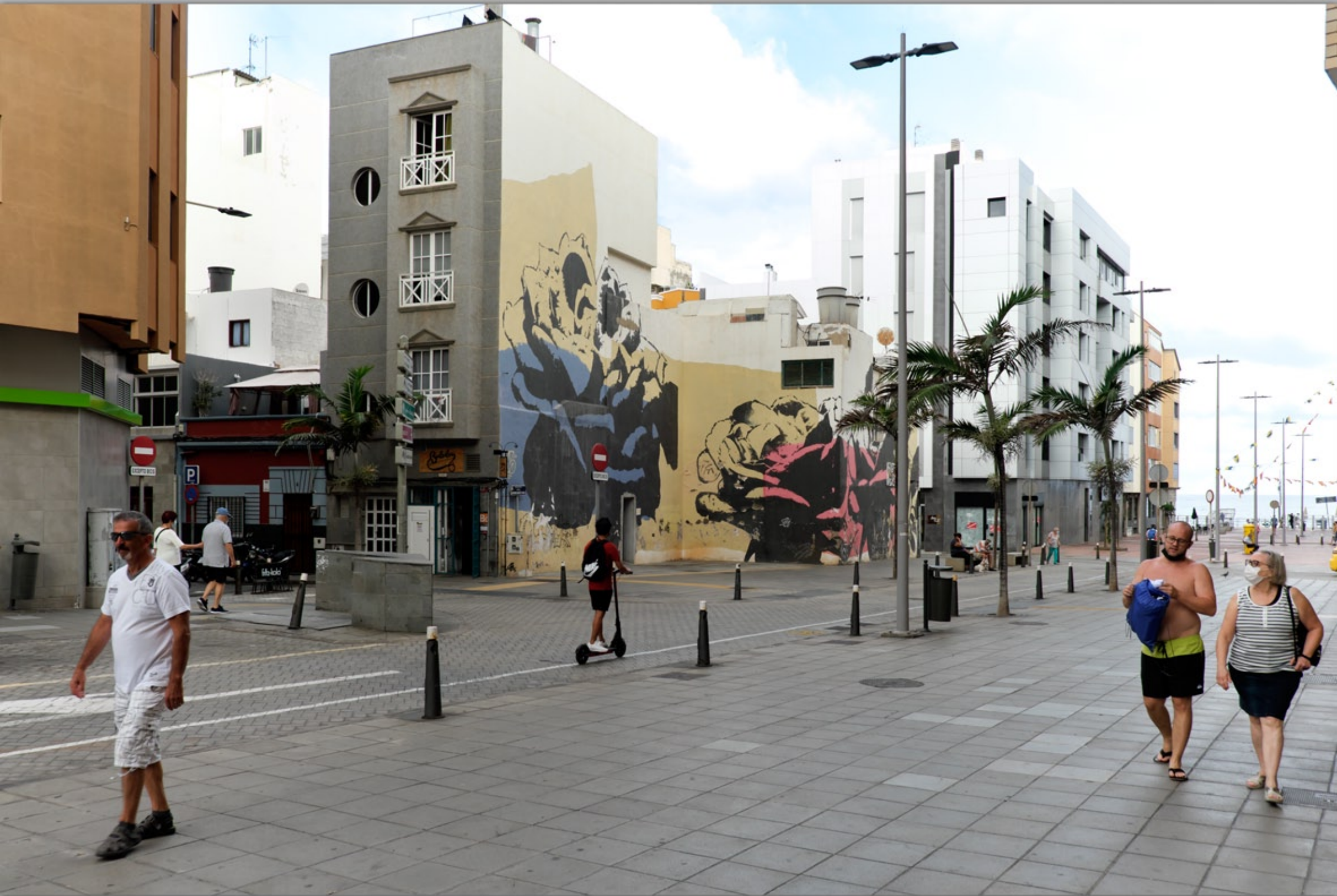
LAS PALMAS - Santa Catalina