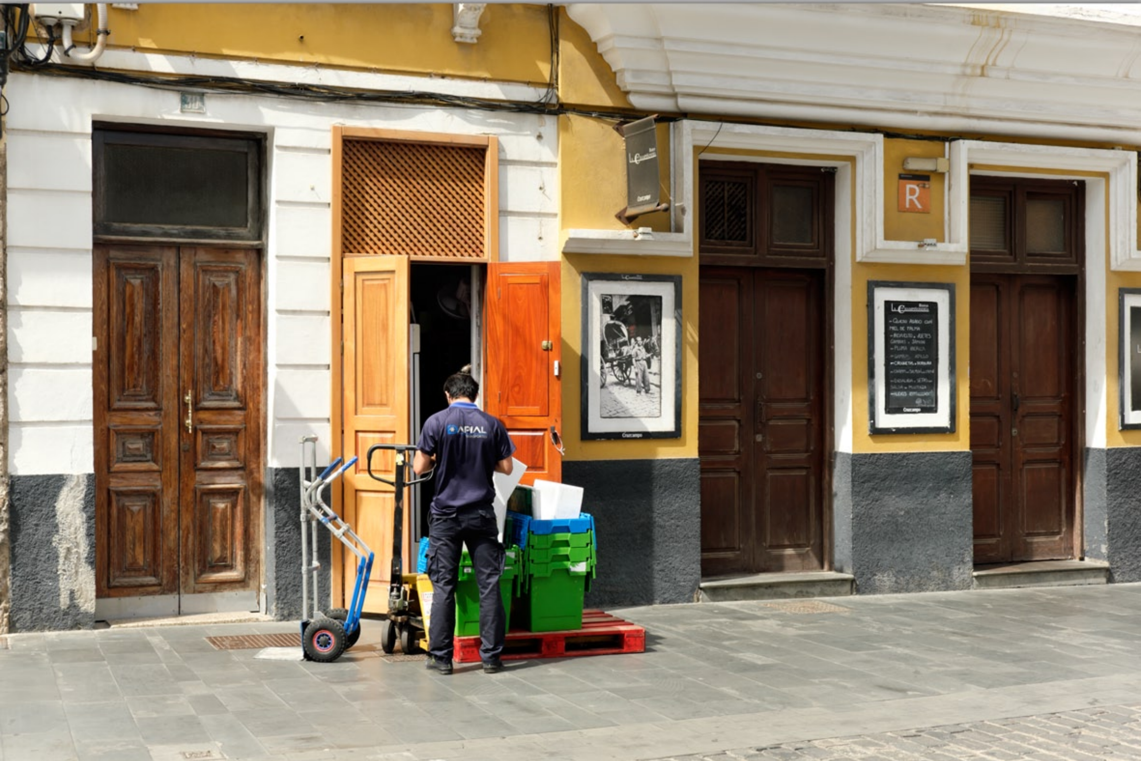
LAS PALMAS - Triana #Calle Triana (Einkaufstrasse)