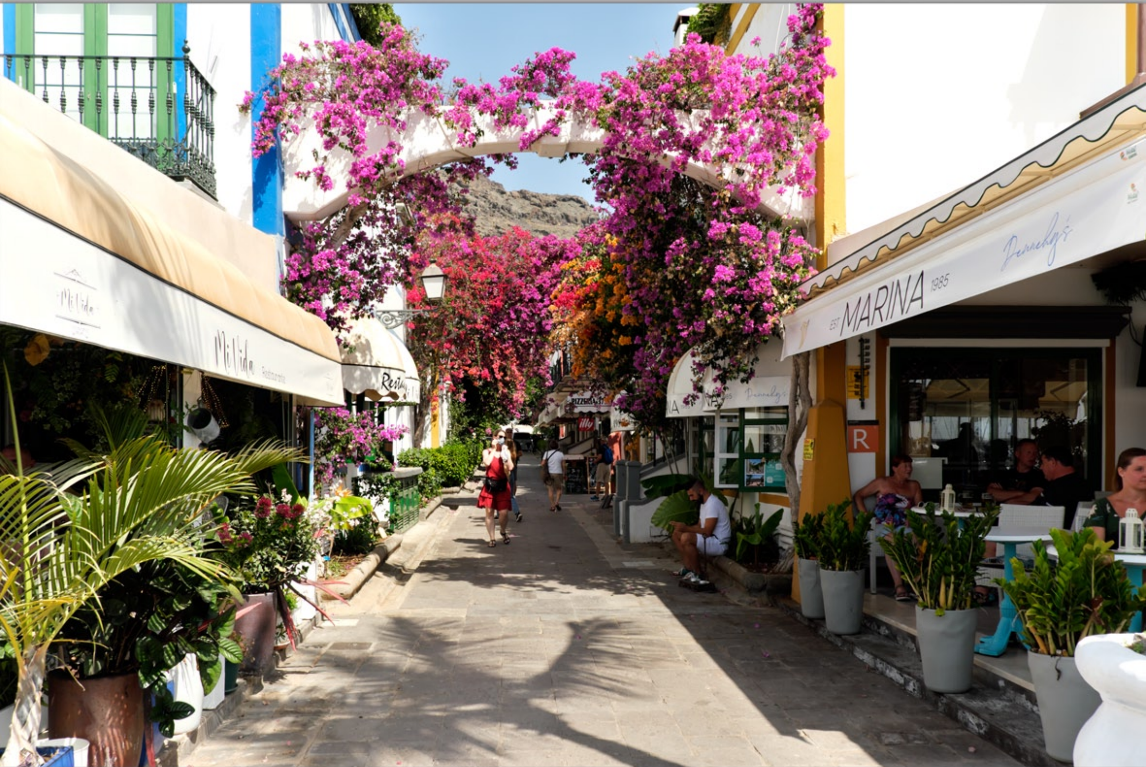
PUERTO DE MOGÁN