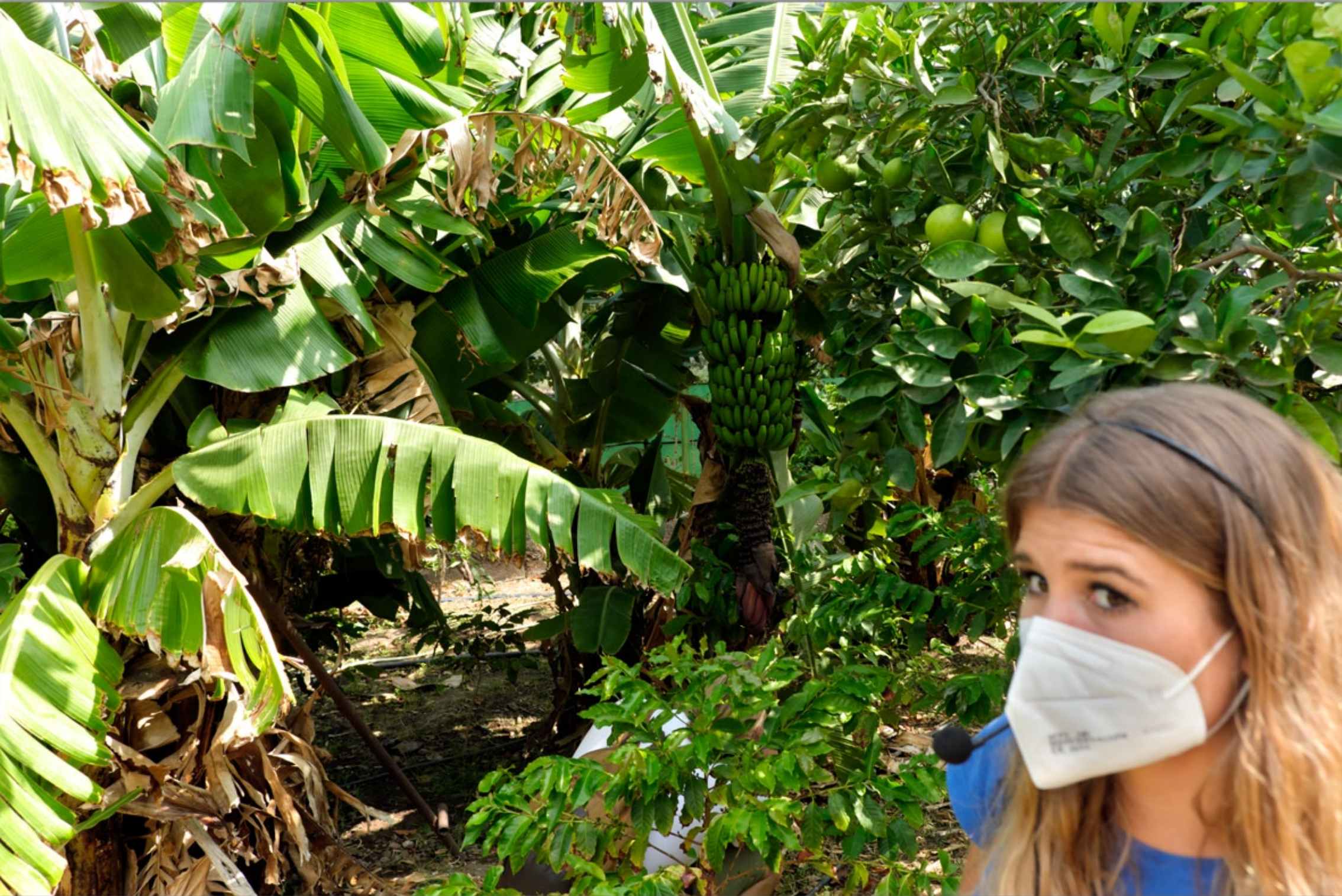
FINCA LA LAJA & BODEGA LOS BERRAZALES