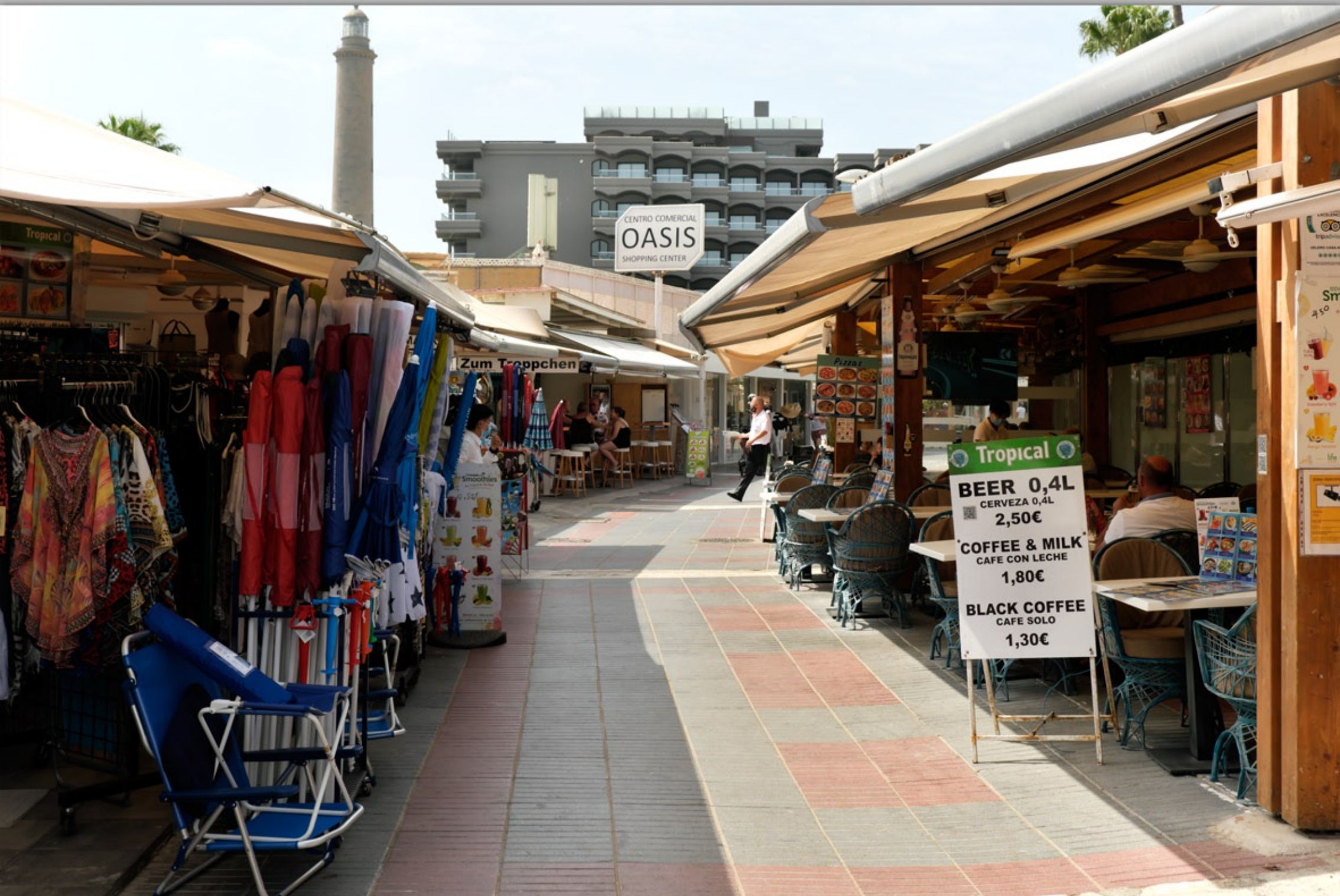
MASPALOMAS #El Oasis de Maspalomas