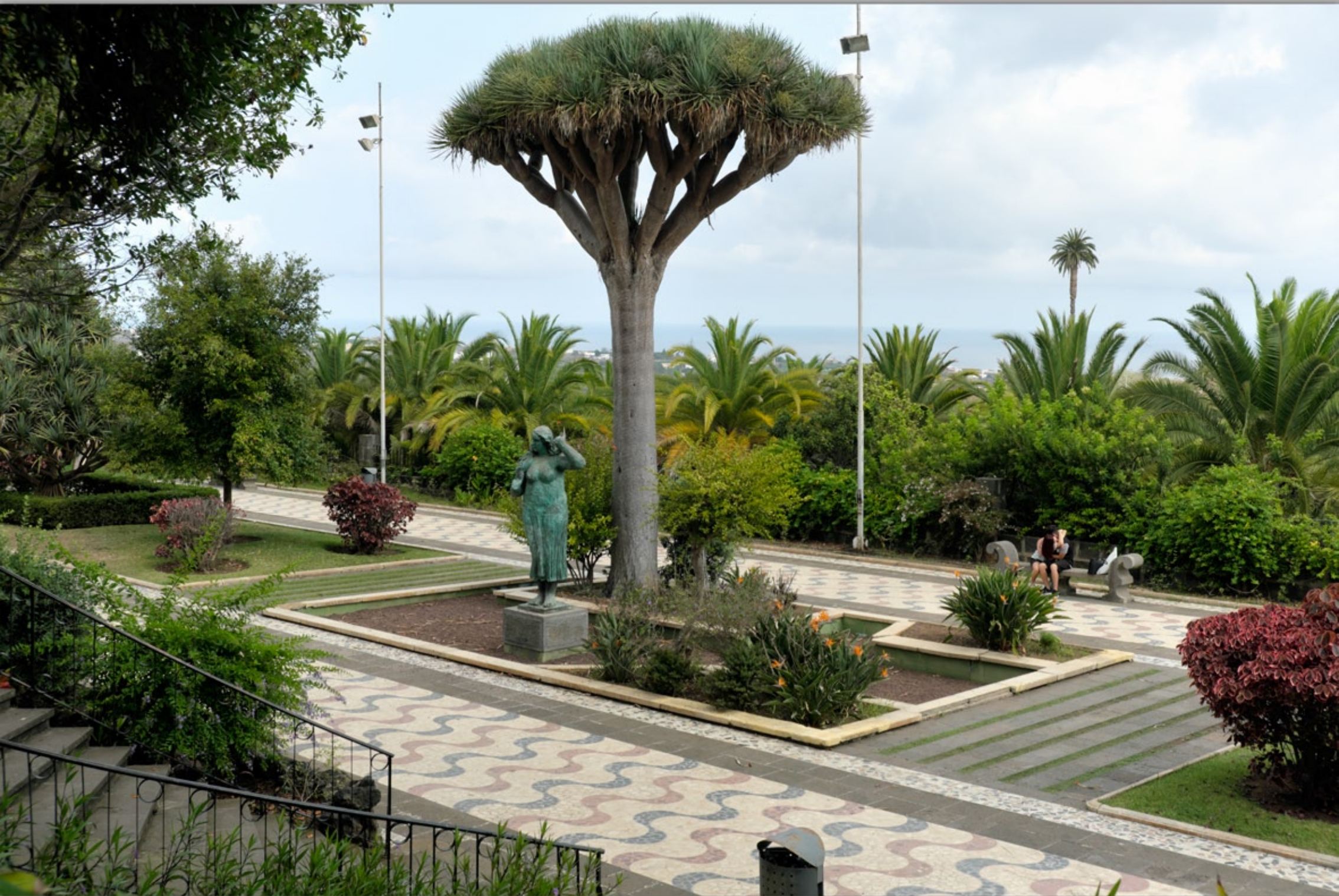
ARUCAS #Parque Municipal