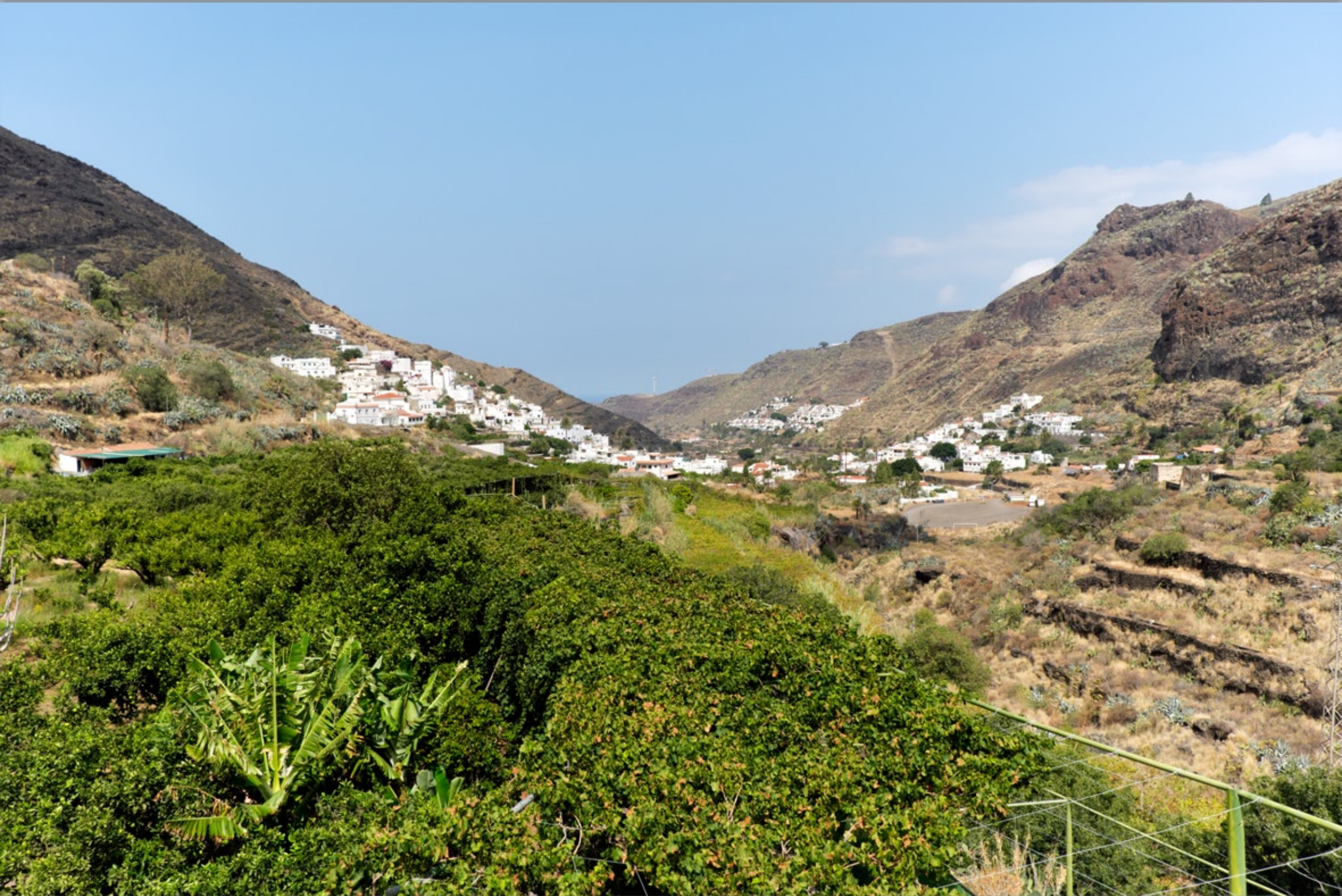
FINCA LA LAJA & BODEGA LOS BERRAZALES