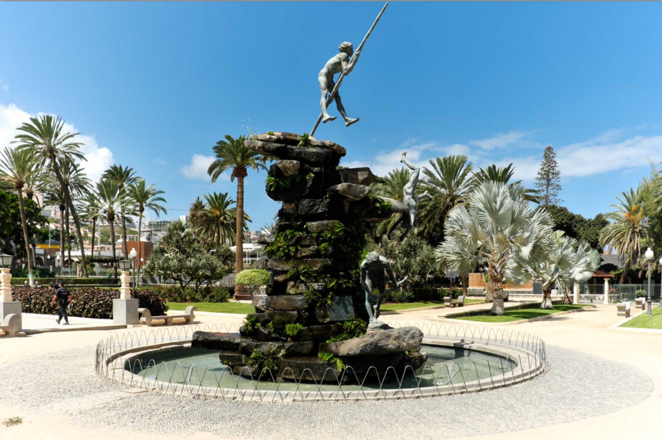
LAS PALMAS - Ciudad Jardin #Parque Doramas (der letzte altkanarische Herrscher Doramas beim Sprung in den Freitod)