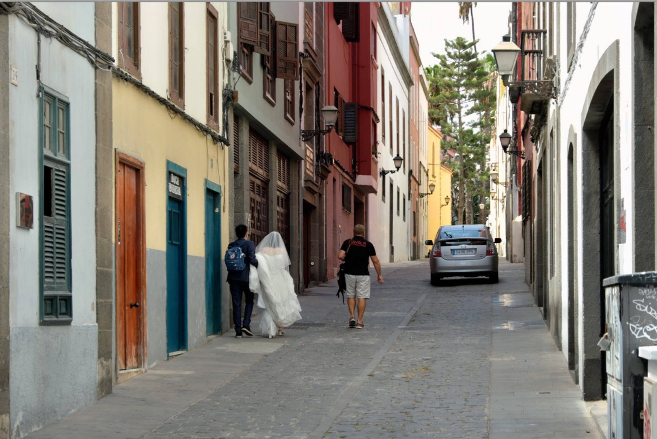
LAS PALMAS - Vegueta (Altstadt)