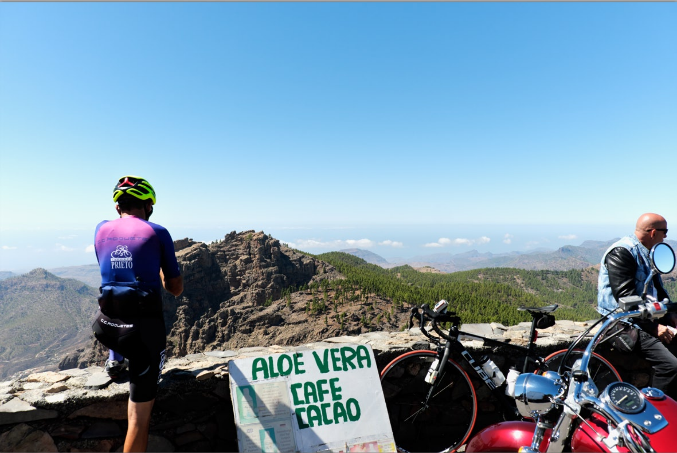
PICO DE LAS NIEVES (Vulkan-Berge)