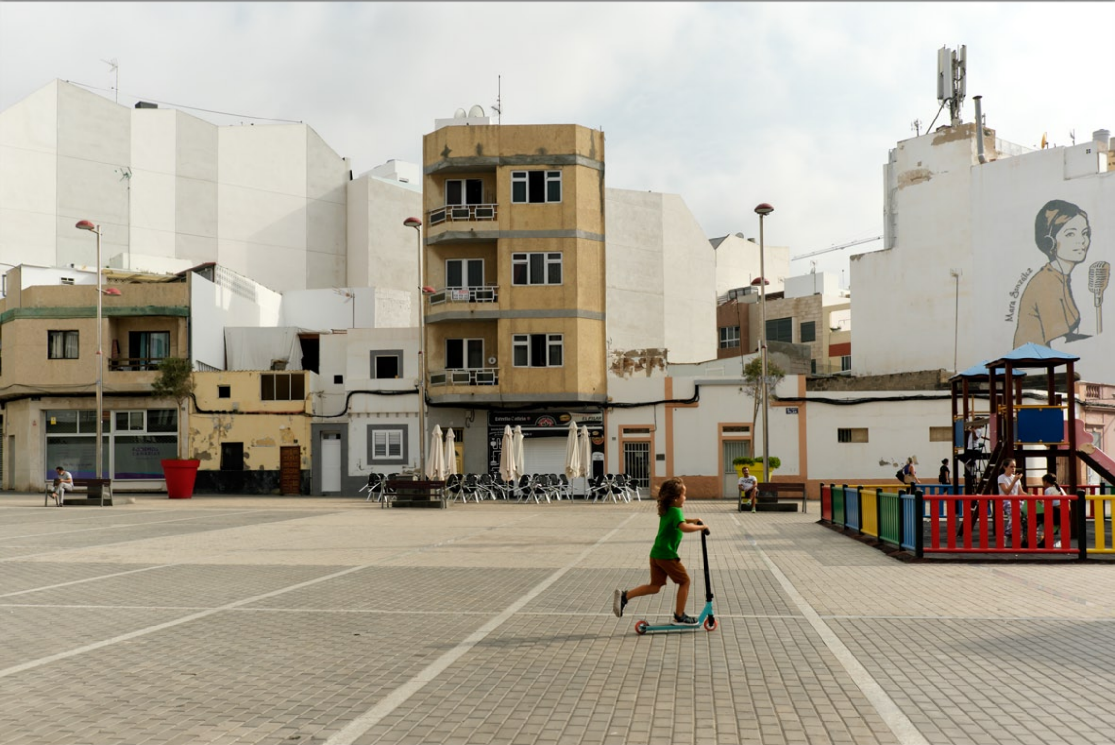
LAS PALMAS - Guanarteme