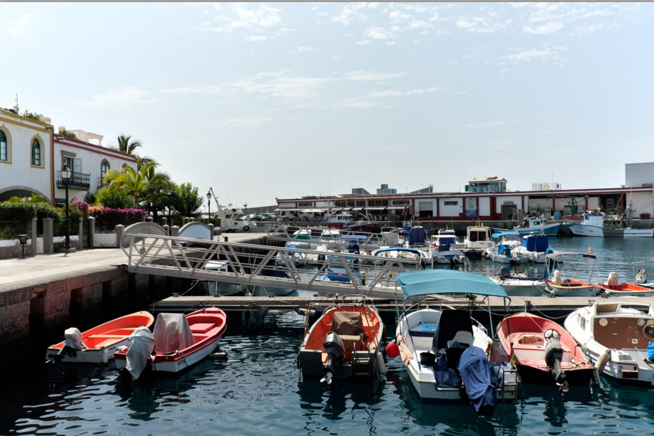
PUERTO DE MOGÁN