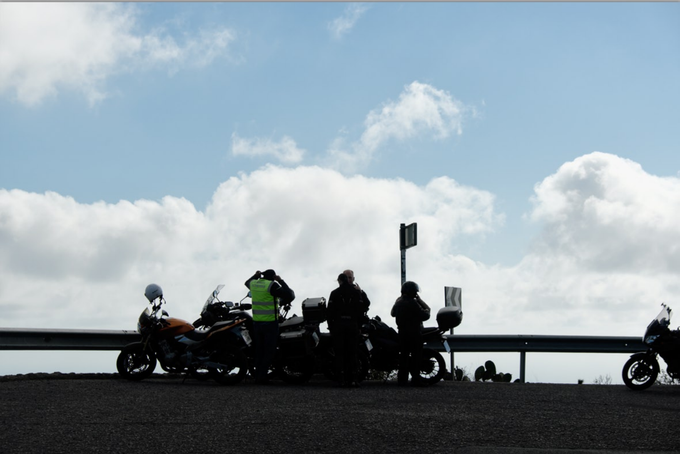
CALDERA BANDAMA (Vulkan-Berge)