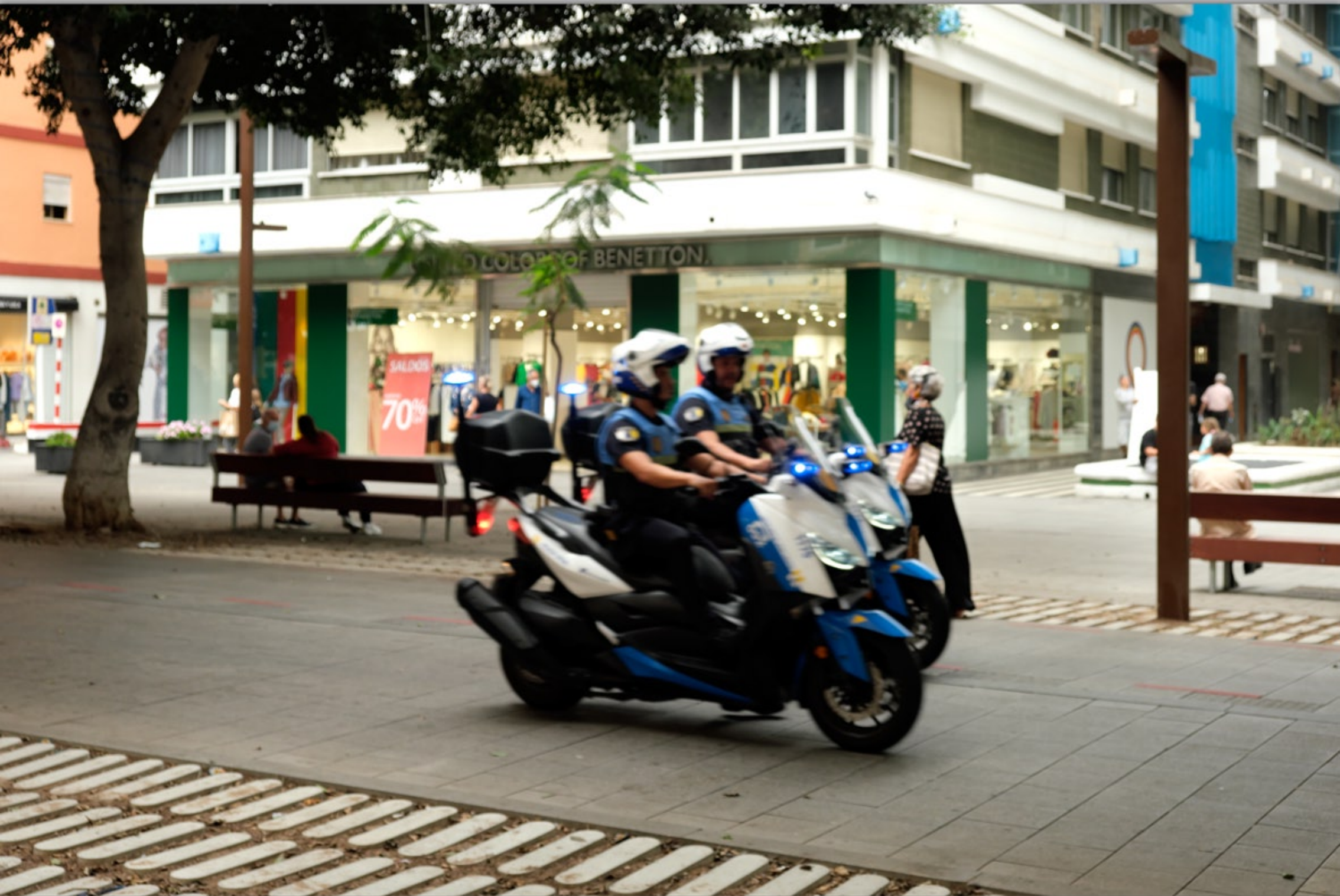
LAS PALMAS - Santa Catalina #Avenida José Mesa y López (Einkaufstraße)