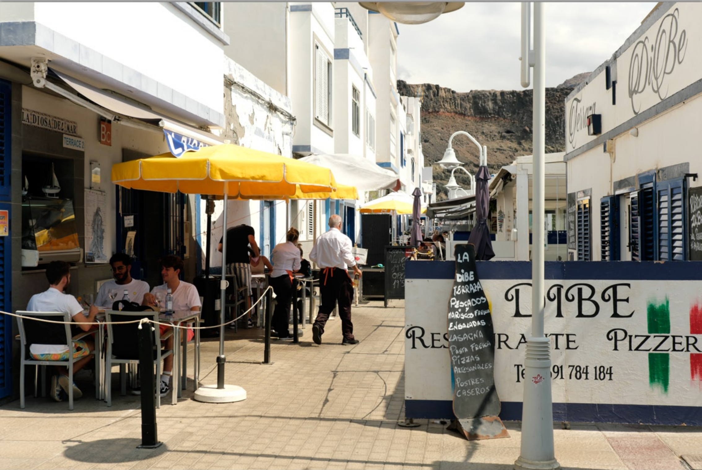
PUERTO DE LAS NIEVES