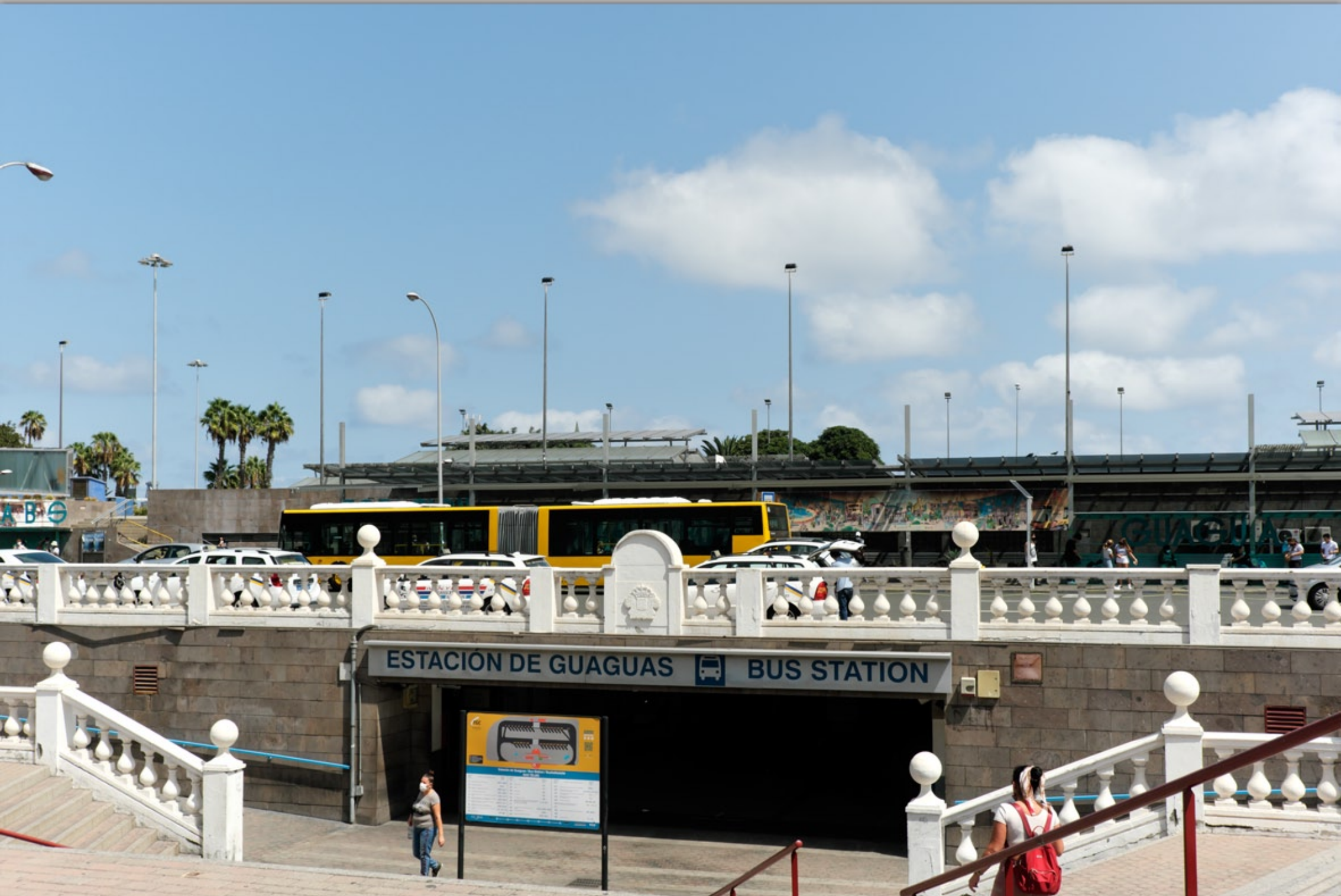
LAS PALMAS - San Telmo #unterirdischer Busbahnhof