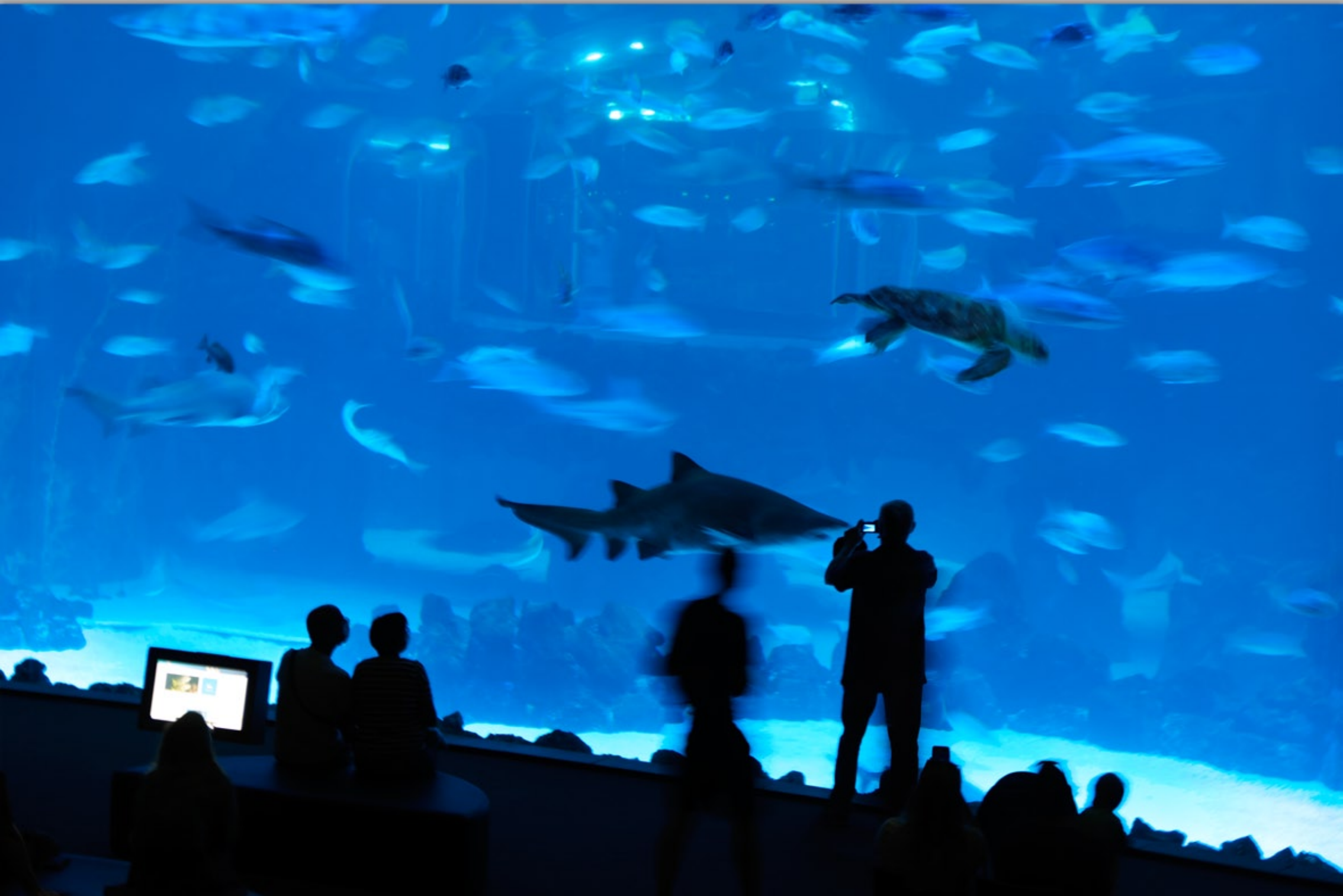
LAS PALMAS - Santa Catalina #Poema del Mar (Aquarium)