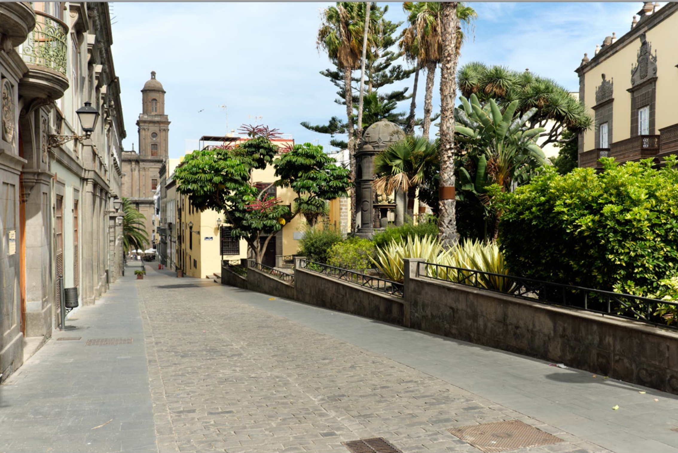
LAS PALMAS - Vegueta (Altstadt) #Plaza Espiritu Santo