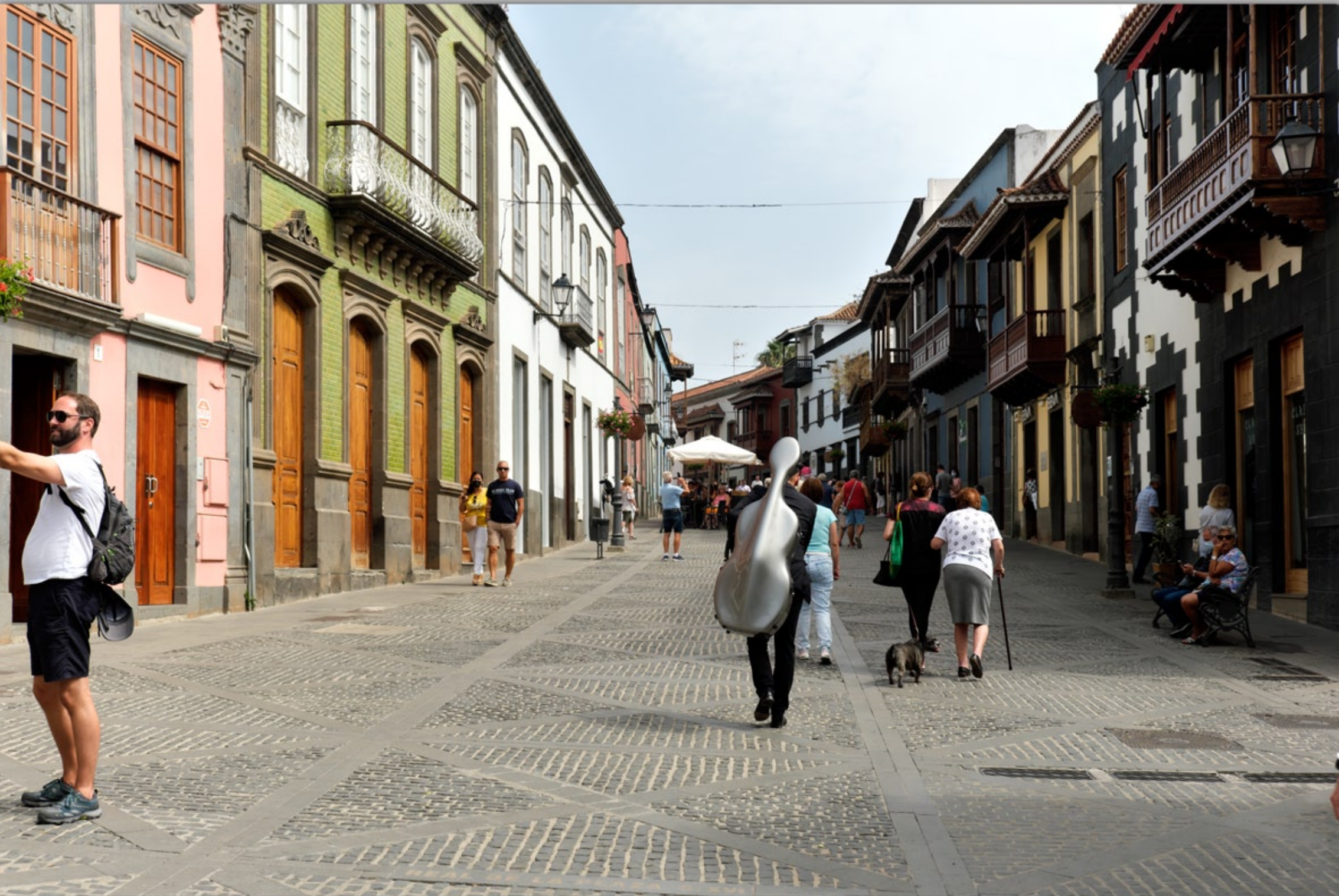
TEROR #Calle Real de la Plaza (Straße der Balkone)