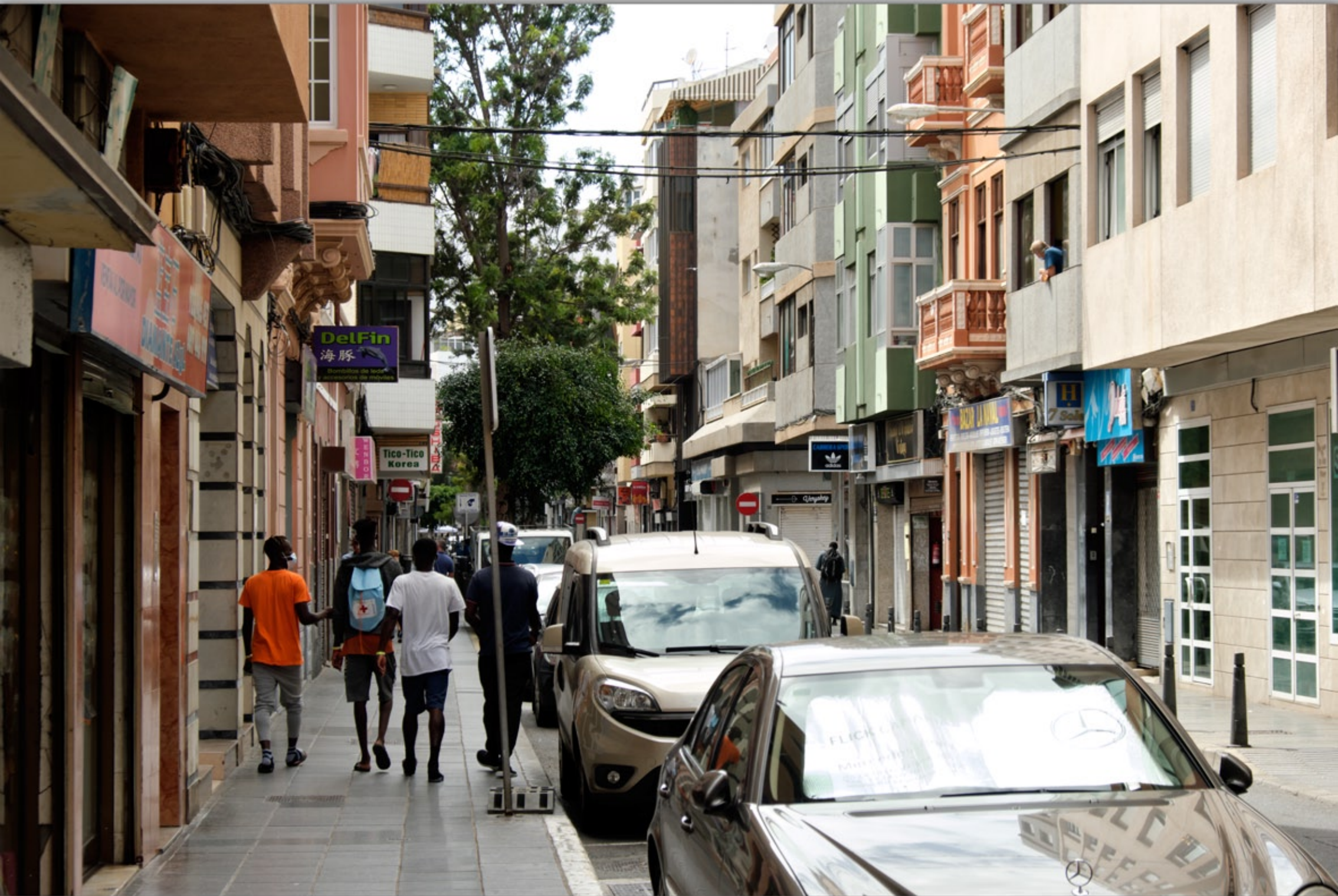
LAS PALMAS - Puerto