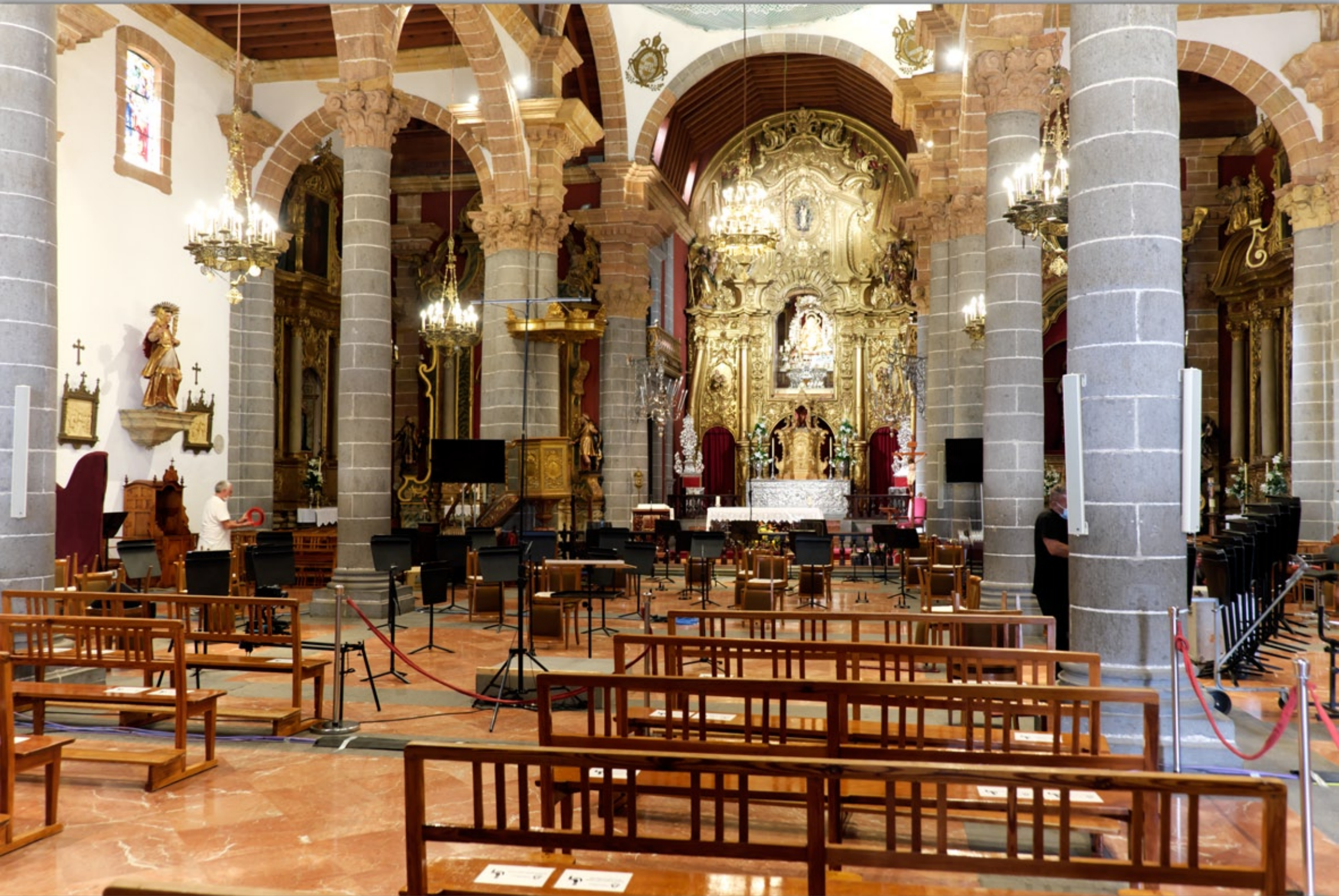
TEROR #Basilica Nuestra Senora Del Pino