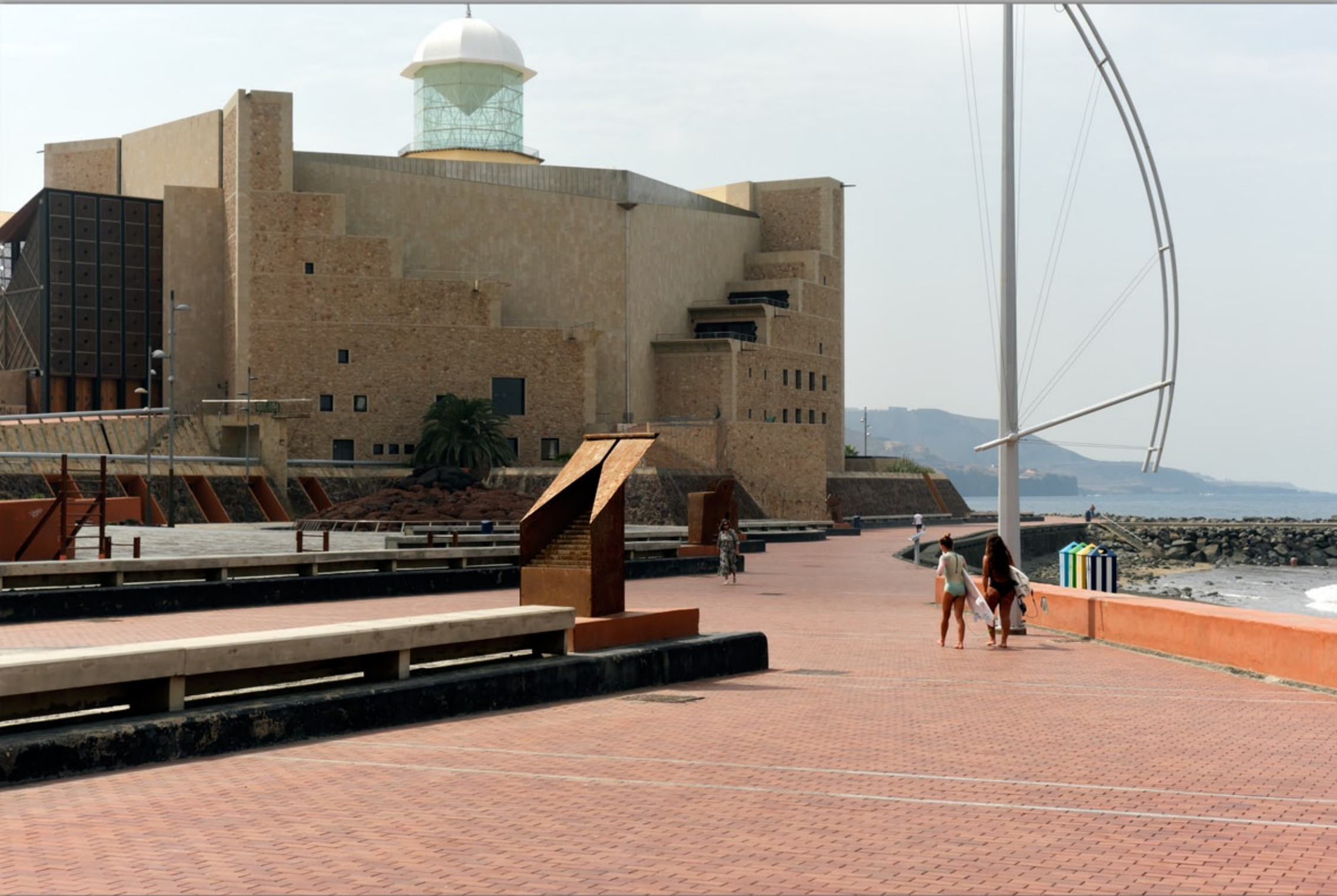
LAS PALMAS - Guanarteme #Playa de Las Canteras (Strand & Promenade) #Auditorio