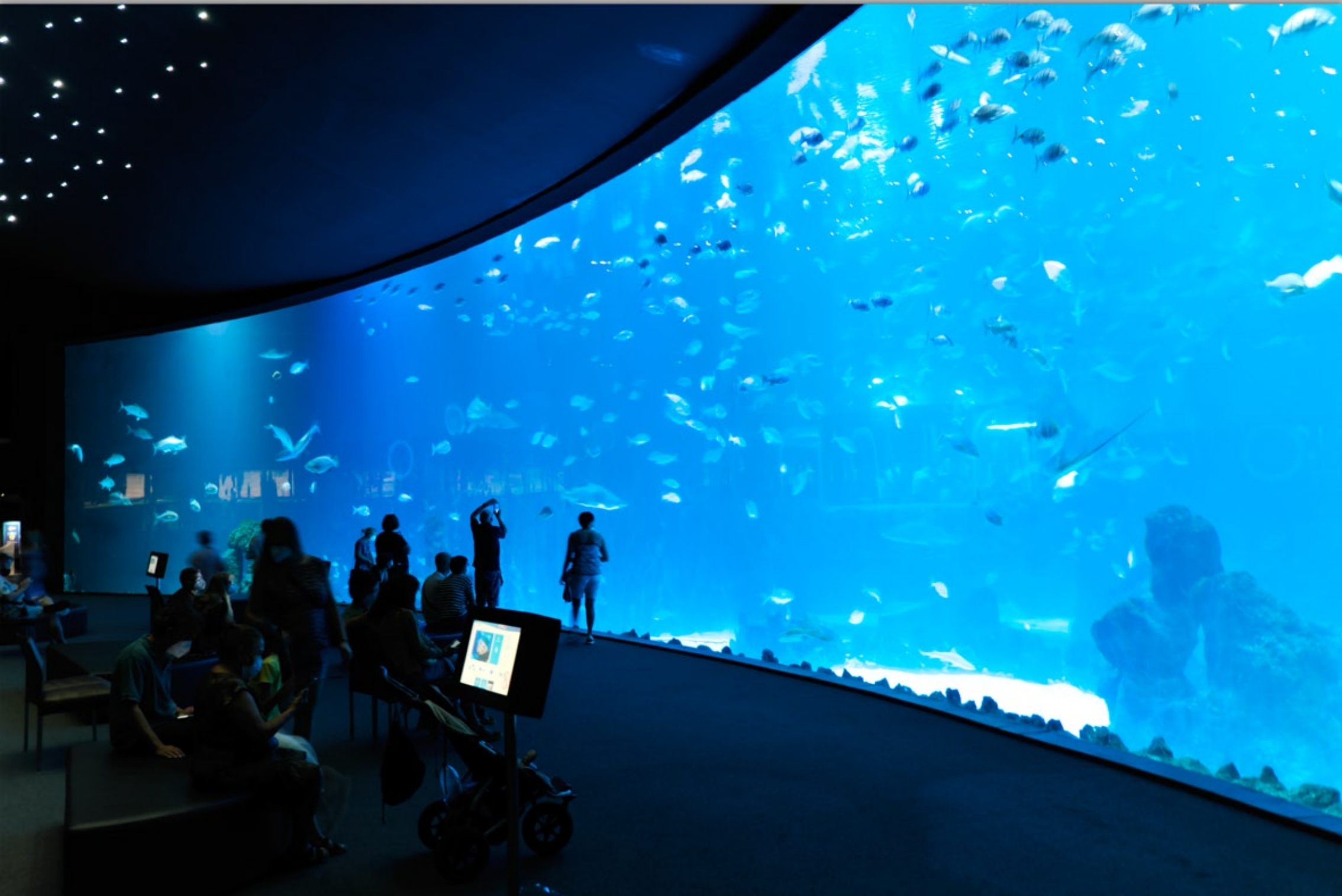
LAS PALMAS - Santa Catalina #Poema del Mar (Aquarium)