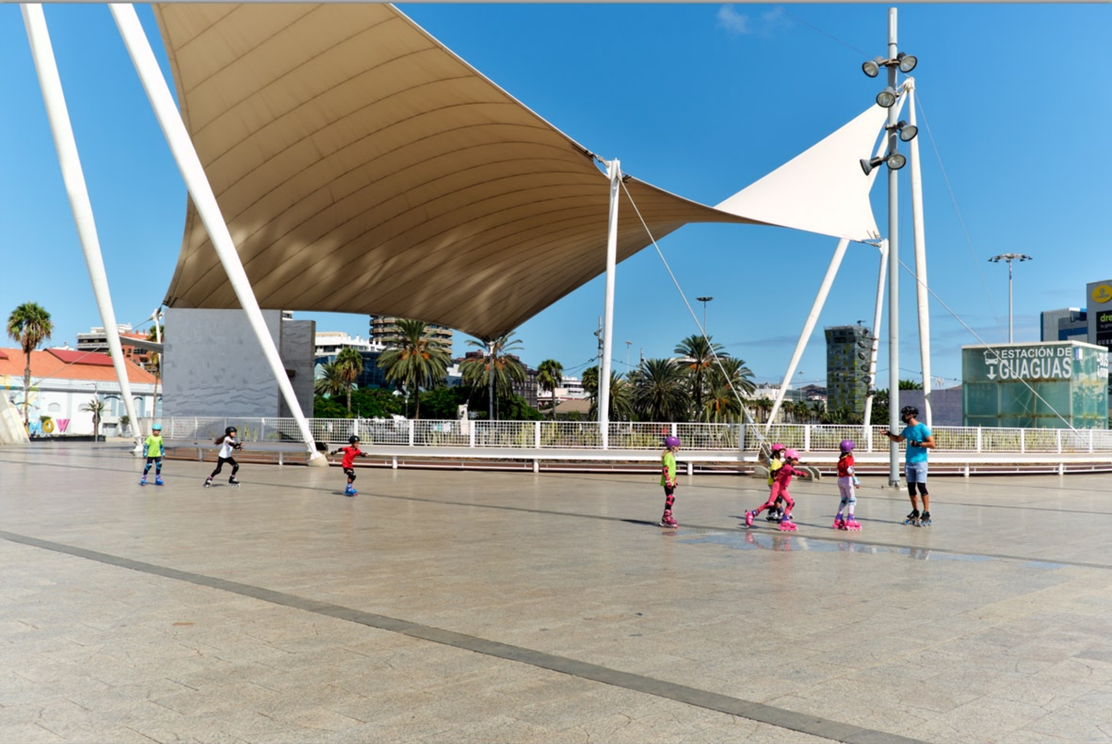
LAS PALMAS - Santa Catalina #Parque de Santa Catalina #unterirdischer Busbahnhof