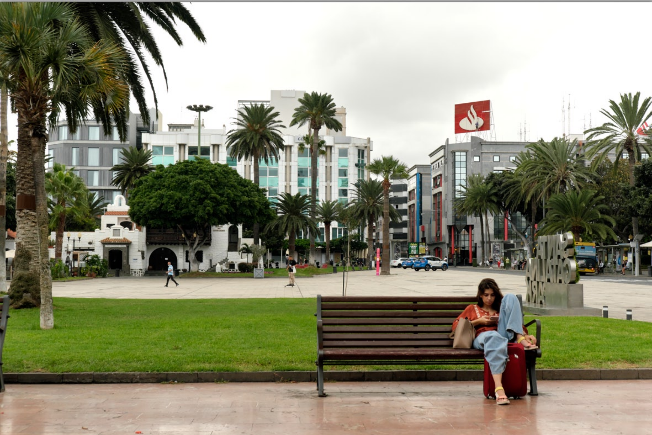
LAS PALMAS - Santa Catalina #Parque Santa Catalina