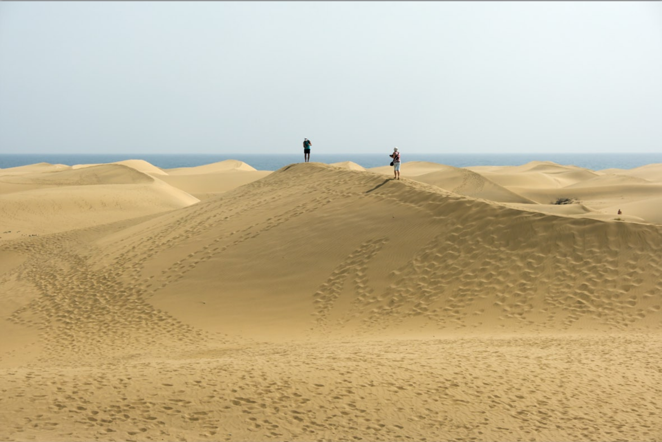
MASPALOMAS #Dunas de Maspalomas