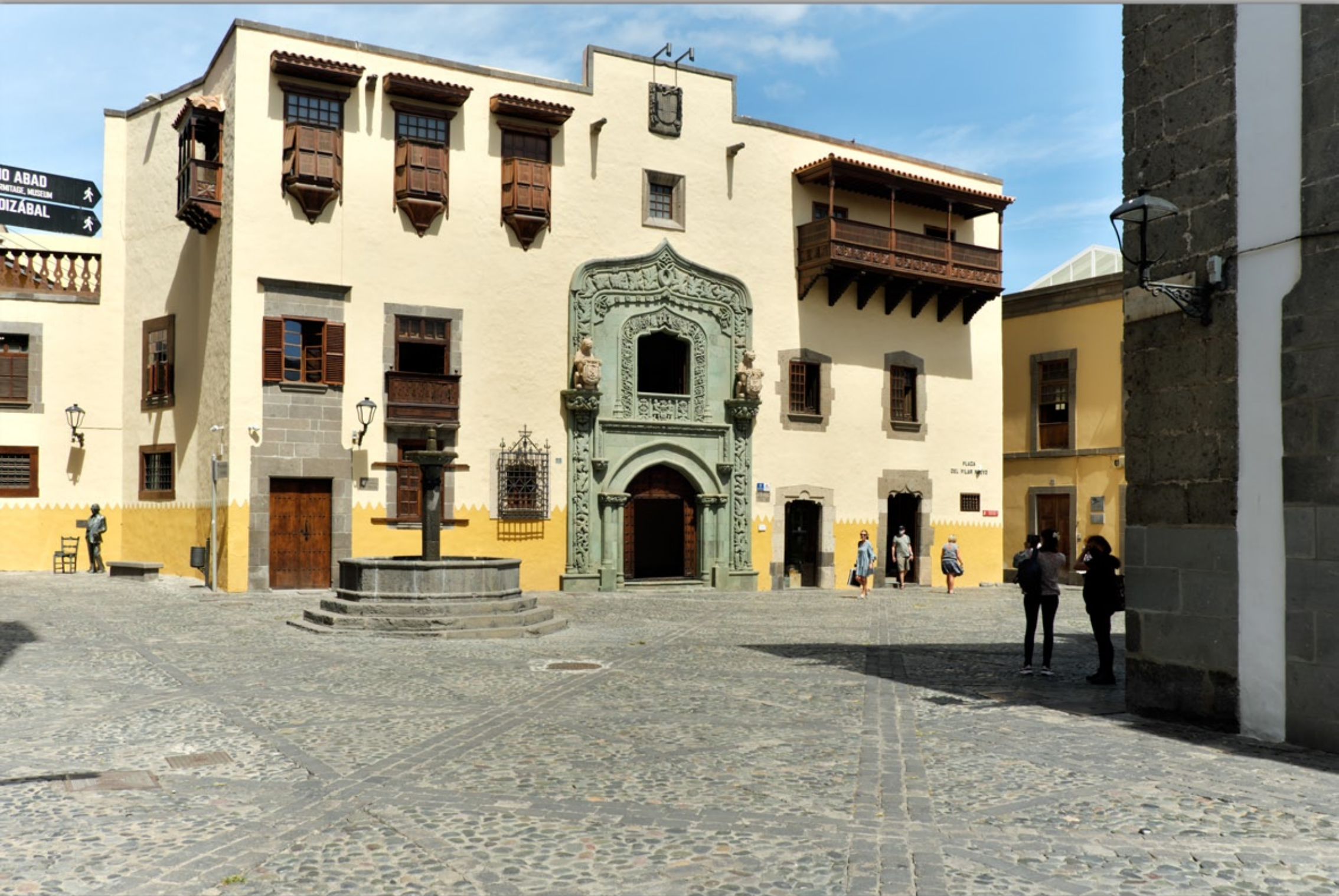
LAS PALMAS - Vegueta (Altstadt) #Casa de Colón (Kolumbushaus)