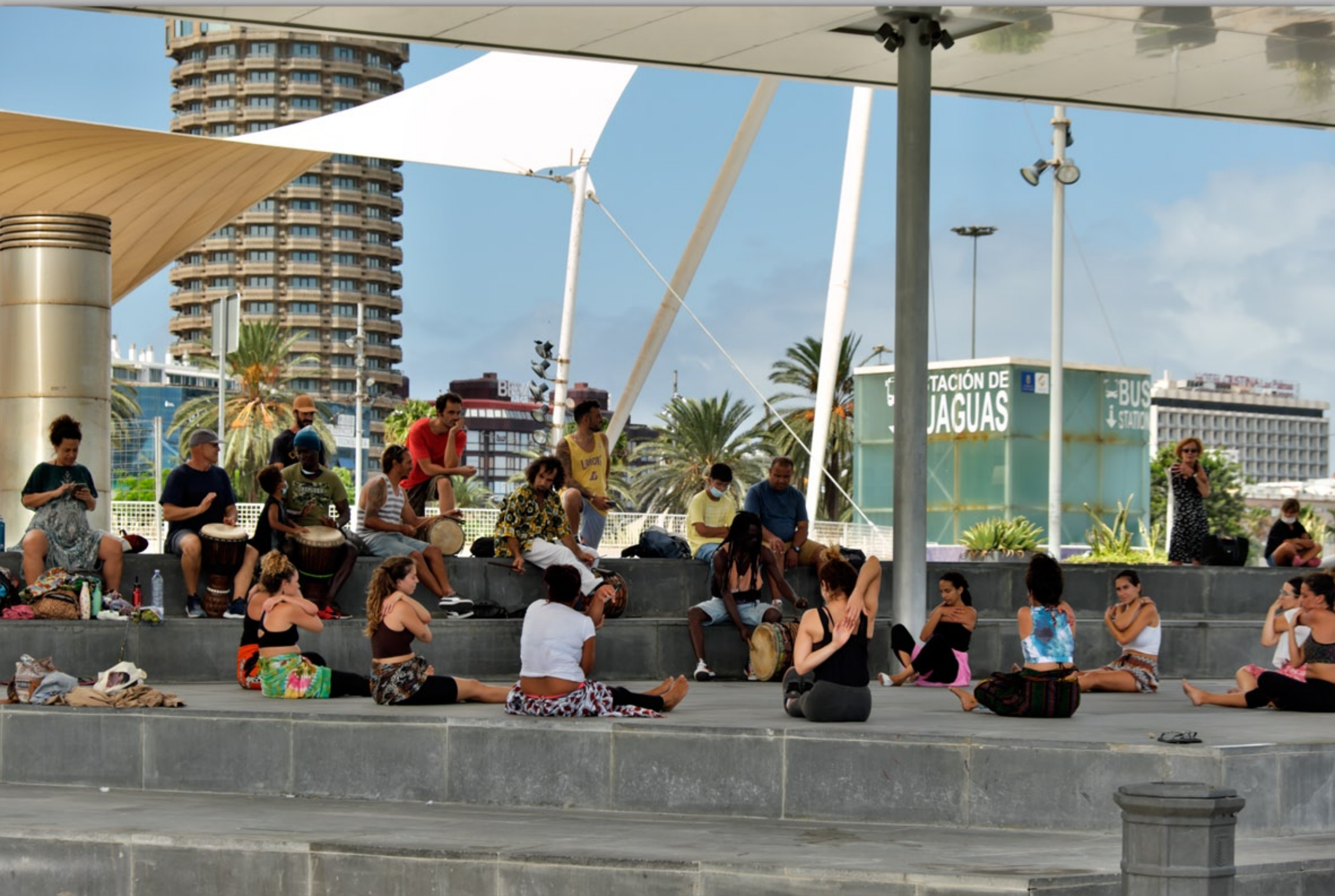
LAS PALMAS - Santa Catalina #Parque de Santa Catalina