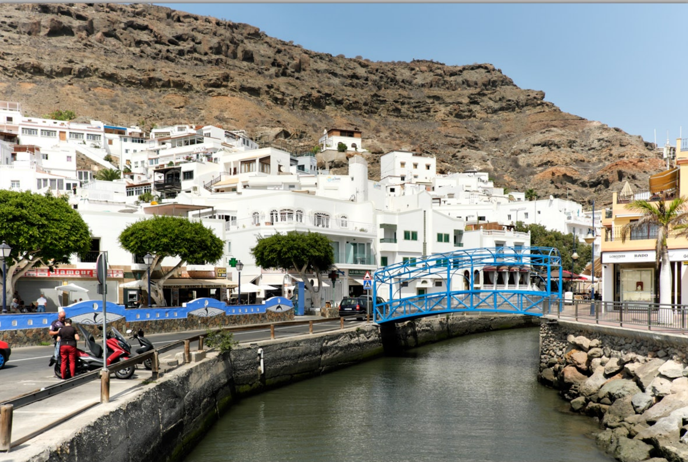
PUERTO DE MOGÁN