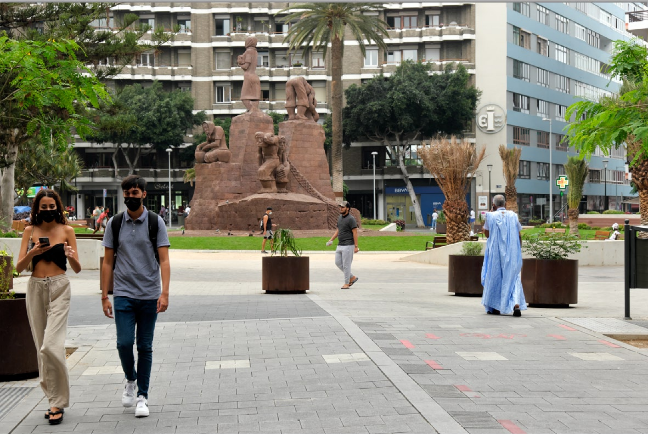
LAS PALMAS - Santa Catalina #Plaza de España