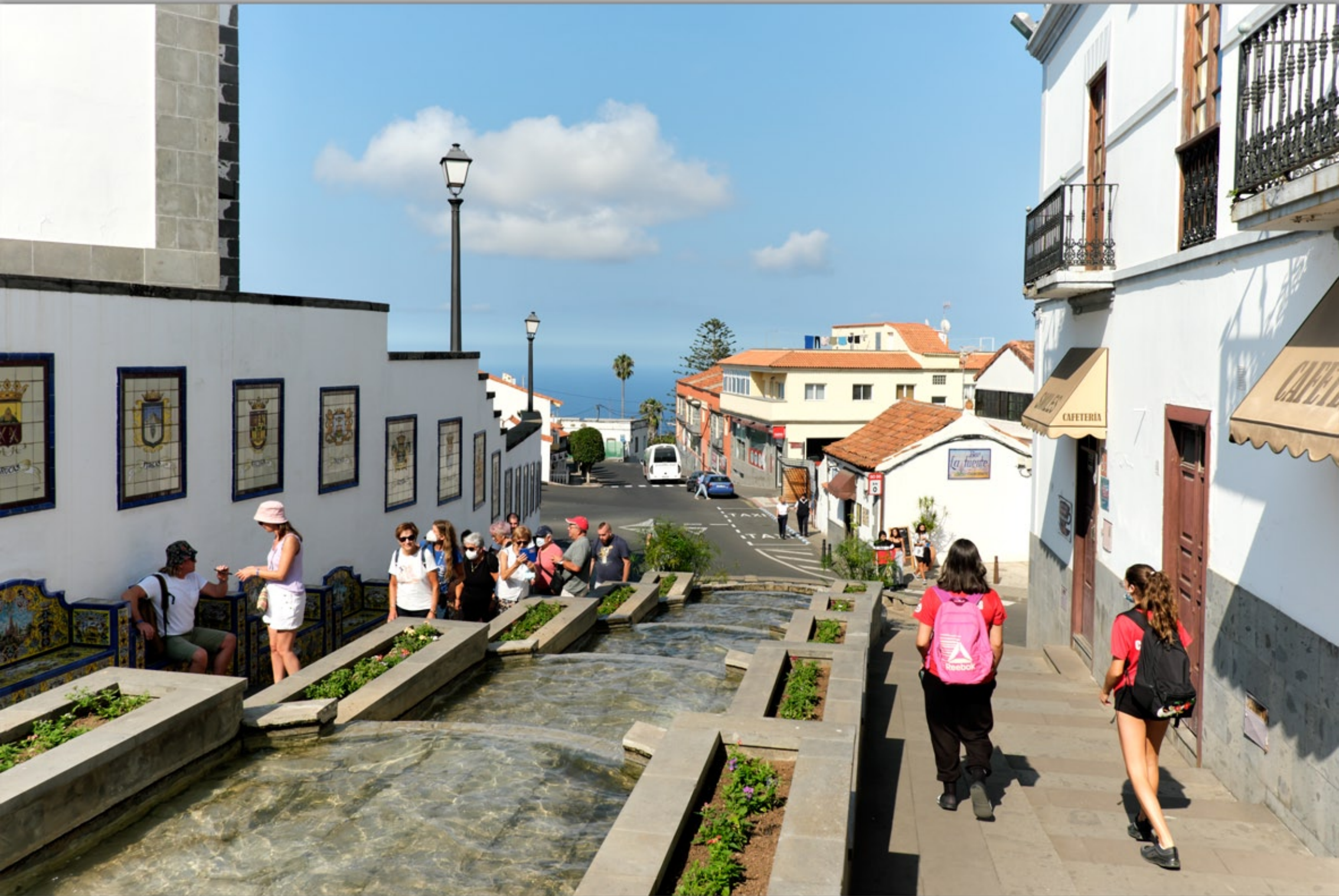
FIRGAS #Promenade Paseo de Gran Canaria