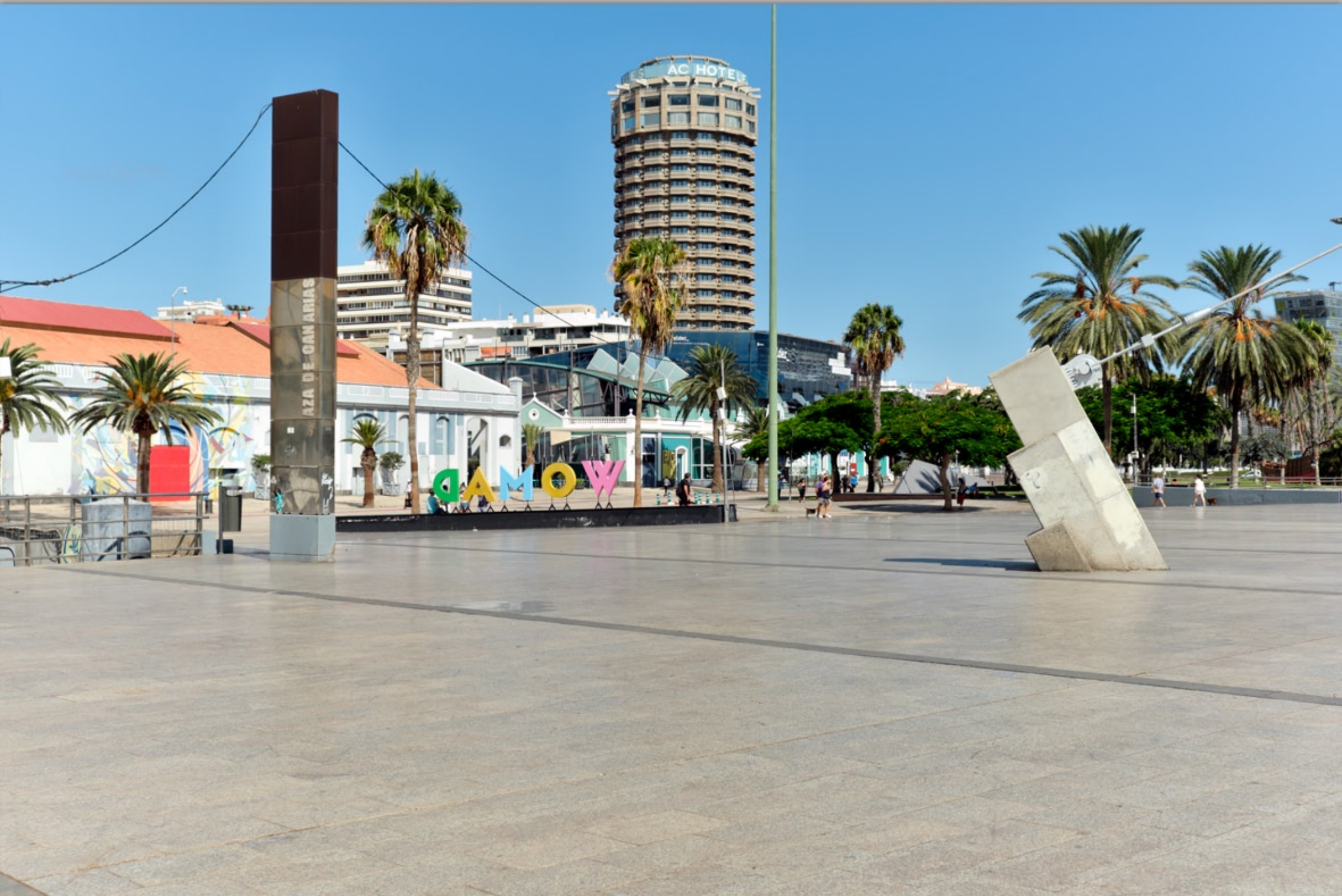
LAS PALMAS - Santa Catalina #Parque de Santa Catalina