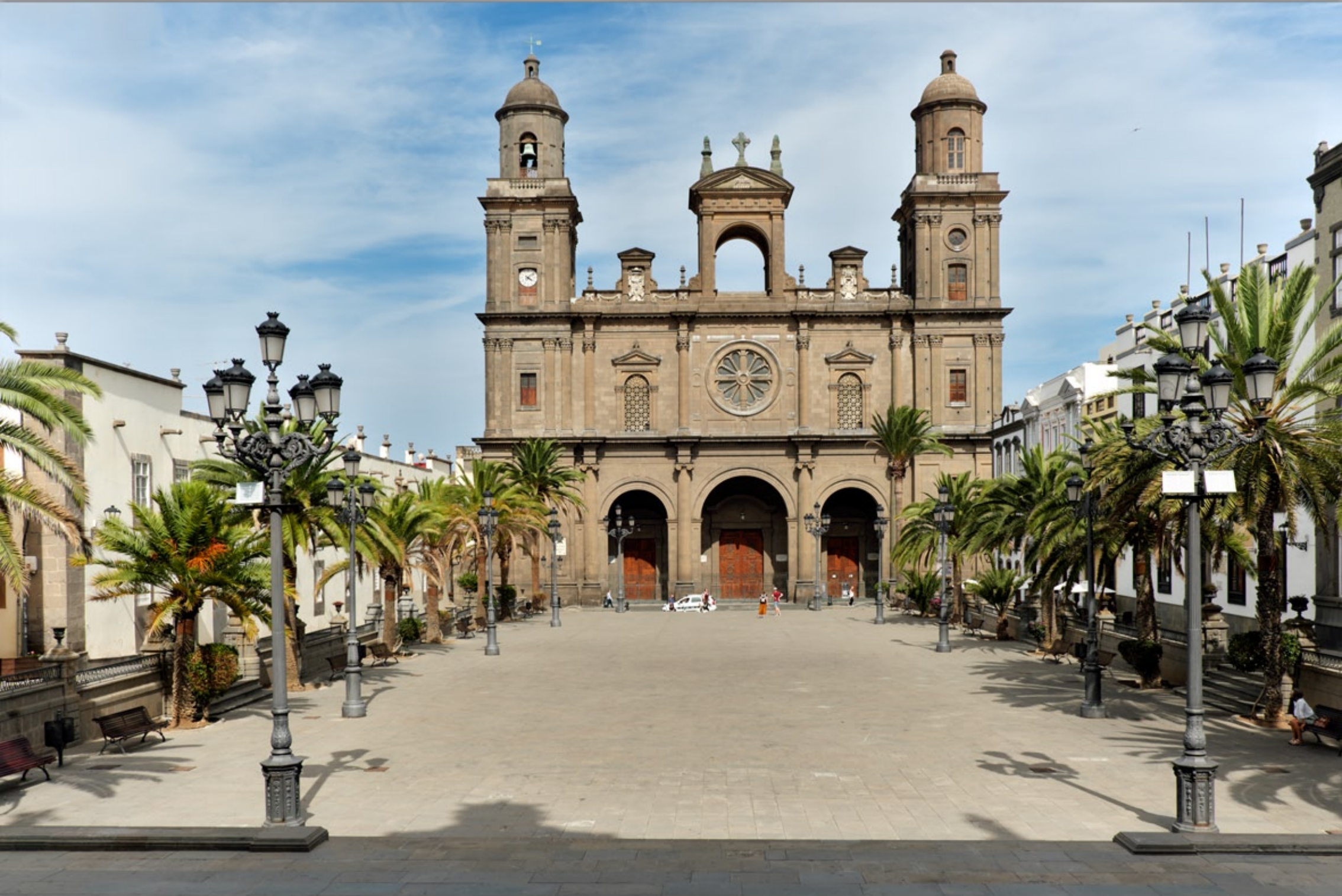
LAS PALMAS - Vegueta (Altstadt) #Catedral de Santa Ana