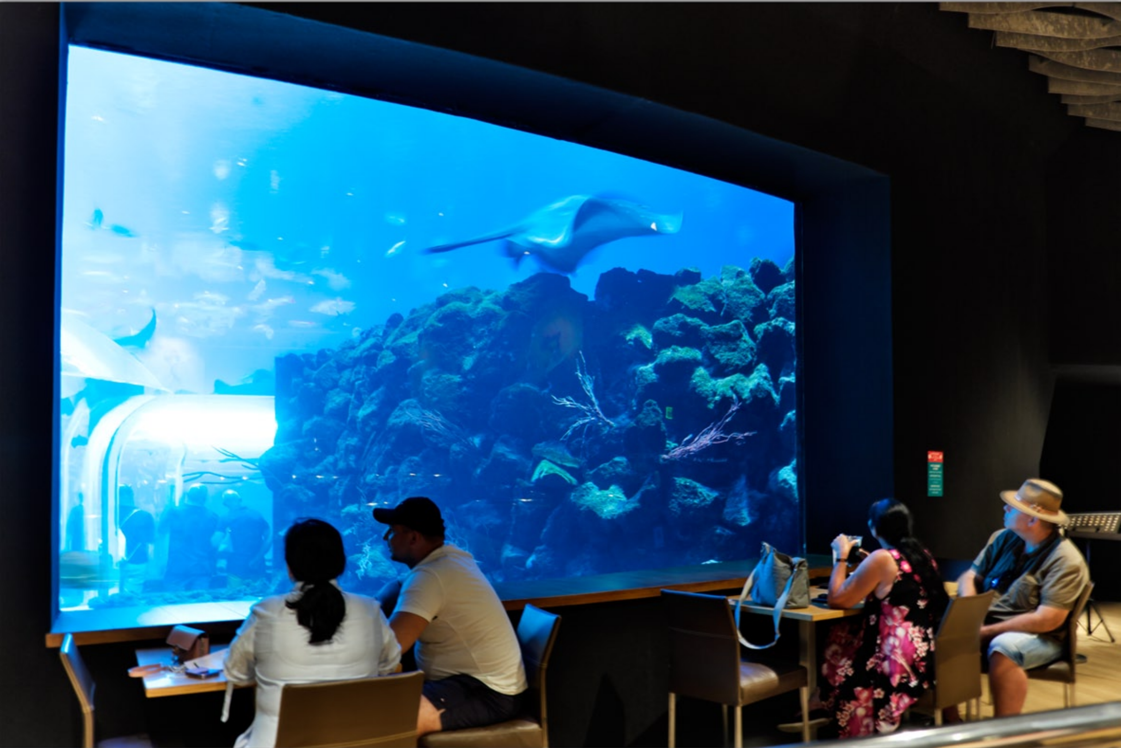
LAS PALMAS - Santa Catalina #Poema del Mar (Aquarium)