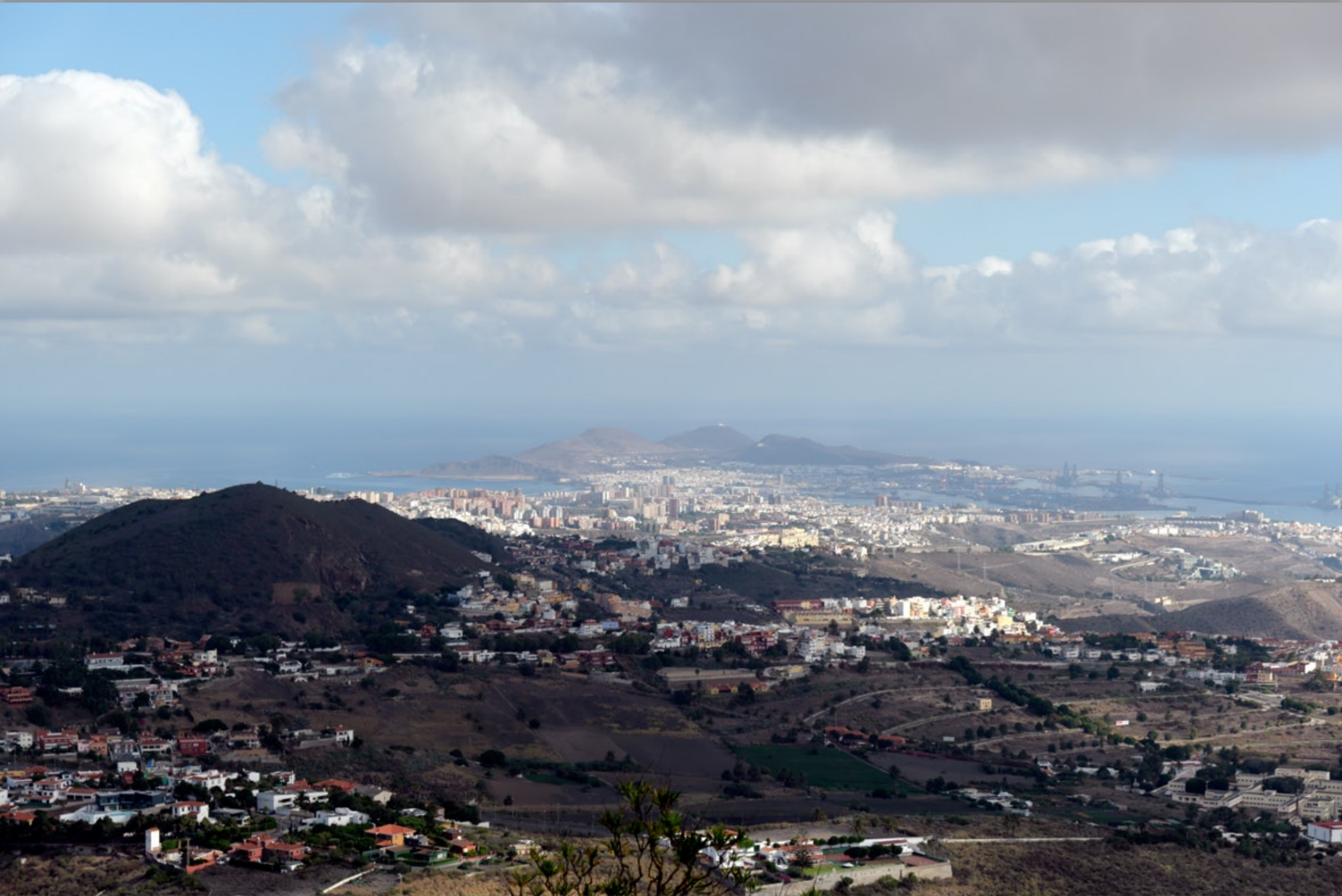
CALDERA BANDAMA (Vulkan-Berge #LAS PALMAS)