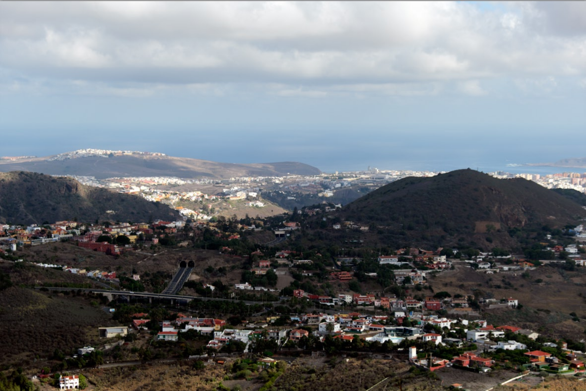
CALDERA BANDAMA (Vulkan-Berge)