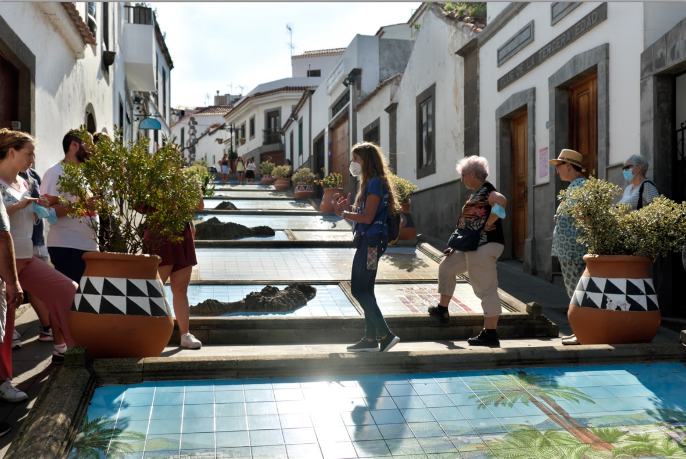
FIRGAS #Promenade Paseo de Gran Canaria