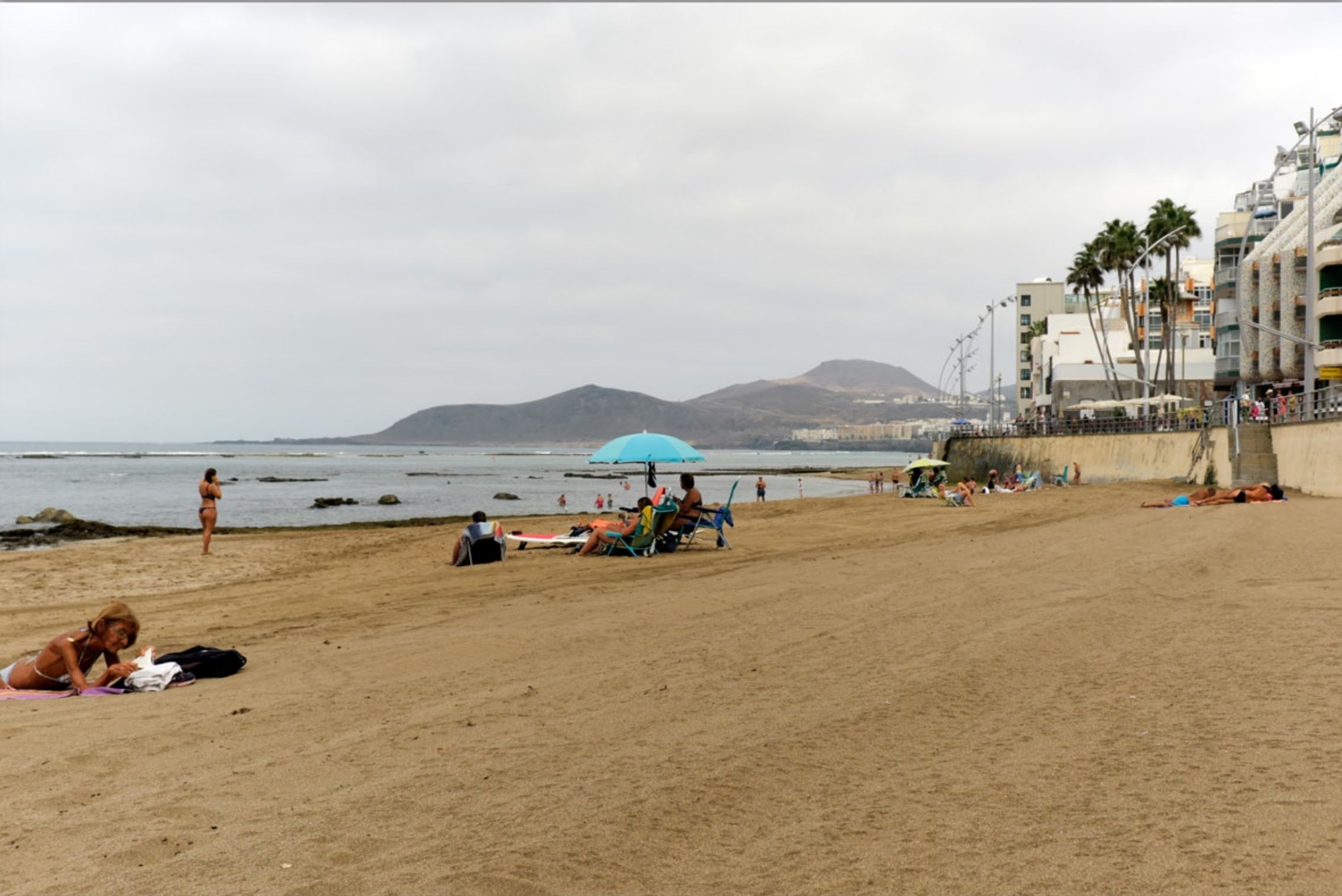
LAS PALMAS - Santa Catalina #Playa de Las Canteras (Strand & Promenade)