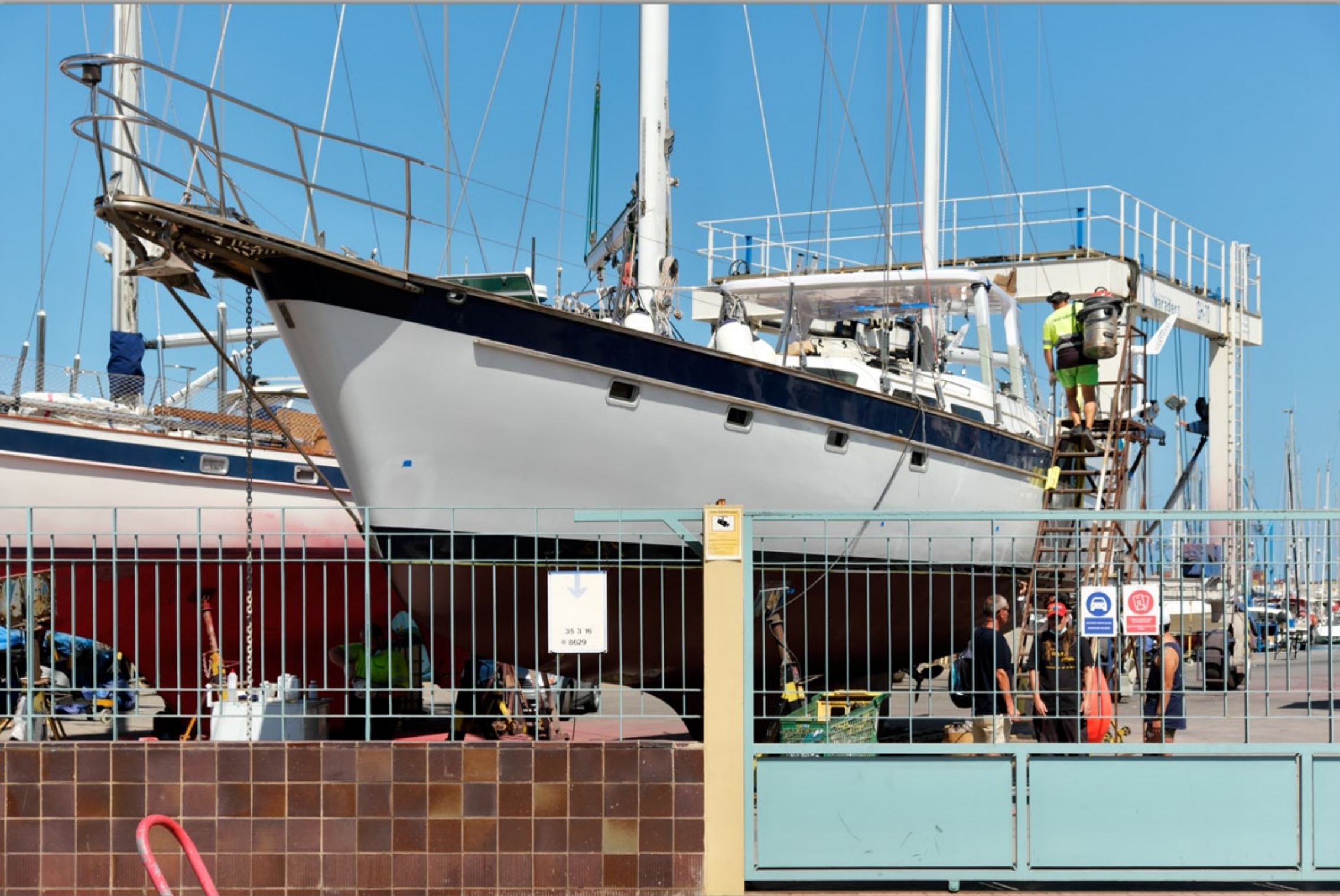
LAS PALMAS - Ciudad Jardin #Yachthafen