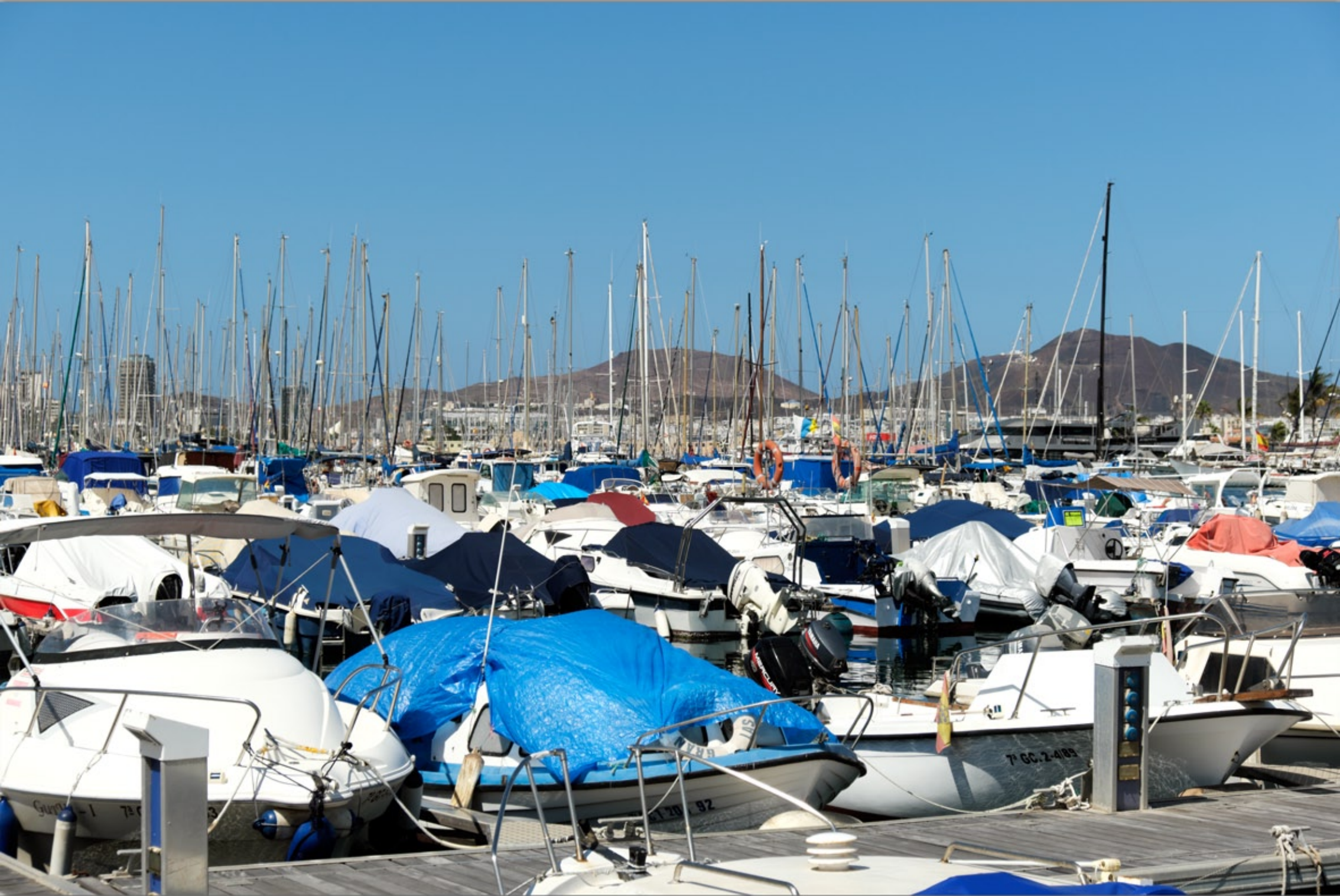
LAS PALMAS - Ciudad Jardin #Yachthafen