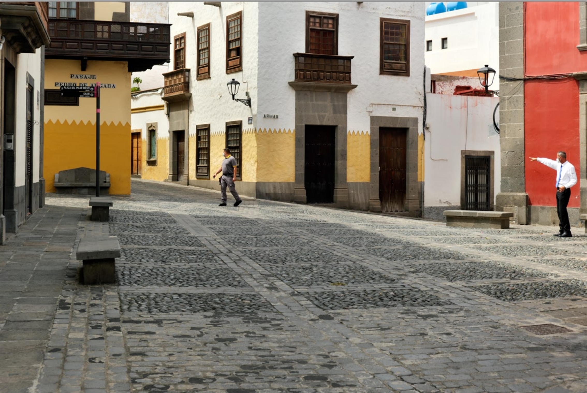
LAS PALMAS - Vegueta (Altstadt)