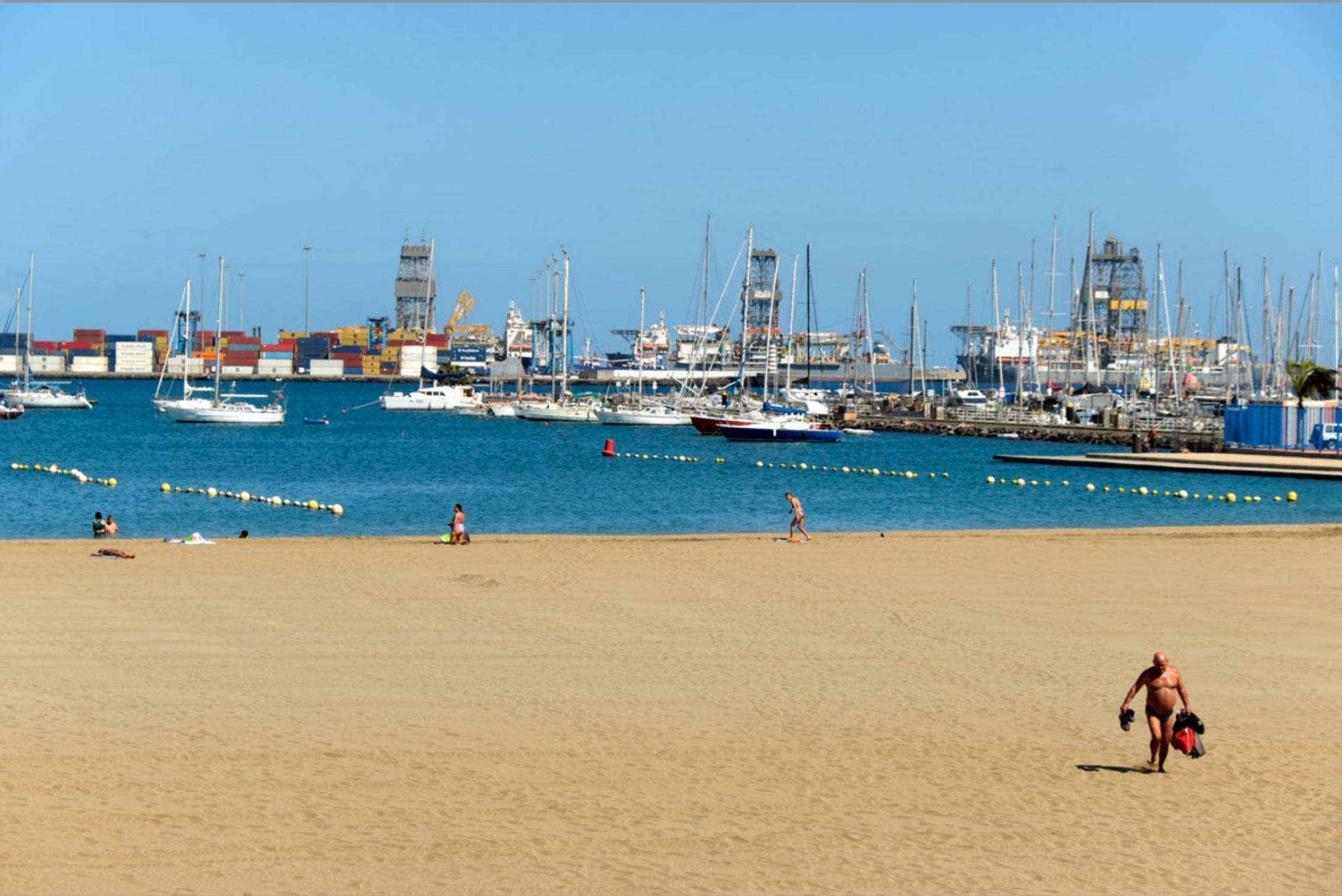
LAS PALMAS - Ciudad Jardín