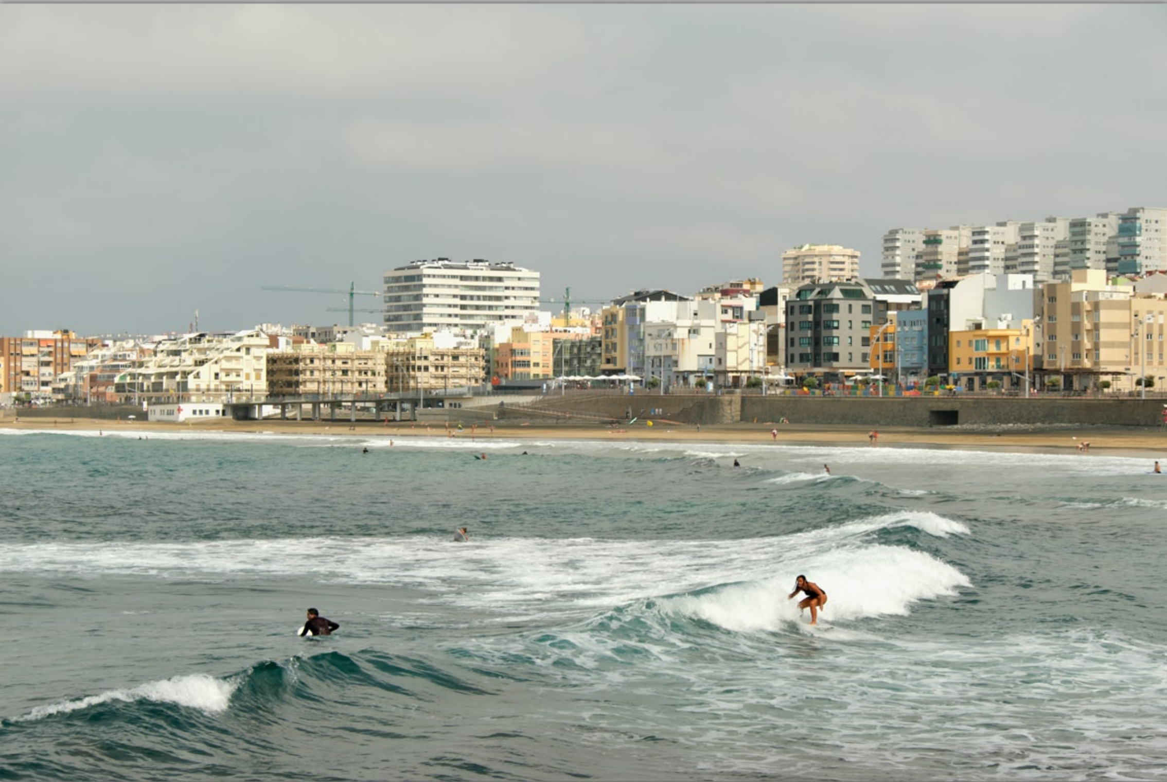
LAS PALMAS - Guanarteme #Playa de Las Canteras (Strand & Promenade)