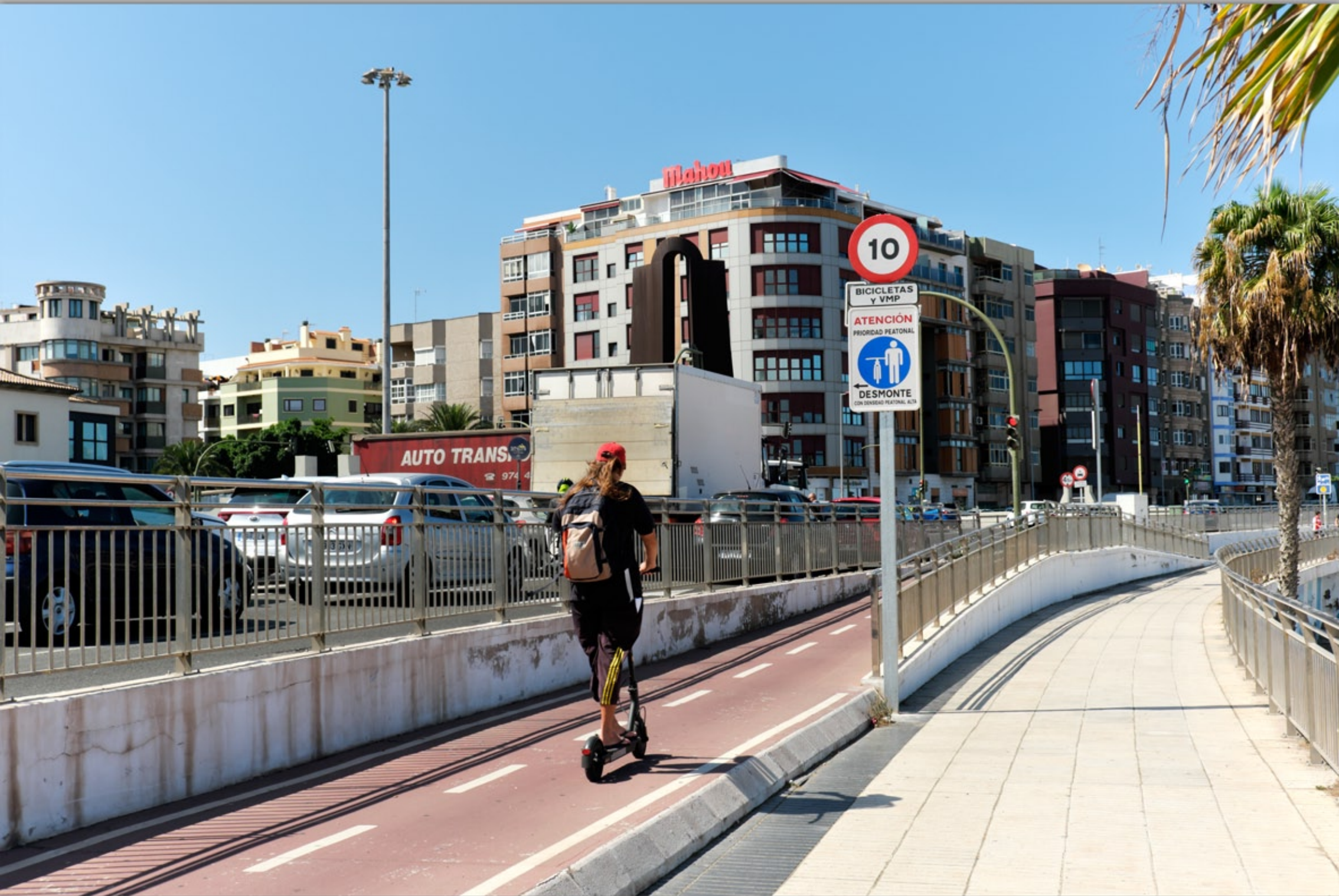
LAS PALMAS - Ciudad Jardín