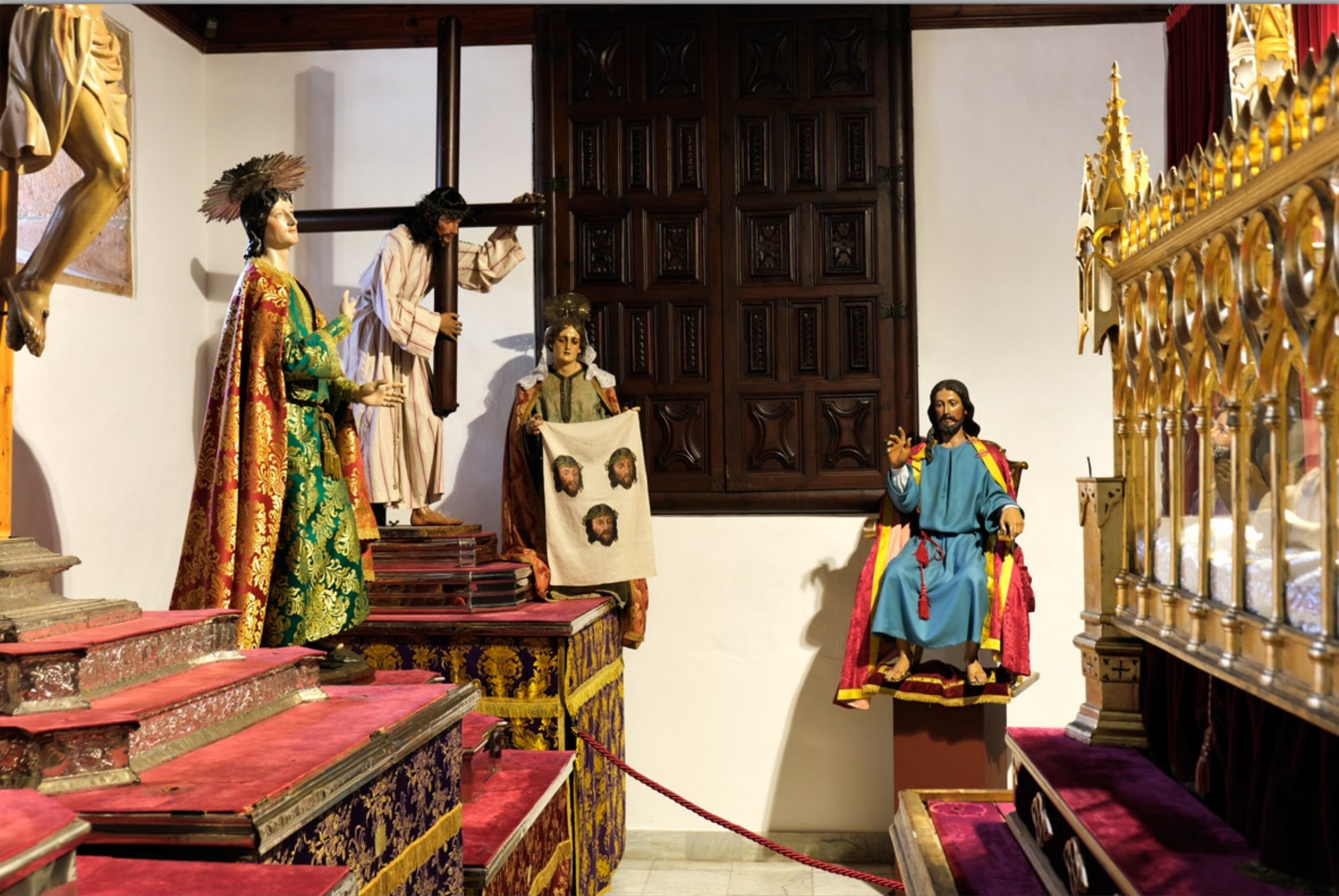
TEROR #Museo Diocesano de Arte Sacro