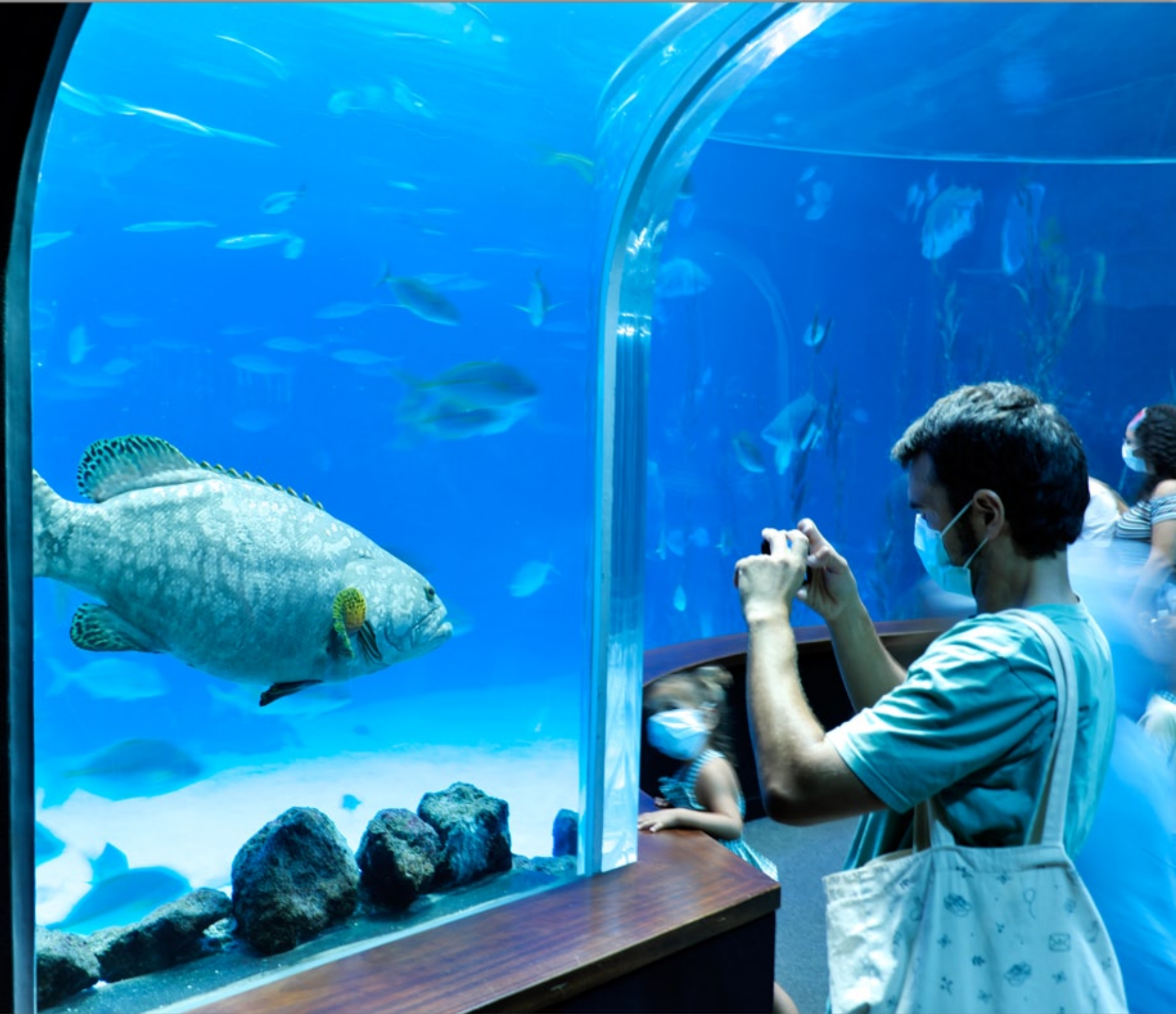
LAS PALMAS - Santa Catalina #Poema del Mar (Aquarium)