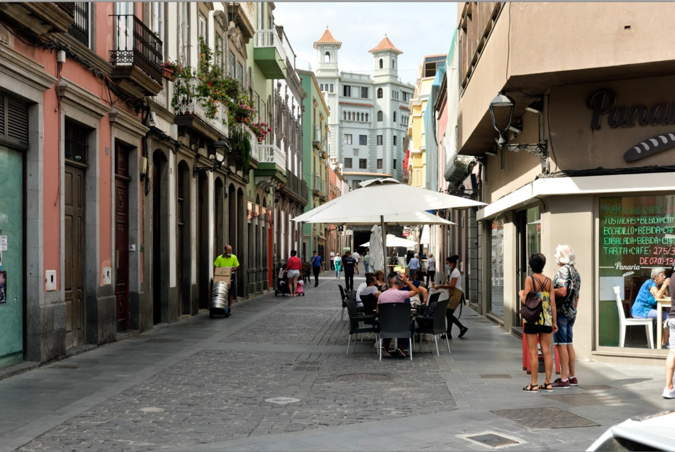
LAS PALMAS - Triana #Calle Triana (Einkaufstrasse)