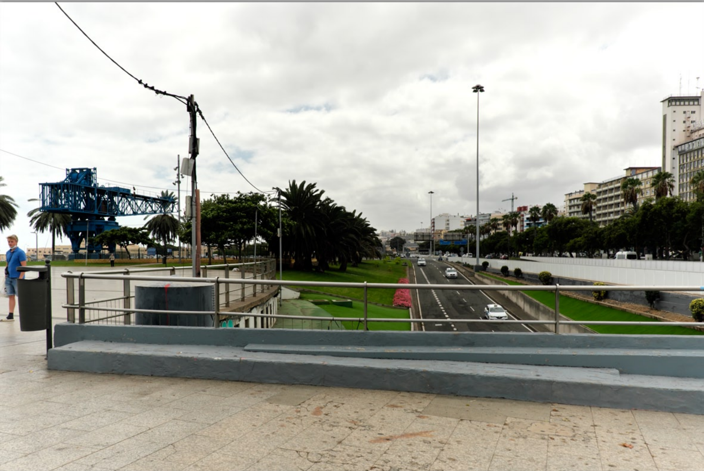
LAS PALMAS - Santa Catalina #Parque Santa Catalina