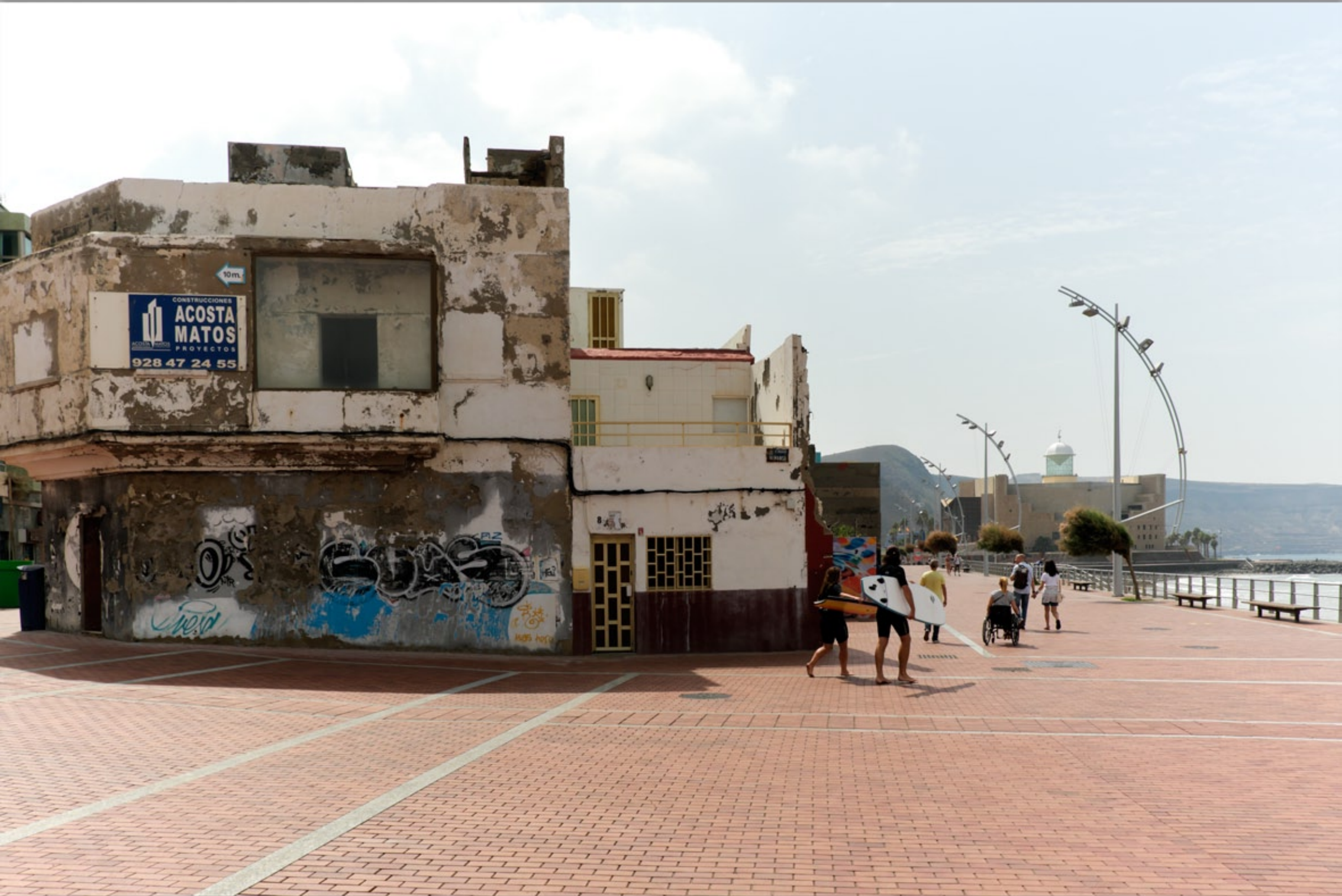
LAS PALMAS - Guanarteme #Playa de Las Canteras (Strand & Promenade)