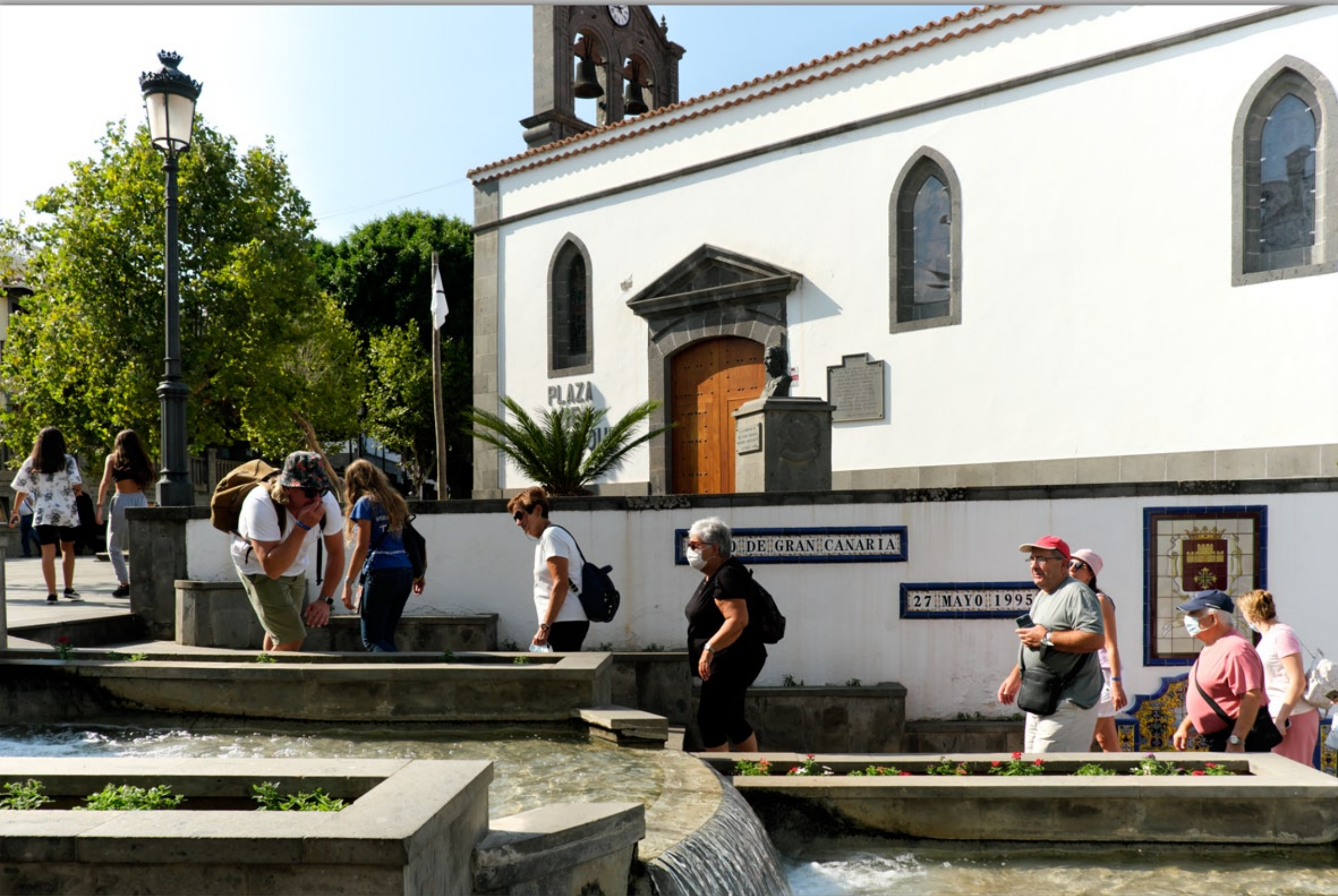
FIRGAS #Promenade Paseo de Gran Canaria #Plaza San Roque