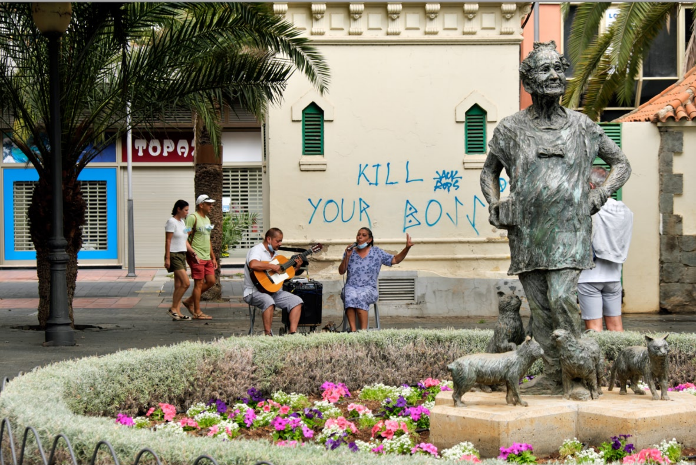
LAS PALMAS #Parque de Santa Catalina