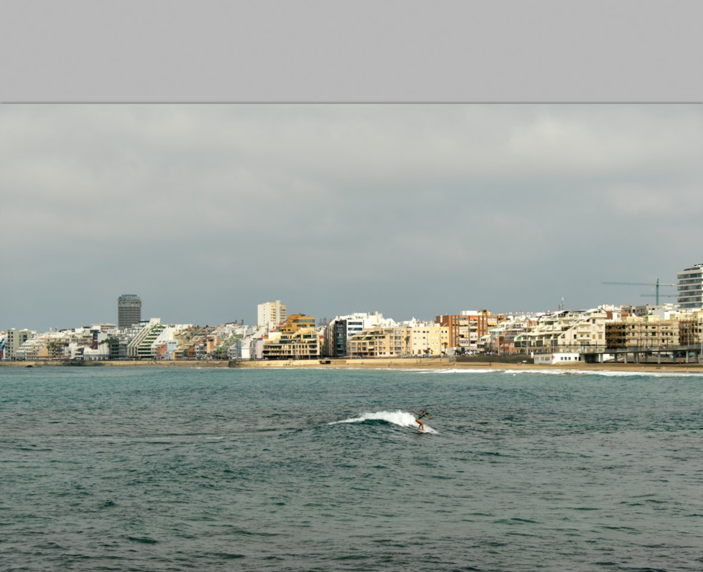
LAS PALMAS - Guanarteme #Playa de Las Canteras (Strand & Promenade)