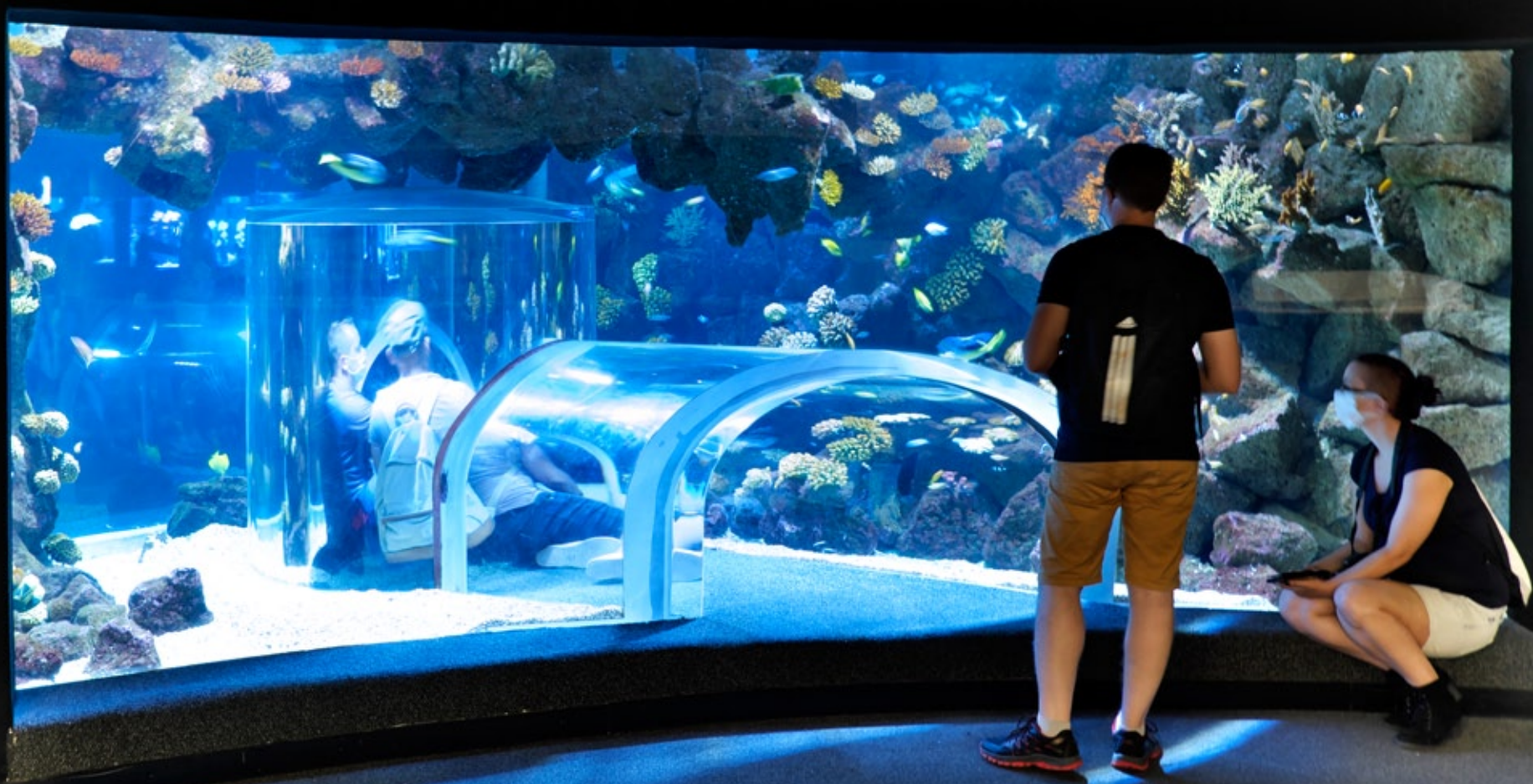
LAS PALMAS - Santa Catalina #Poema del Mar (Aquarium)