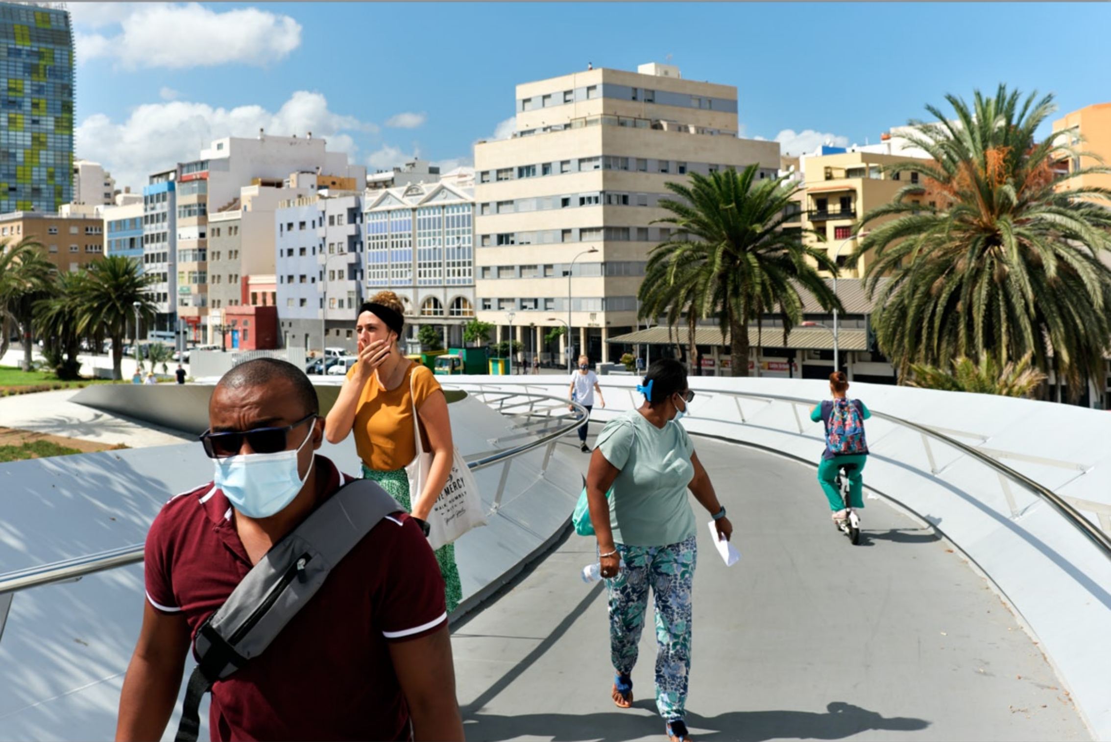
LAS PALMAS - Santa Catalina