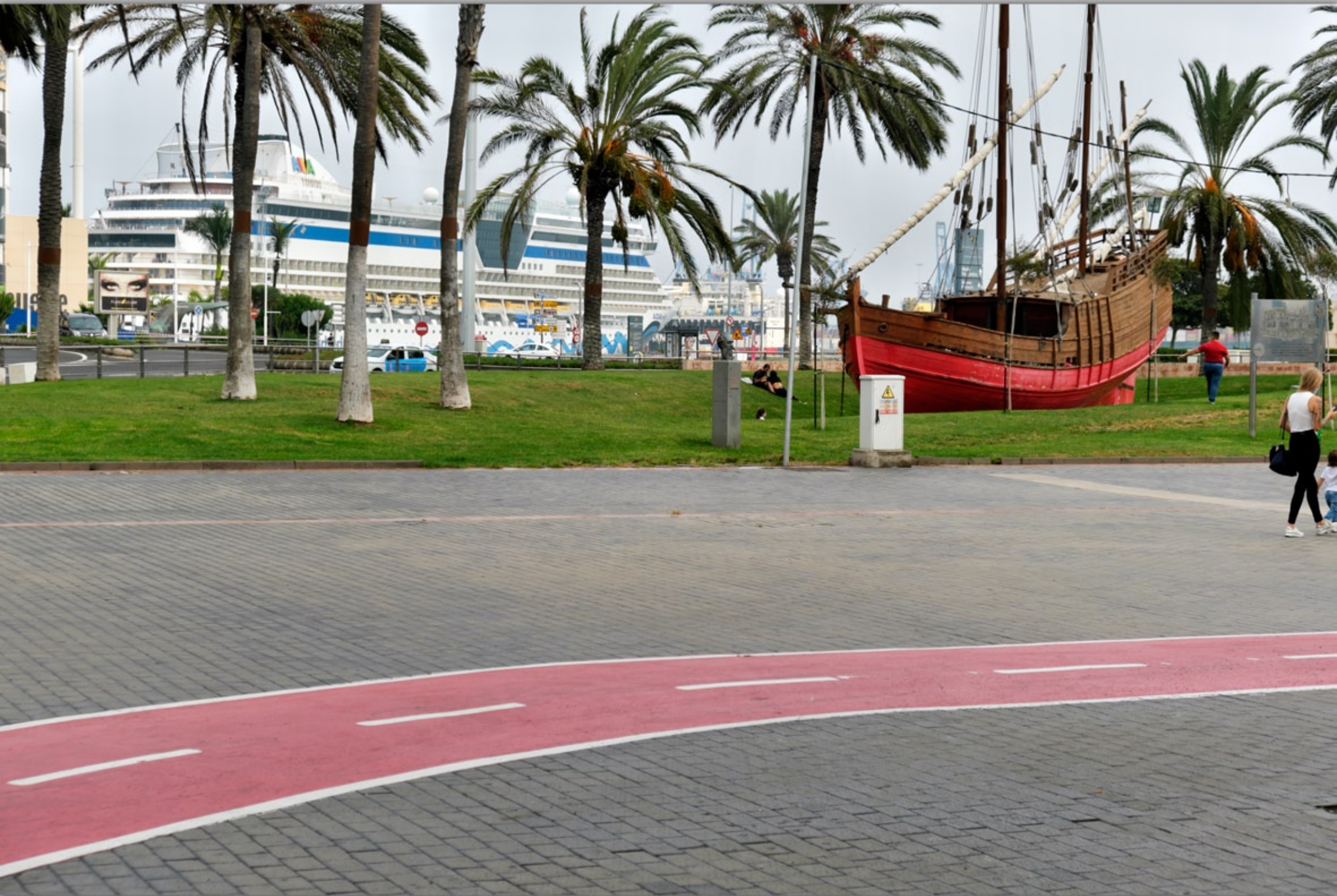
LAS PALMAS - Santa Catalina #Parque de Santa Catalina #Puerto de la Luz #Kreuzfahrtschiff Aida #Nachbau eine Kolumbus-Schiffes