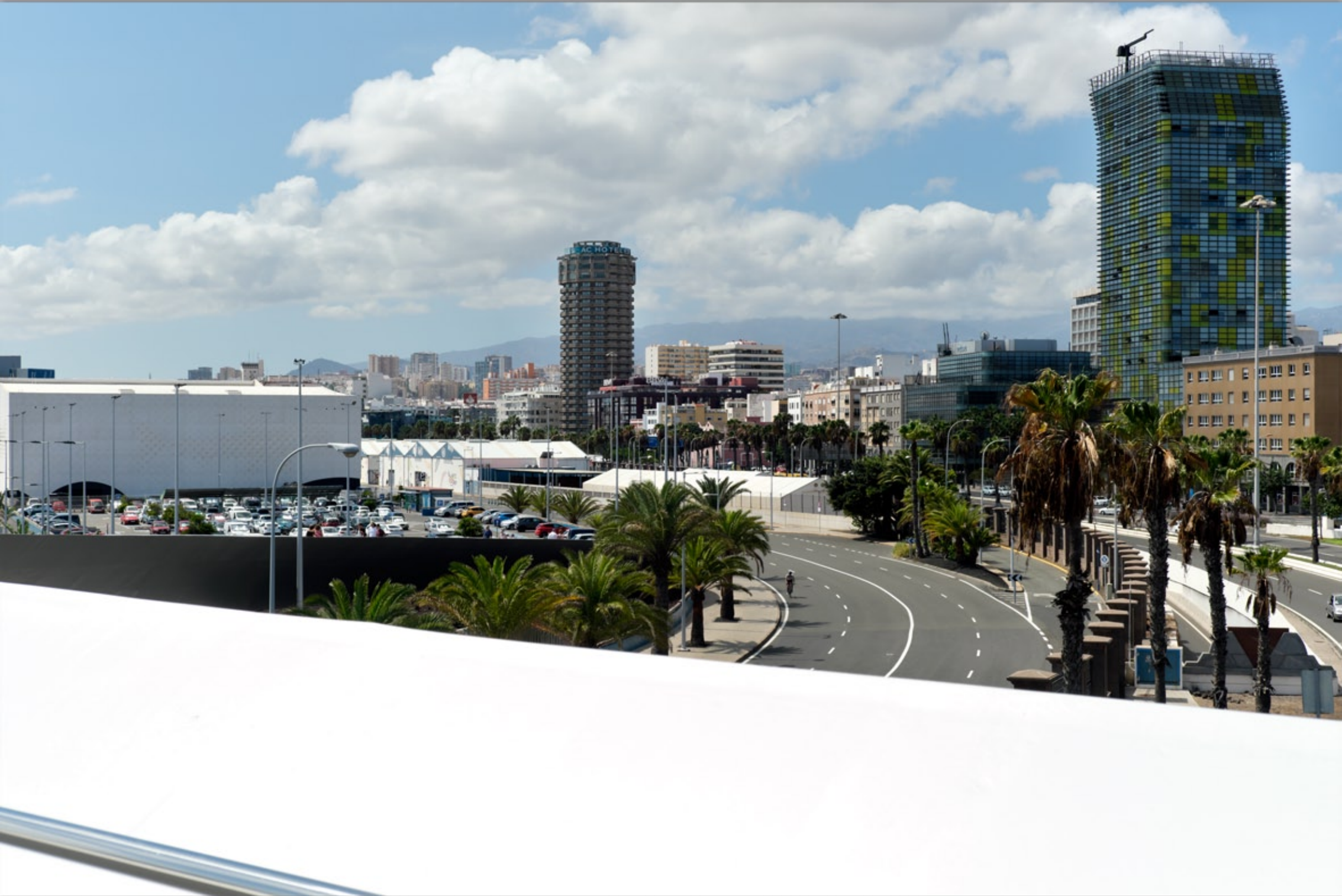
LAS PALMAS - Santa Catalina