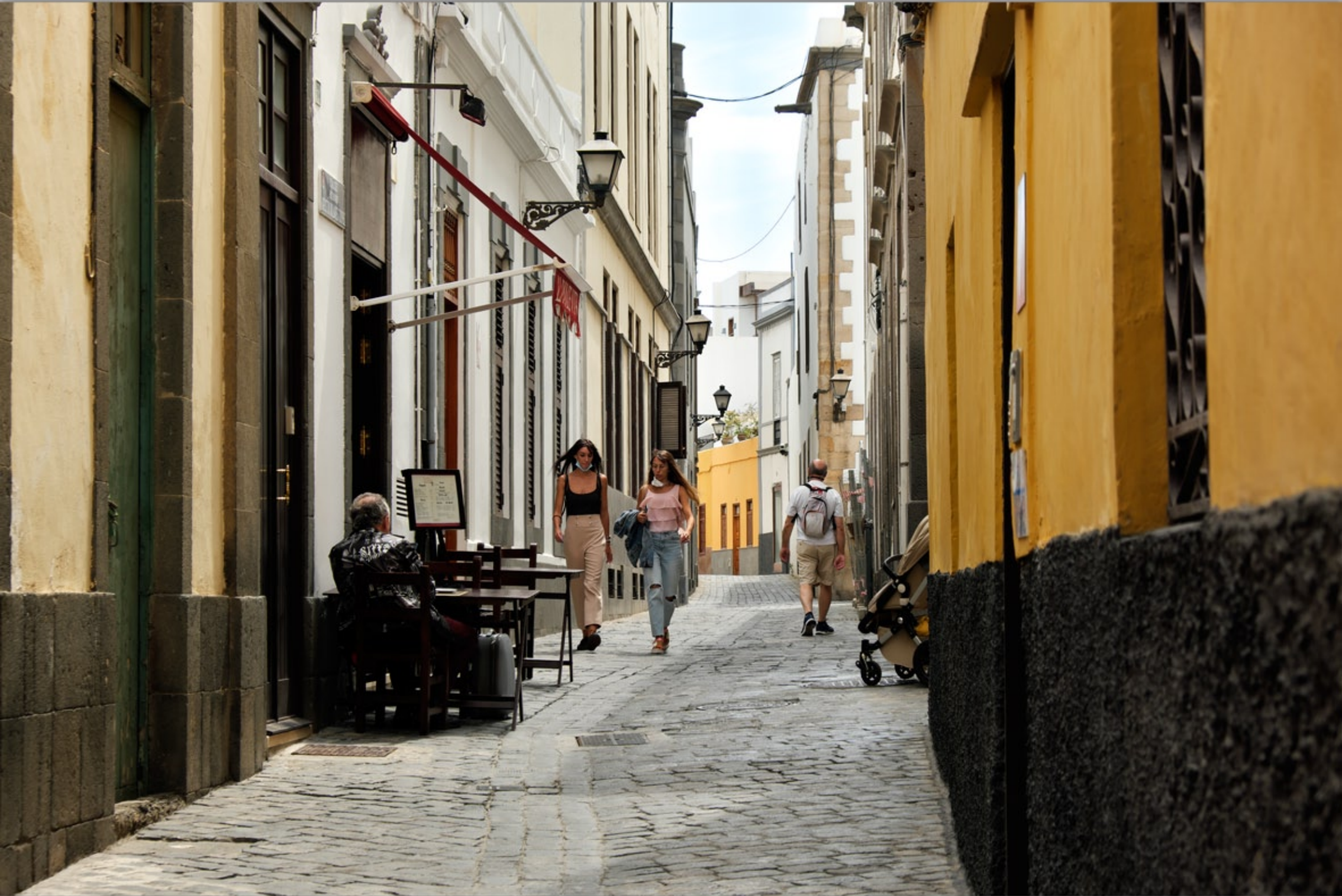
LAS PALMAS - Vegueta (Altstadt)