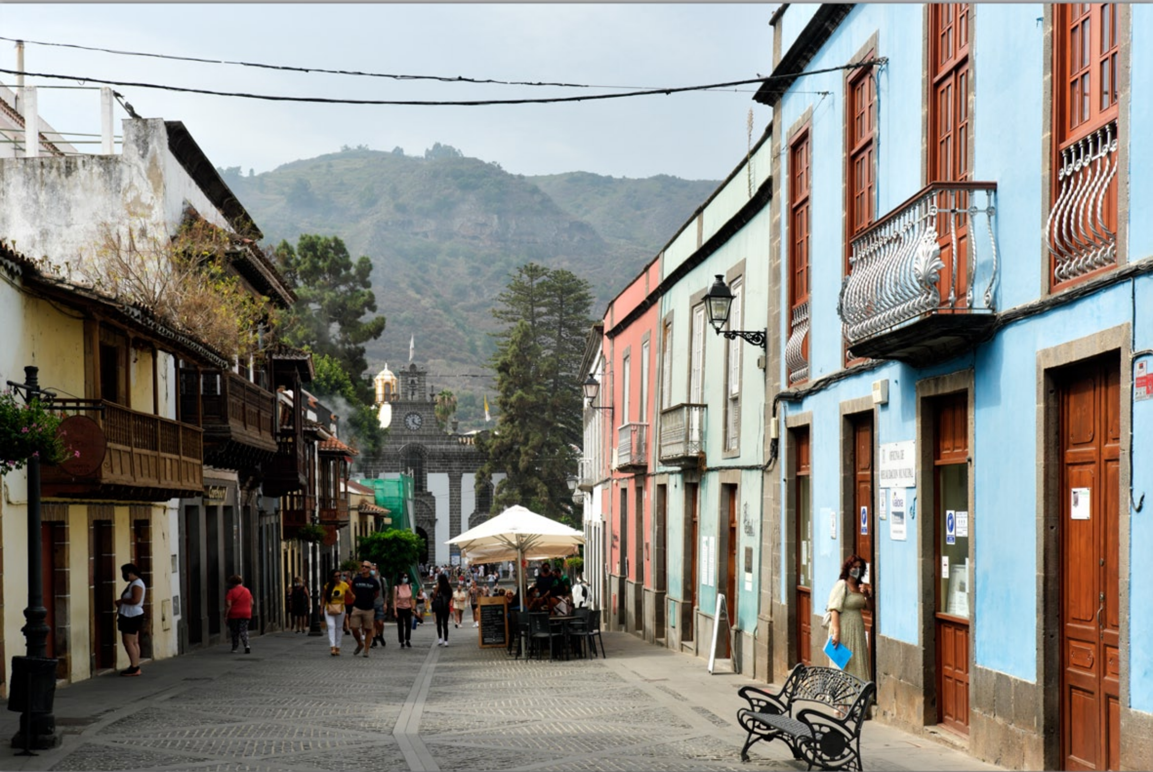
TEROR #Calle Real de la Plaza (Straße der Balkone)