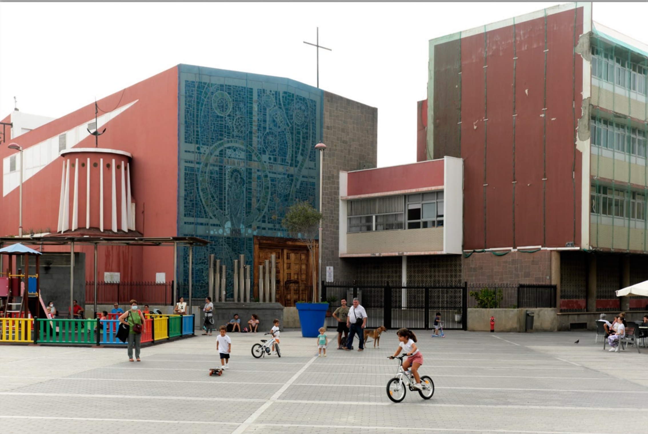
LAS PALMAS - Guanarteme