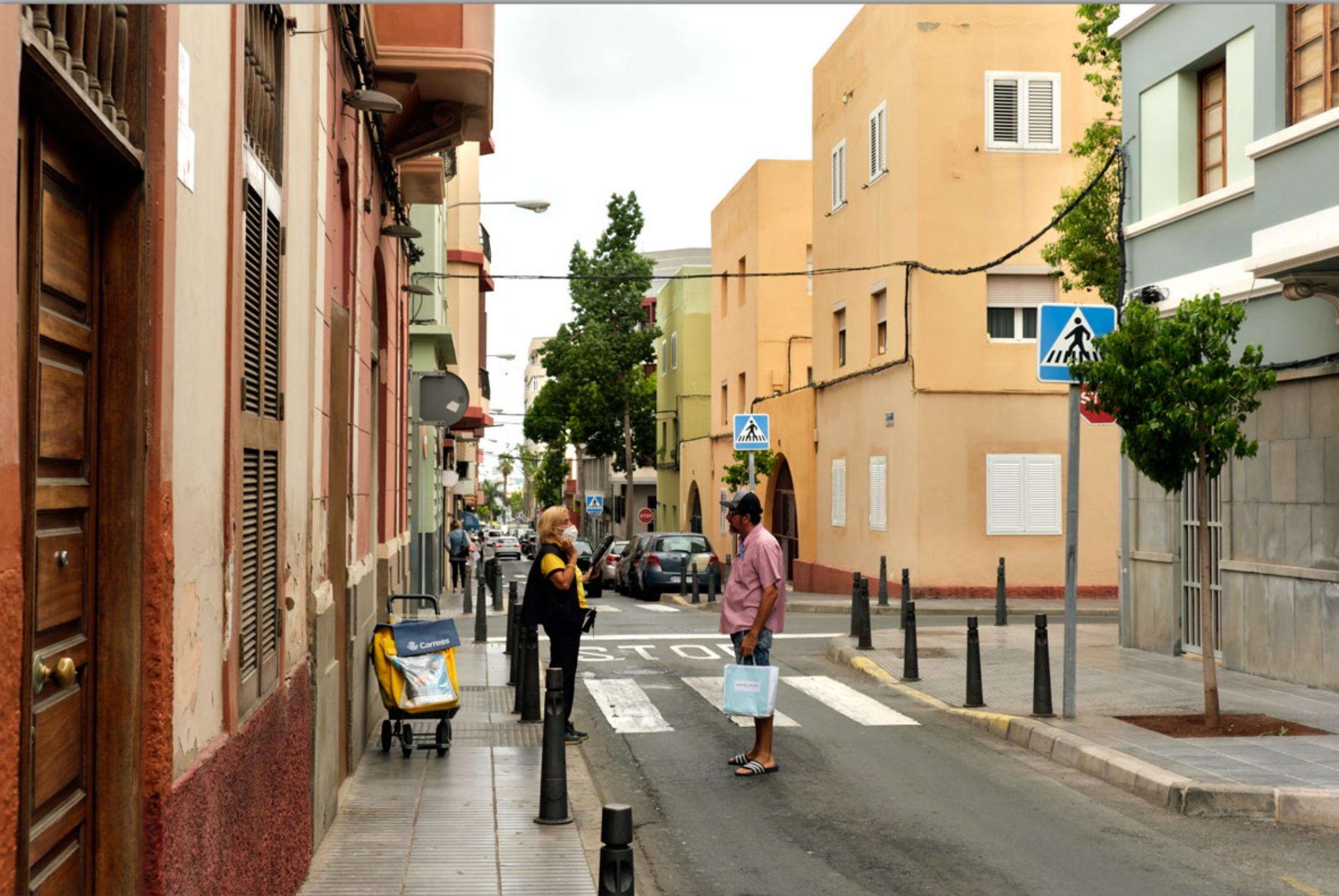
LAS PALMAS - Santa Catalina