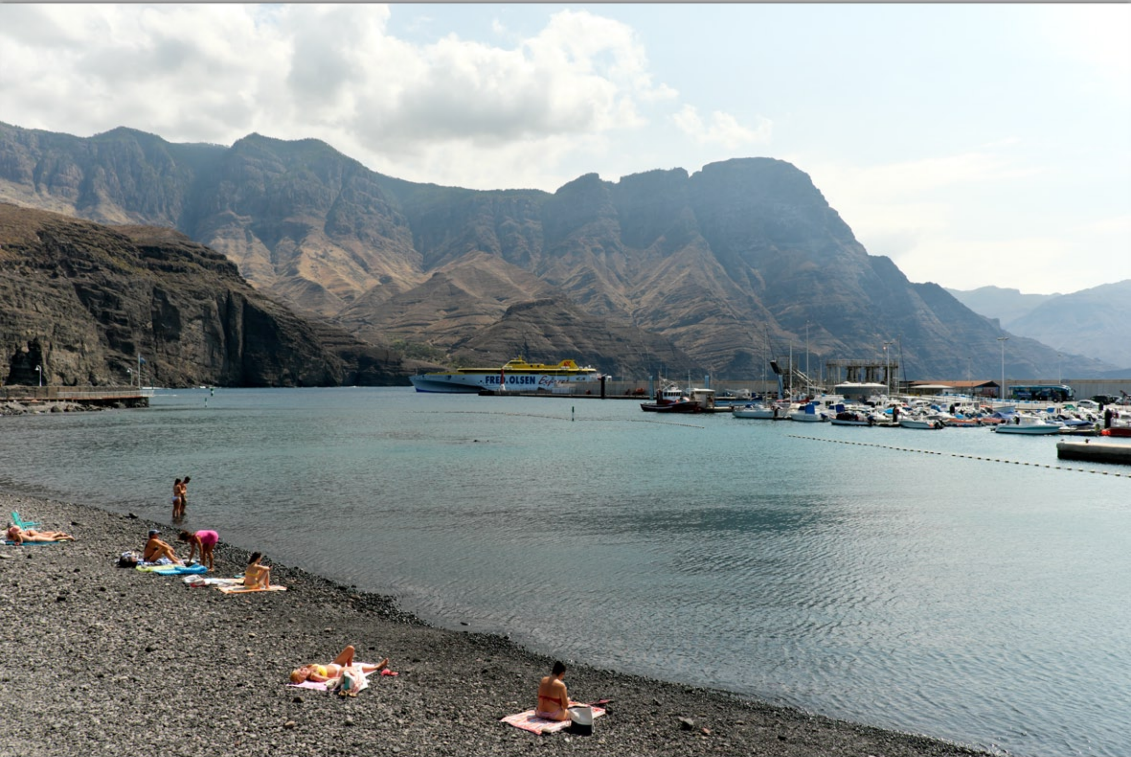
PUERTO DE LAS NIEVES