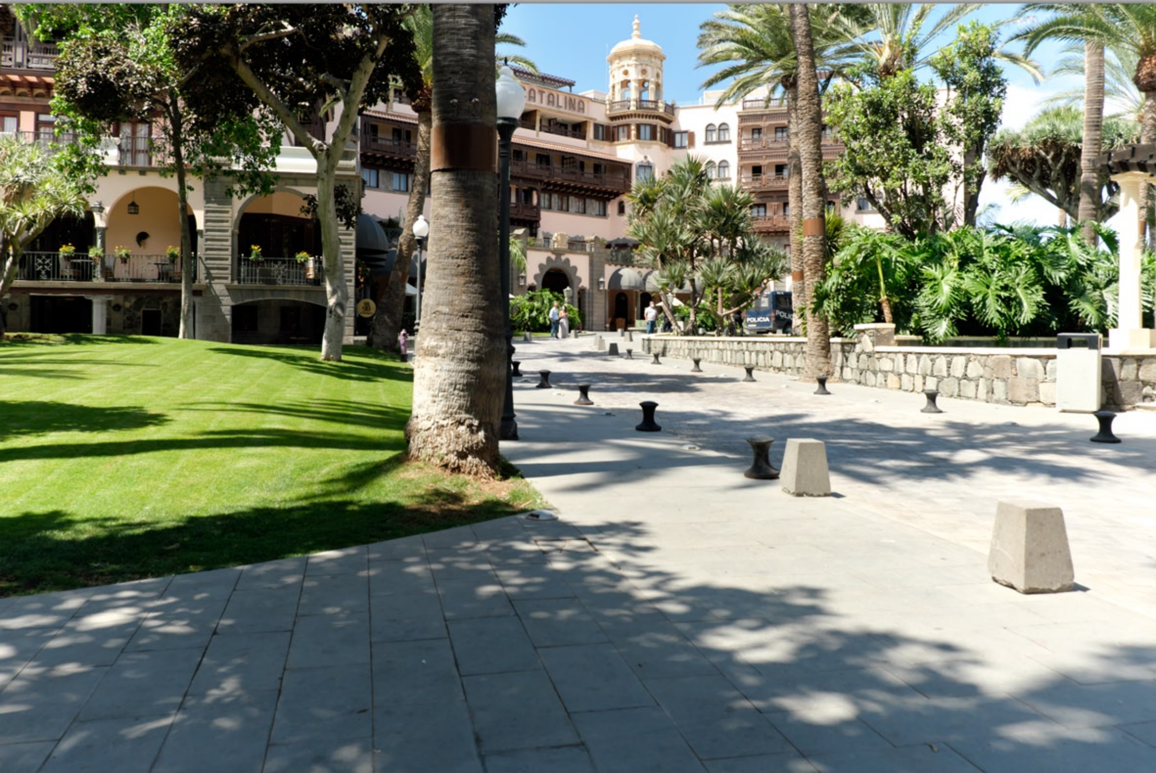
LAS PALMAS - Ciudad Jardin #Parque Doramas #Hotel Santa Catalina