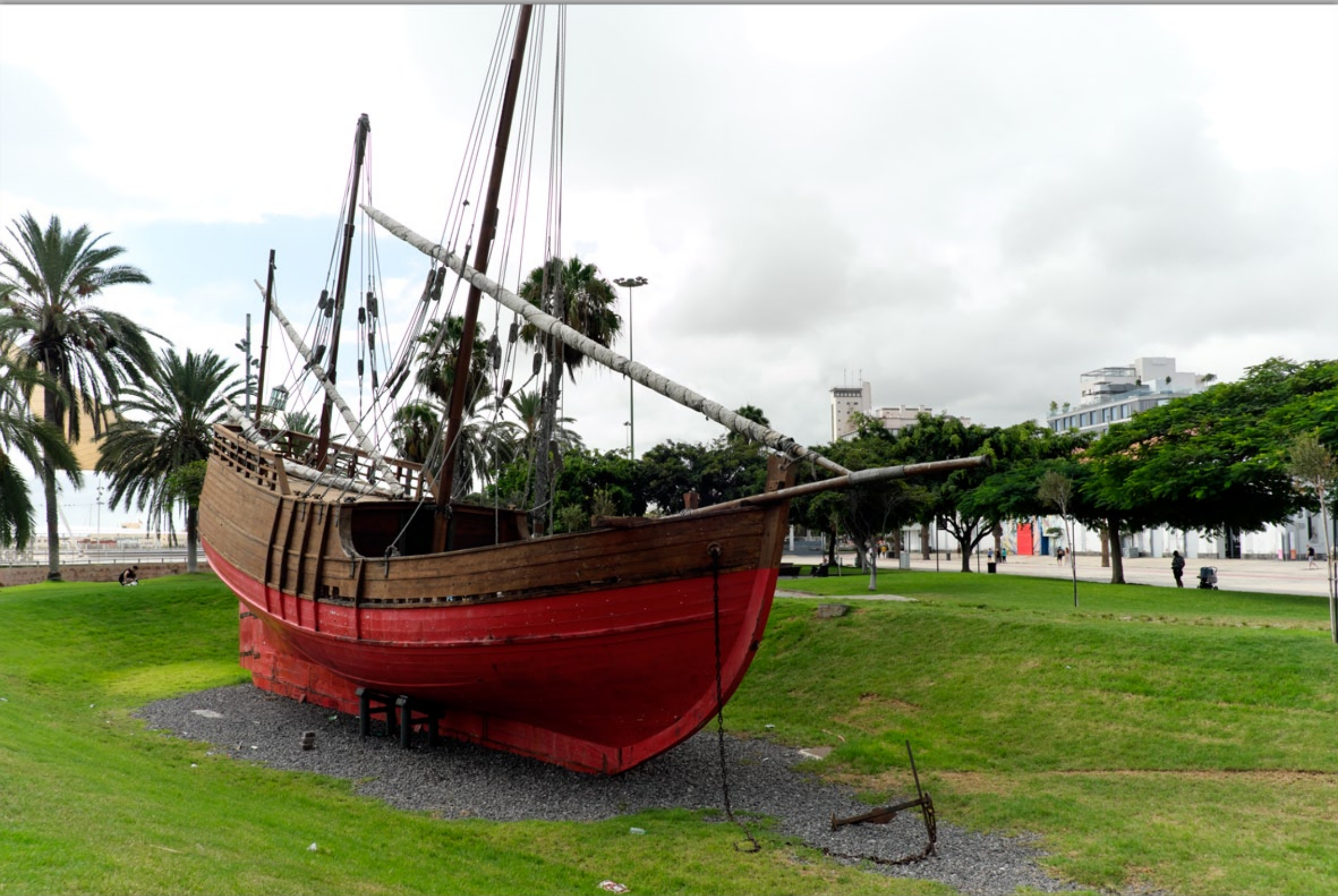
LAS PALMAS - Santa Catalina #Parque de Santa Catalina #Nachbau eines Kolumbus-Schiffes