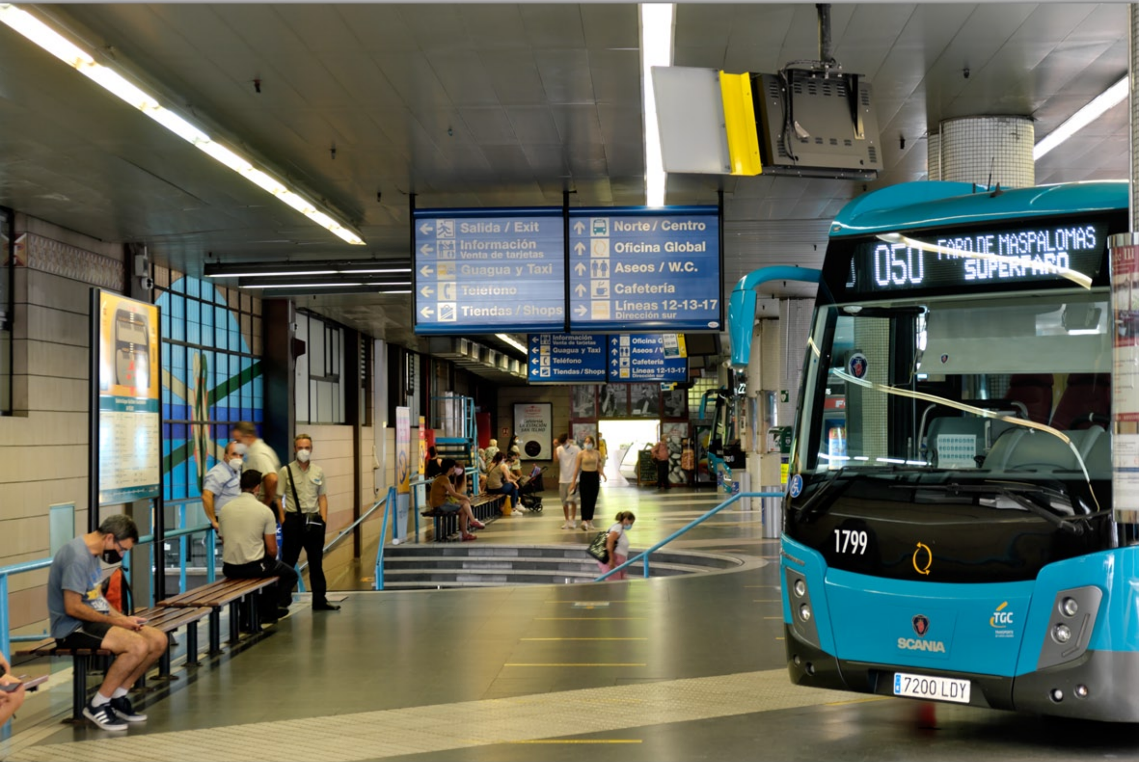
LAS PALMAS - San Telmo #unterirdischer Busbahnhof