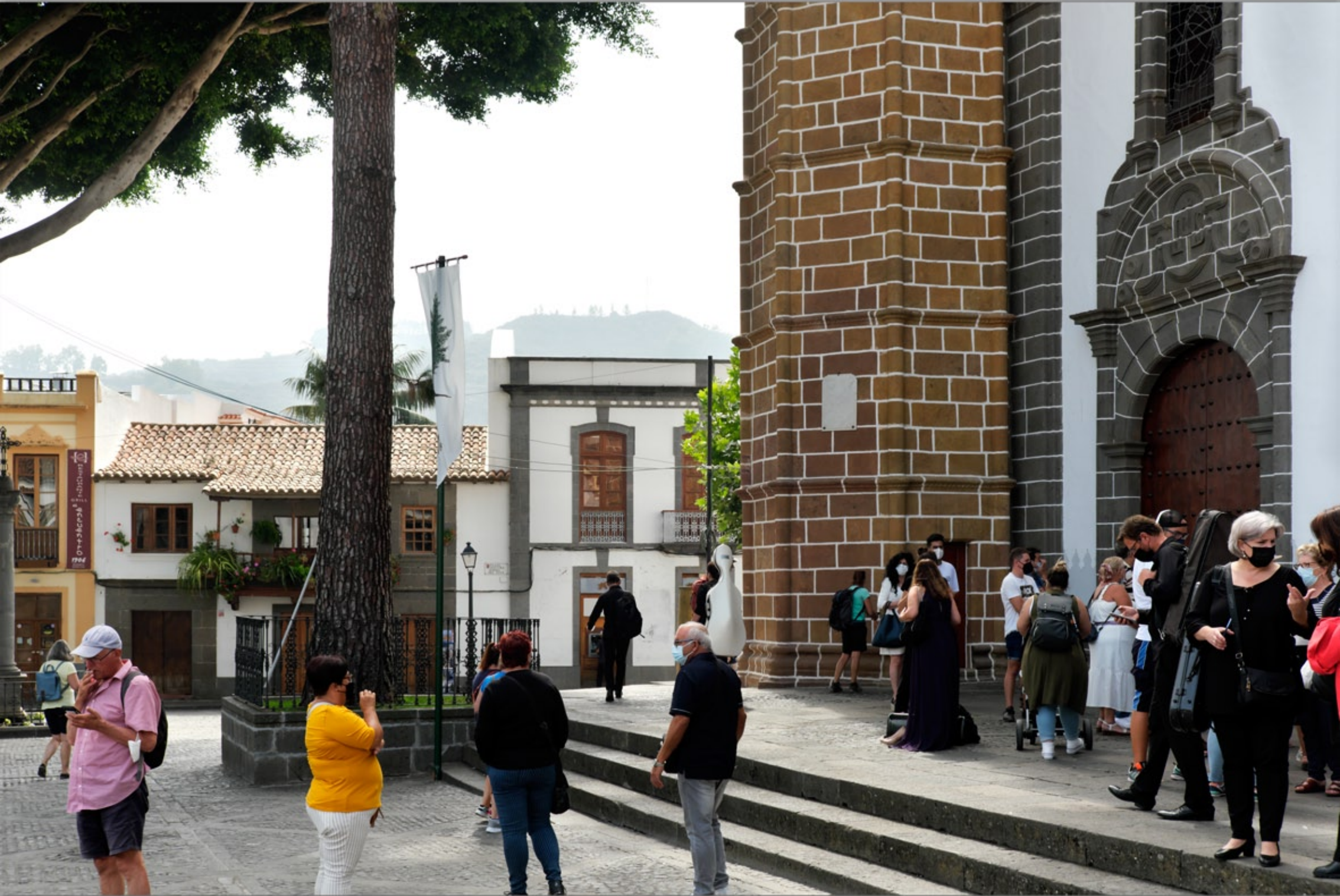
TEROR #Basilica Nuestra Señora Del Pino