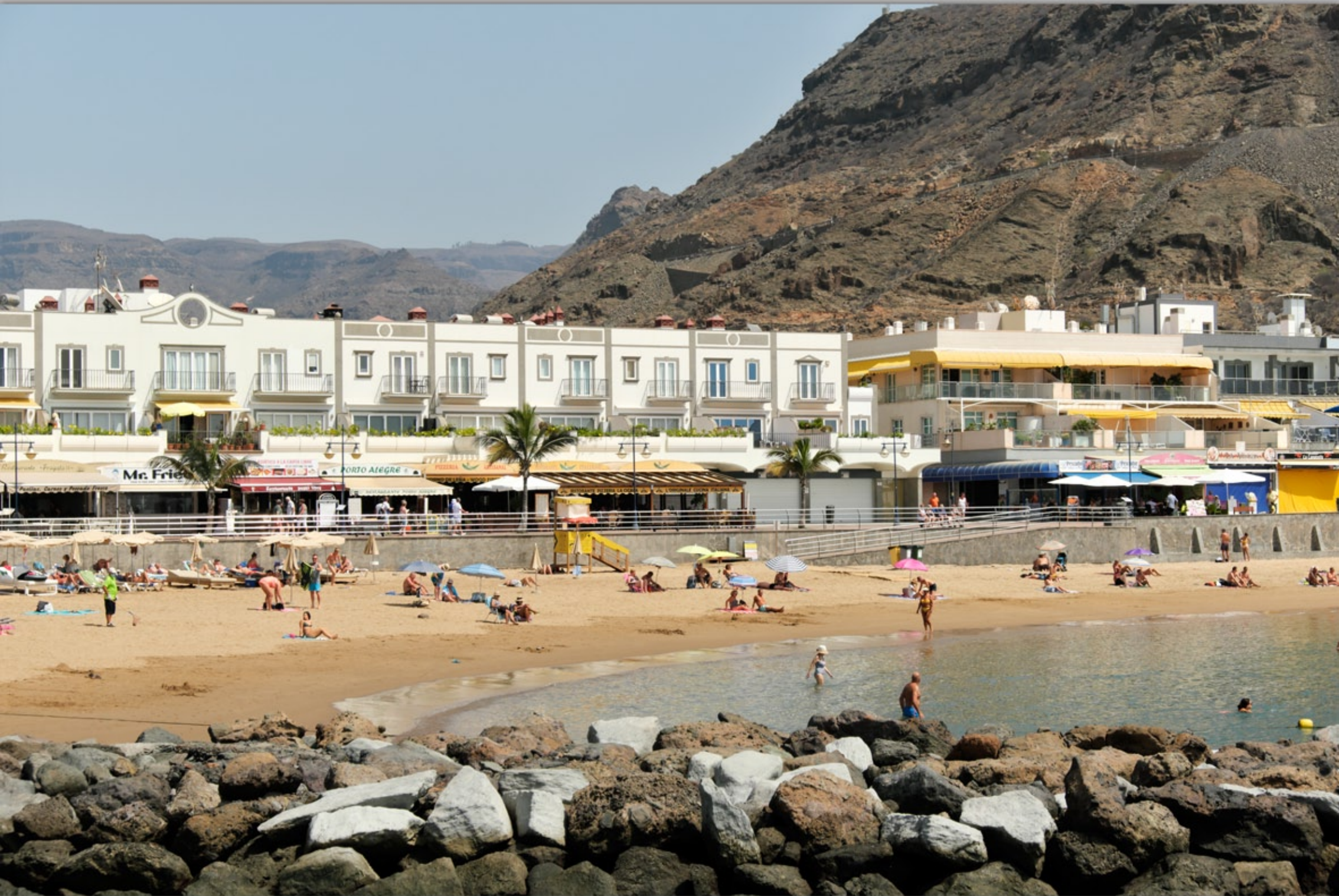
PUERTO DE MOGÁN