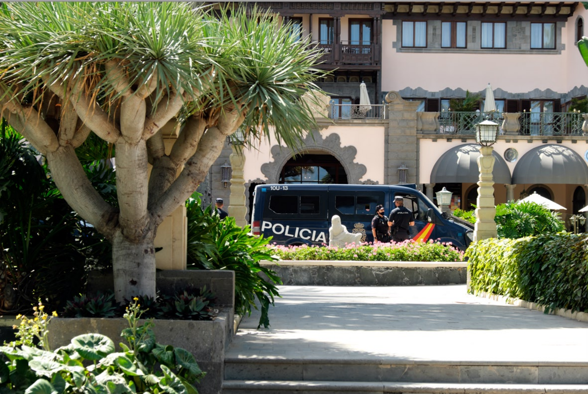
LAS PALMAS - Ciudad Jardin #Parque Doramas #Hotel Santa Catalina