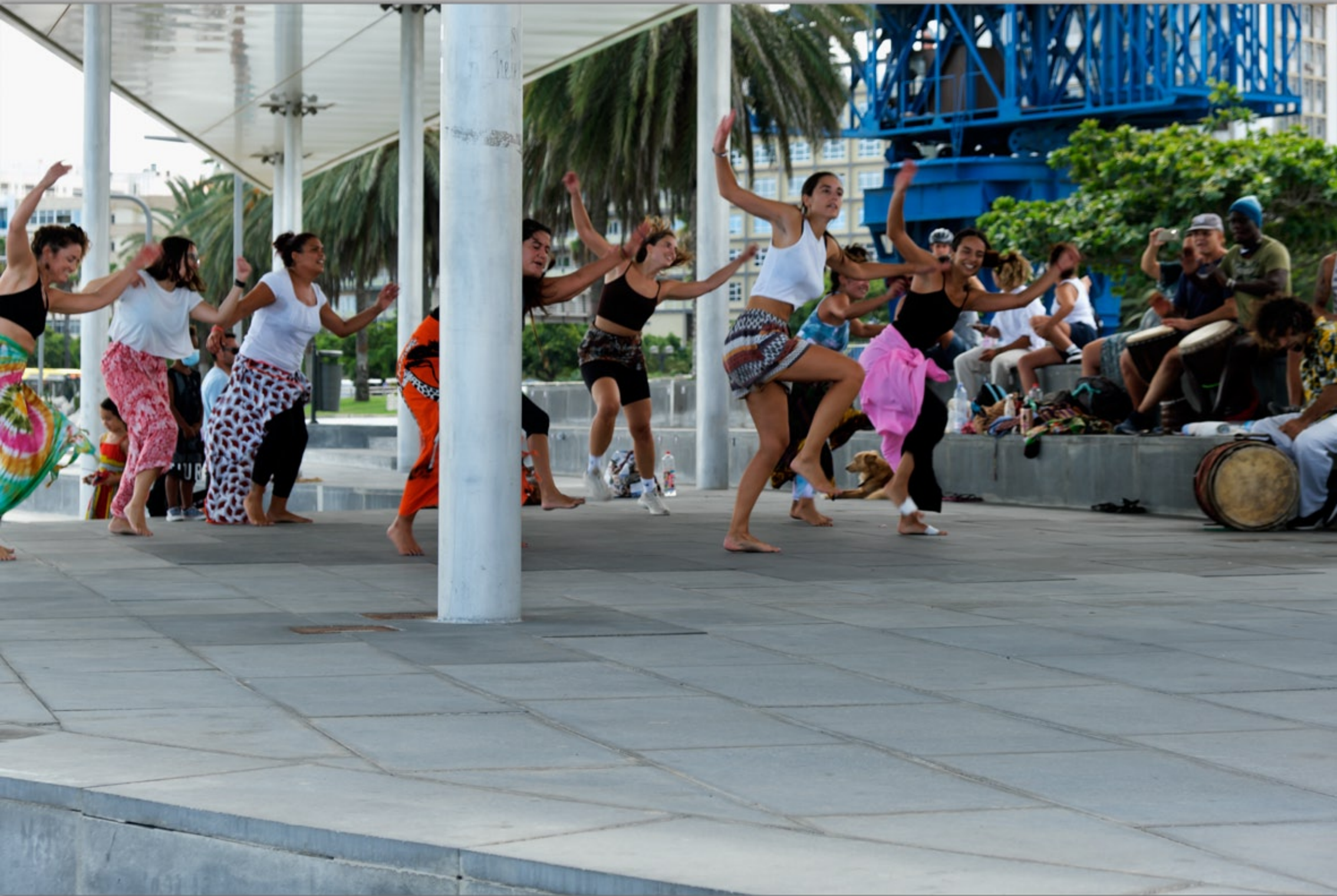
LAS PALMAS - Santa Catalina #Parque de Santa Catalina