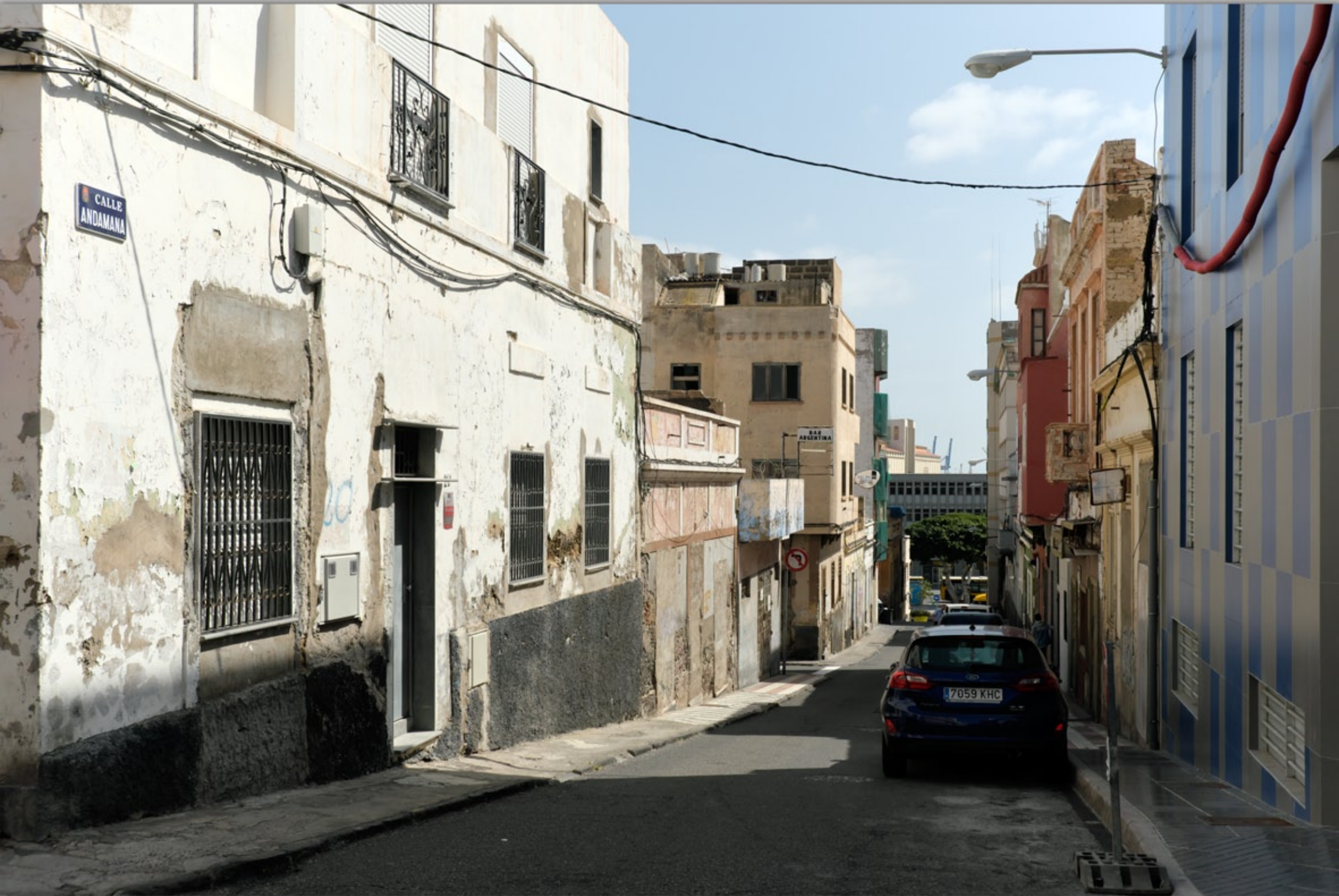
LAS PALMAS - Puerto