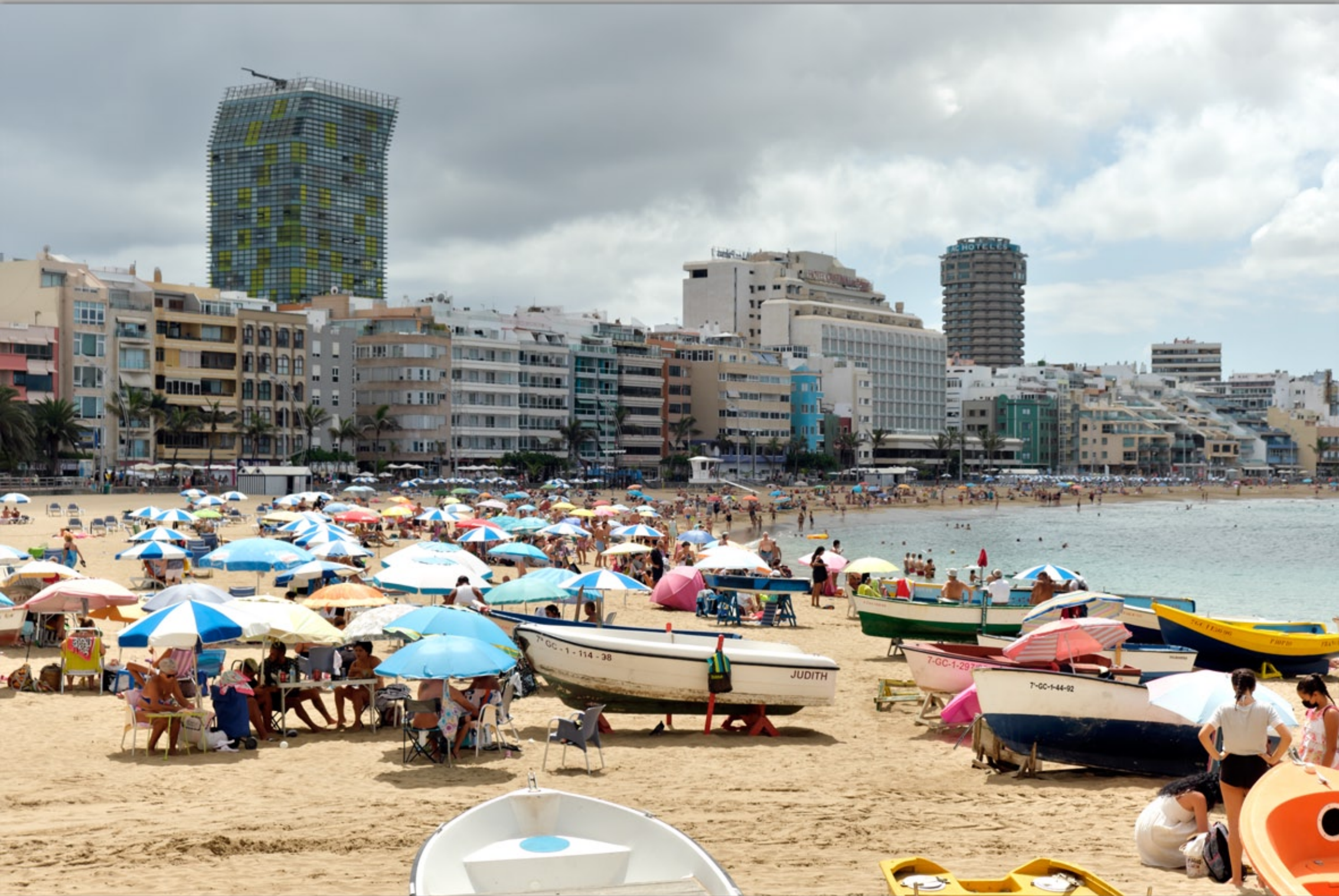
LAS PALMAS - Santa Catalina #Playa de Las Canteras (Strand & Promenade)